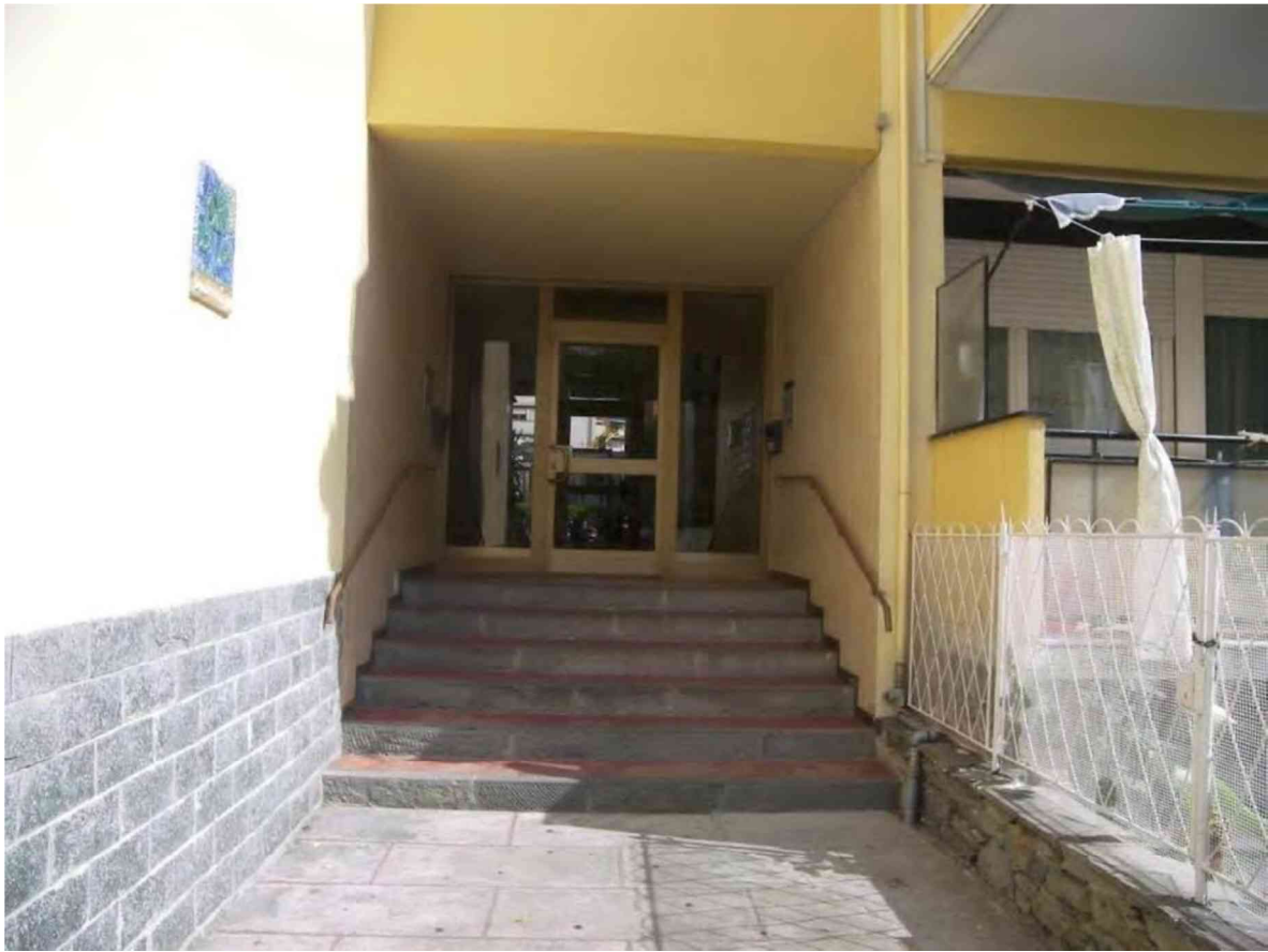
Foto 2 dettaglio ingresso al Condominio