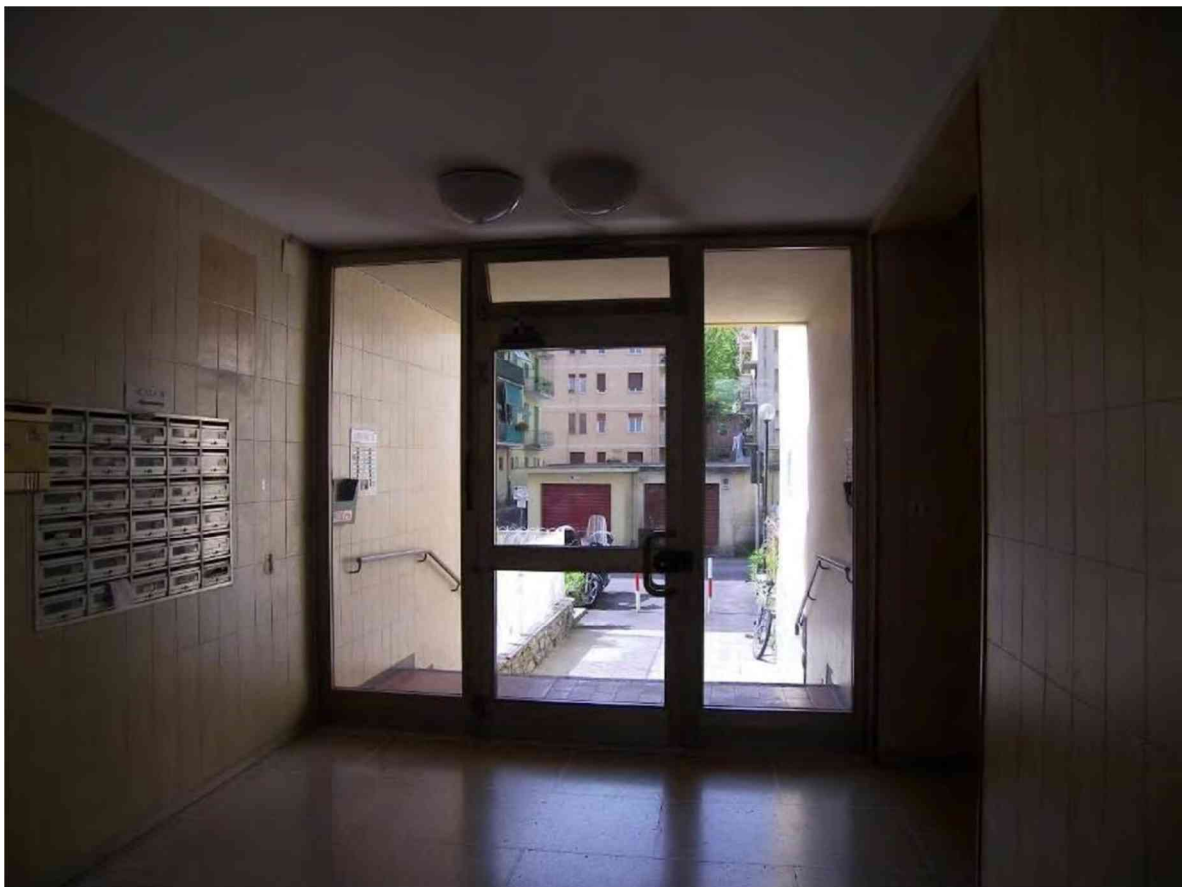
Foto 3 dettaglio atrio Condominiale