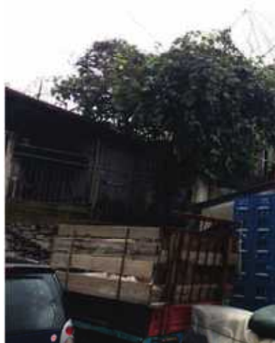
BARACCA CON TETTOIA