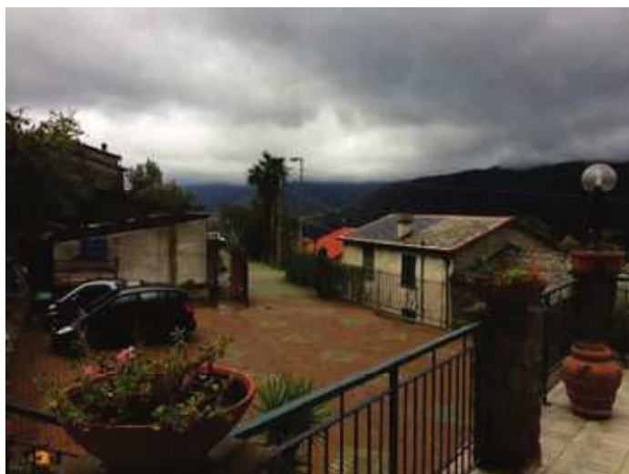
AREA A PARCHEGGIO

Detta area risulta recintata con inferriata metallica e cancello carrabile sempre in metallo. La pavimentazione, sia dell'area a parcheggio che del dehor (su cui insiste un'ampia tenda) è stata realizzata in tozzetti di porfido su disegno. La fascia di terreno soprastante al parcheggio e quindi al muro di sostegno in pietra (che risulterebbe ancora all'interno della zona "satura") e raggiungibile tramite la scala che porta al terrazzo ove trova accesso l'immobile ad uso residenziale, risulta pavimentata con mattonelle in graniglia e contornata a margine da un filare di ulivi. In prossimità della casa è presente un forno da giardino e un piccolo volume tecnico che ospita la calderina del piano terreno (Agriturismo). In fondo alla fascia sopra descritta risulta presente una piccola baracca in lamiera con rete e cancelletto atta ad ospitare animali.