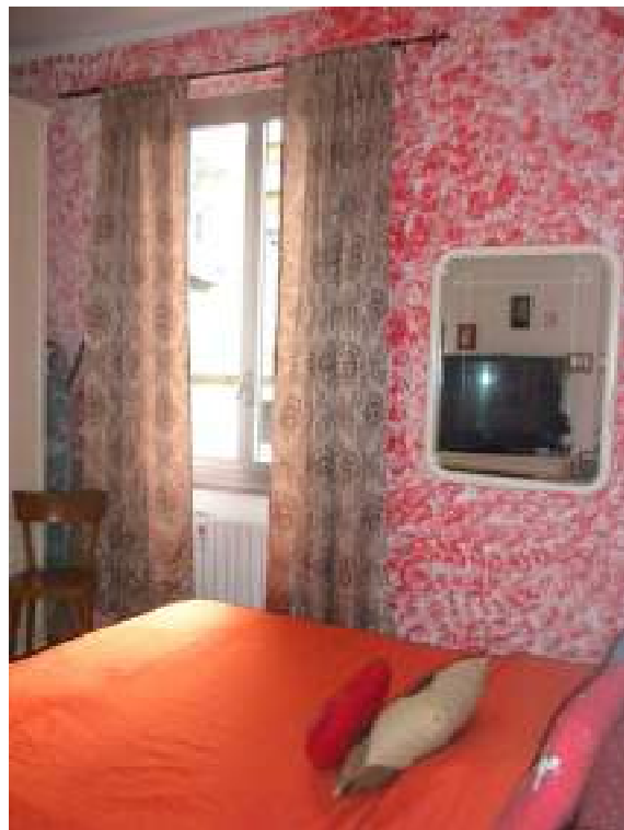
Fotografia n. 11 – camera/zona giorno