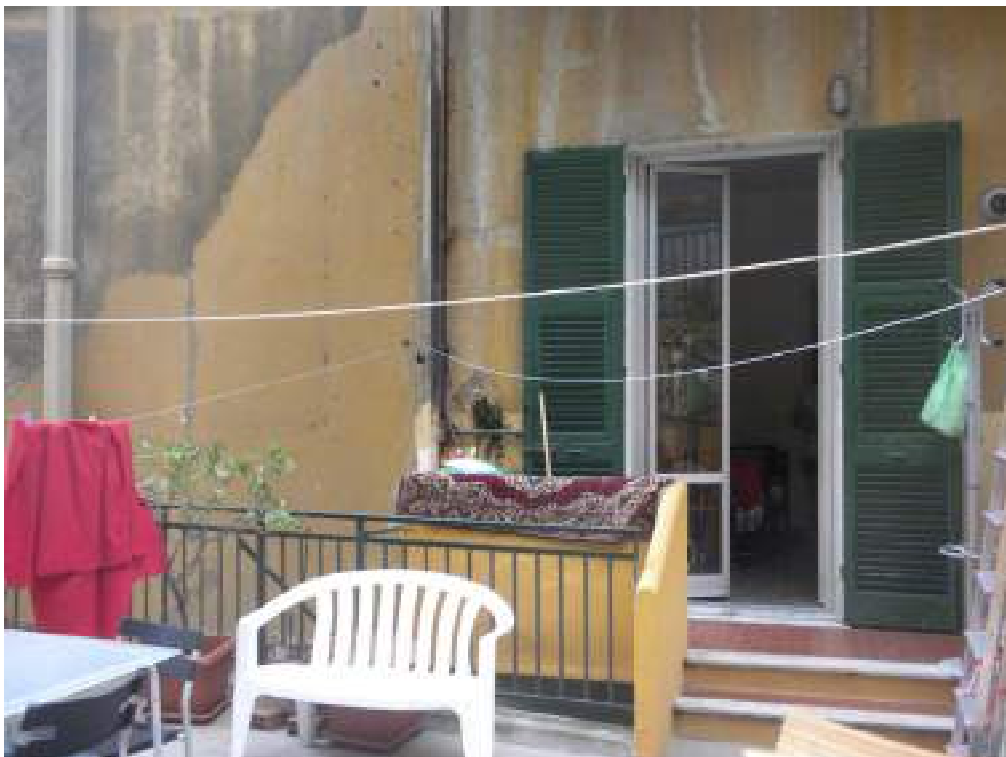
Fotografia n. 17 – porta caposcala cantina