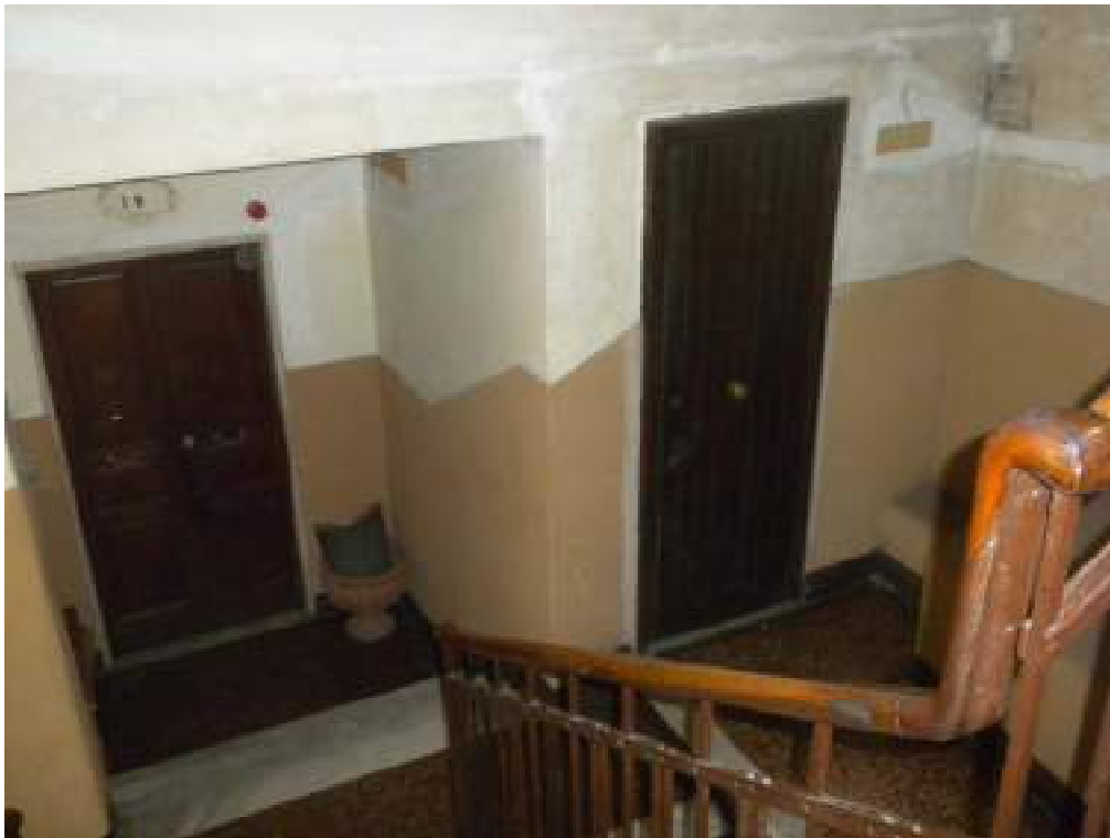
Fotografia n. 18 – cantina