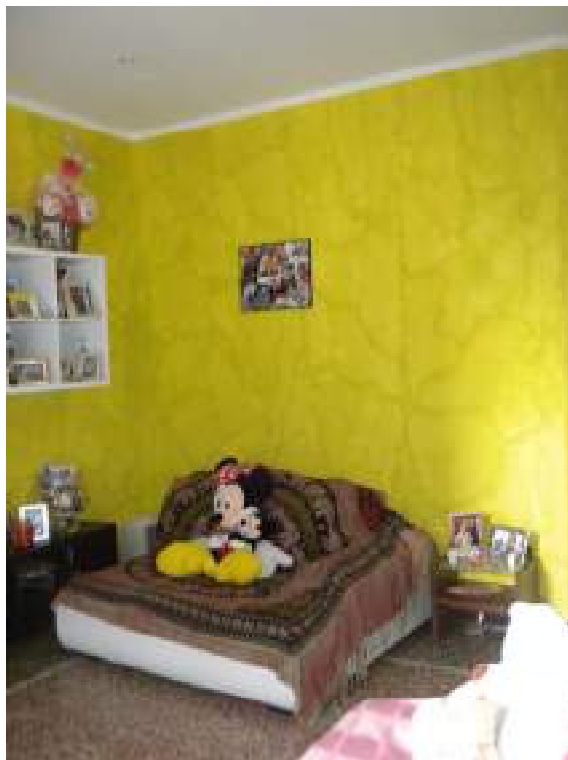
Fotografia n. 12 – camera/zona giorno