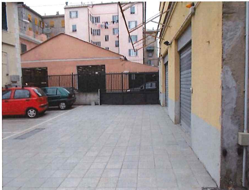
Viste della corte esterna; sullo sfondo il cancello di accesso, a dx imbocco alla corte opposta a via Canobbio.