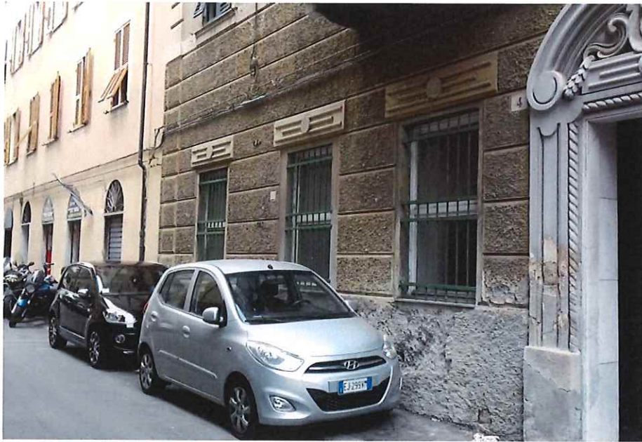
Altra vista (opposta alla precedente) delle tre finestre delle cantine in esame