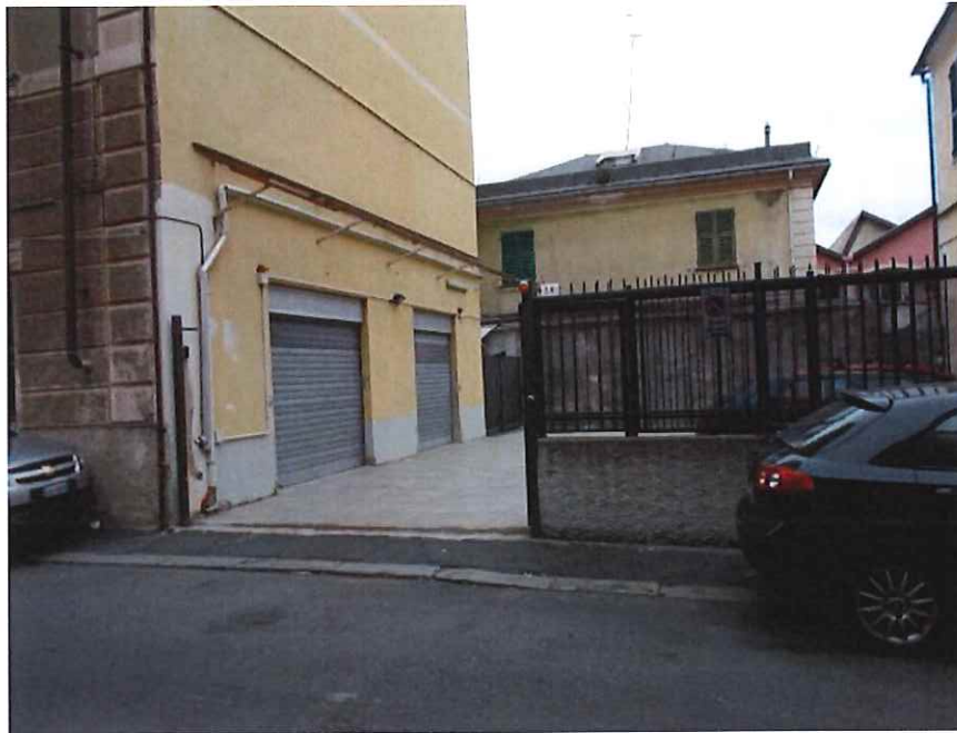
Altra vista da via Canobbio dell' unico accesso alla corte principale. In fondo a sinistra accesso alla corte secondaria di levante

GEOM. GAZZOLO LUIGI E ARCH. GAZZOLO CAMILLA