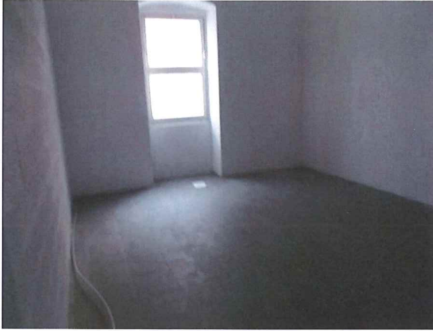
Cantina n.8 vista dall' ingresso