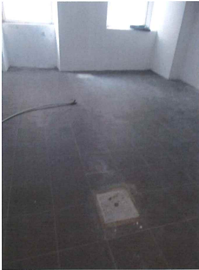
Cantina n. 9 vista dall' ingresso