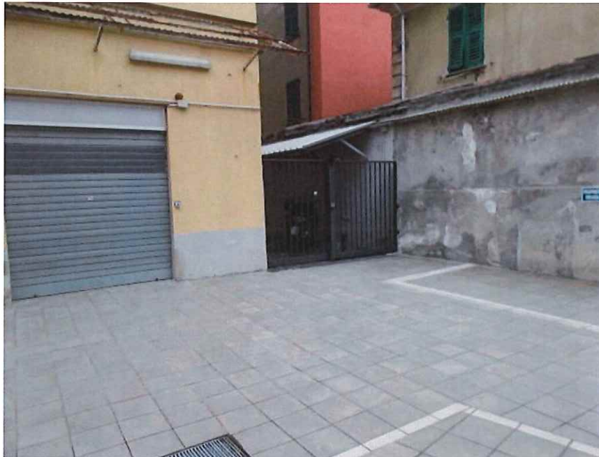
Vista dal piazzale principale della corte opposta a via Canobbio adducente all' ingresso alle cantine

GEOM. GAZZOLO LUIGI E ARCH. GAZZOLO CAMILLA