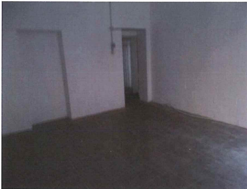
Cantina n.8 vista da parte opposta all' ingresso