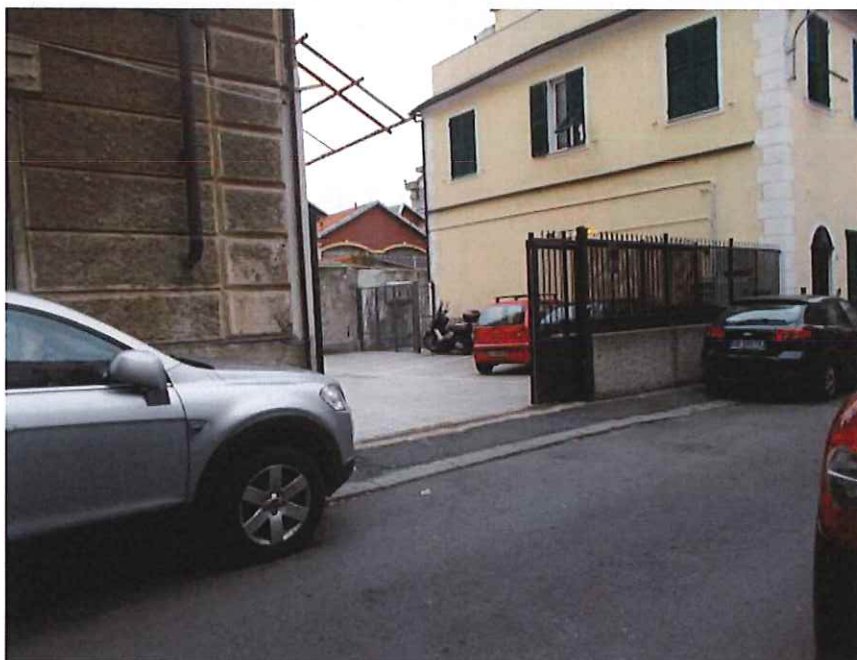
Vista da Via Canobbio dell' unico accesso alle corti esterne ed a quella opposta a tale via avente accesso al piano cantine