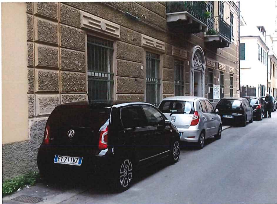
Vista da via Canobbio delle tre finestre delle cantine in esame