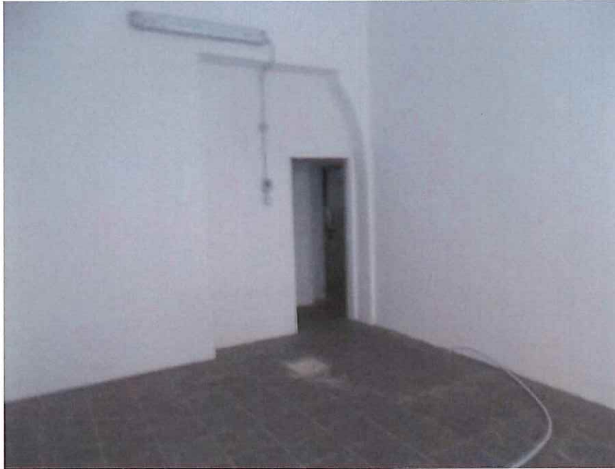
Cantina n.9 vista da parte opposta all' ingresso