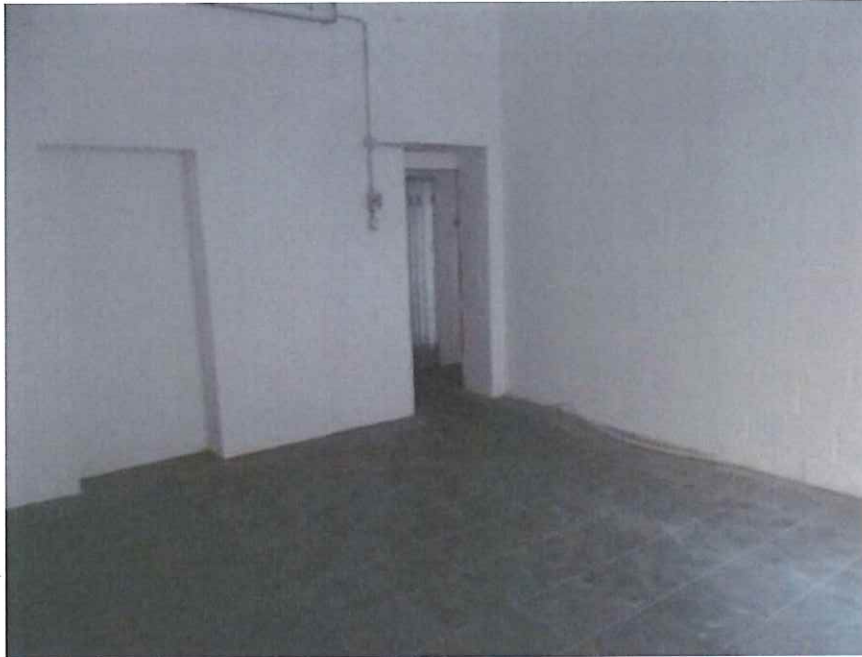
Cantina n. 8 vista da parte opposta all' ingresso

GEOM. GAZZOLO LUIGI E ARCH. GAZZOLO CAMILLA