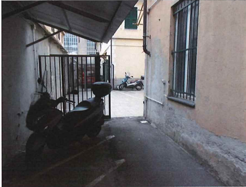
Vista della corte uscendo a dx dal corridoio cantine

GEOM. GAZZOLO LUIGI E ARCH. GAZZOLO CAMILLA