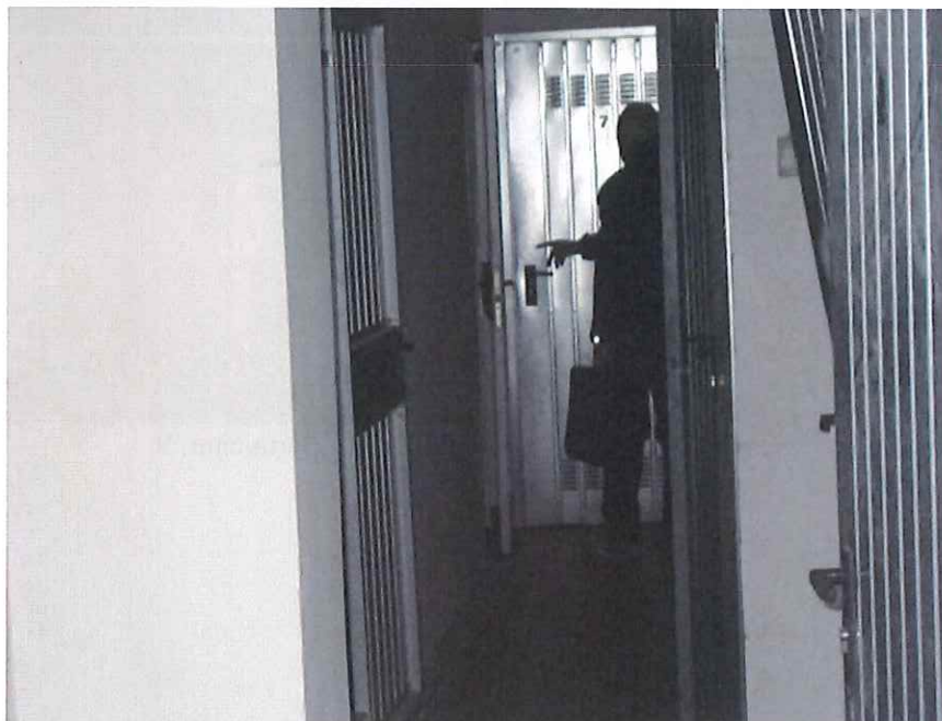
Cantine viste da corridoio: prima porta a sx cant 9 in fondo di fronte a persona ingresso cantina 8