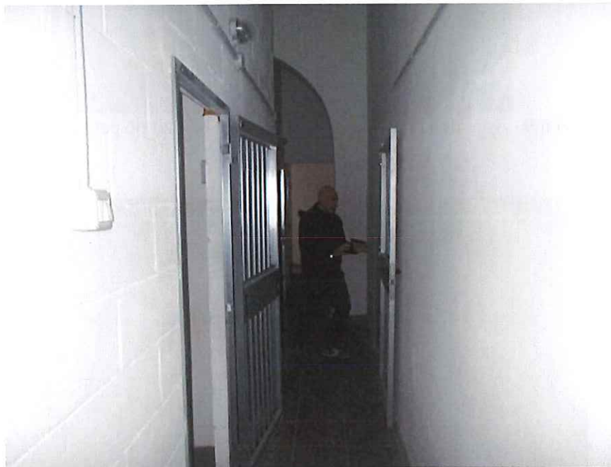
Vista corridoio comune a sx porta cant. 9