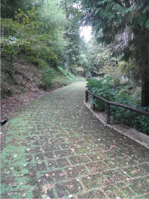
strada di accesso privata