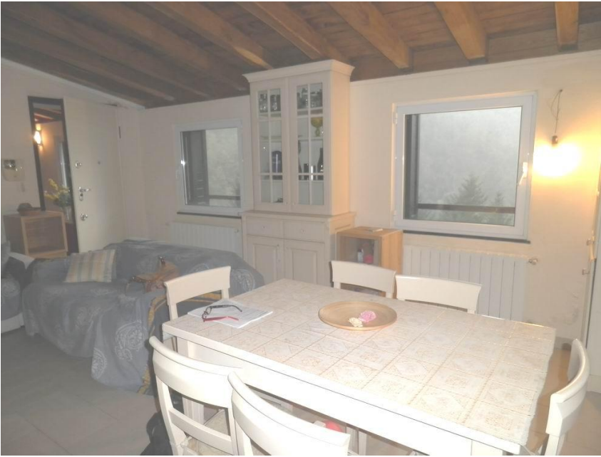
ingresso - soggiorno