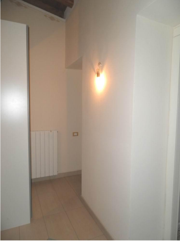
distribuzione zona notte