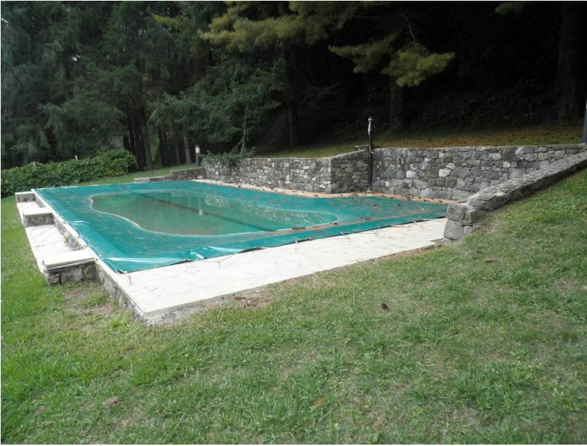
parco con piscina condominiale