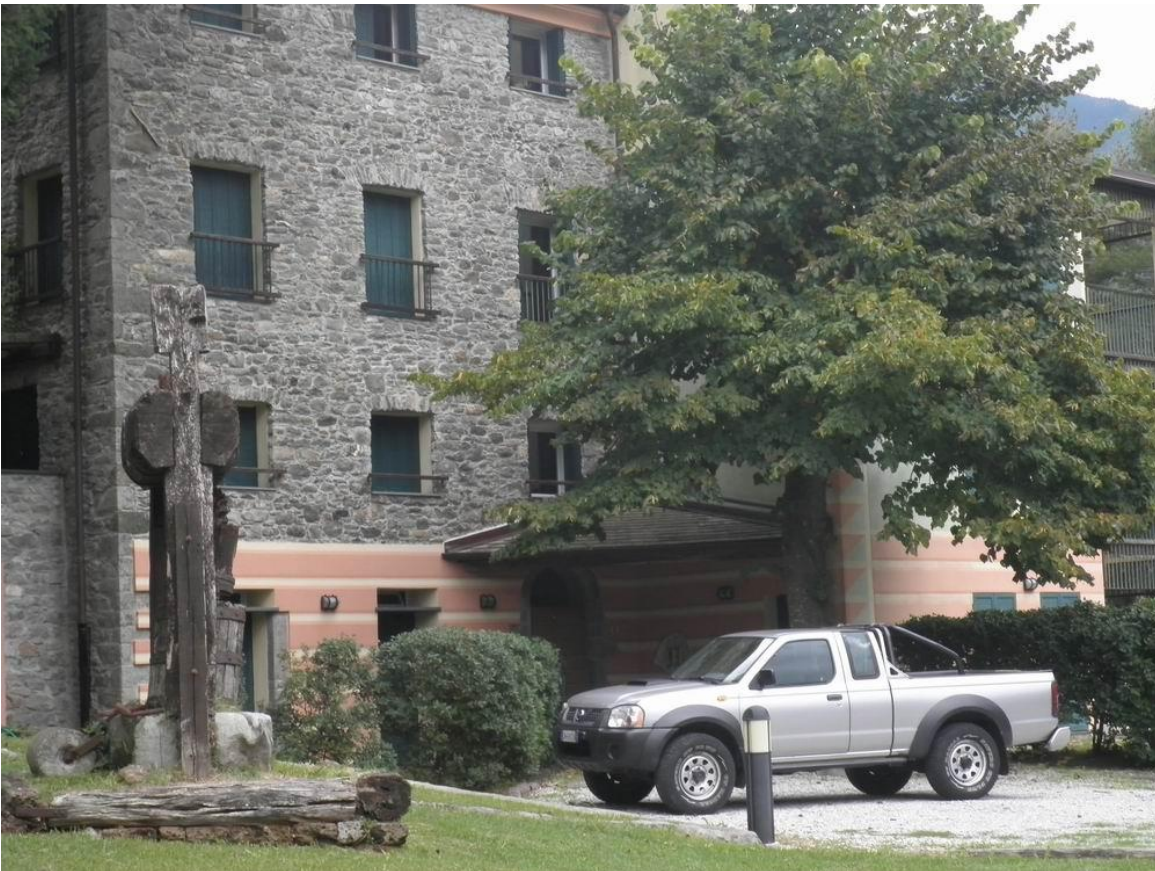
fronte sud - ovest