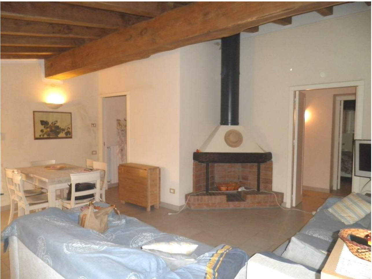
ingresso - soggiorno