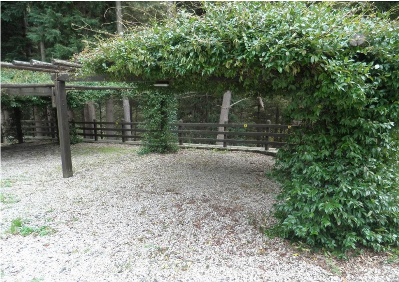
due parcheggi di proprietà