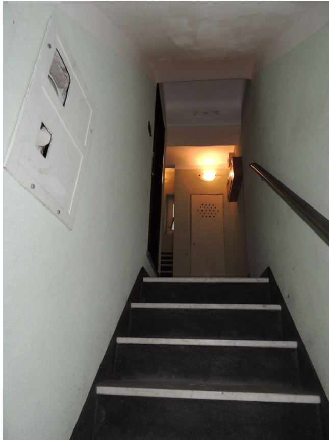
Foto n 5 Rampa di scale interne al caseggiato che dà accesso ai vari appartamenti