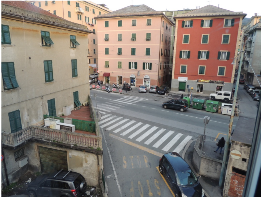
Foto n 3 Vista da slargo di Via Barchetta su Via Costantino Reta