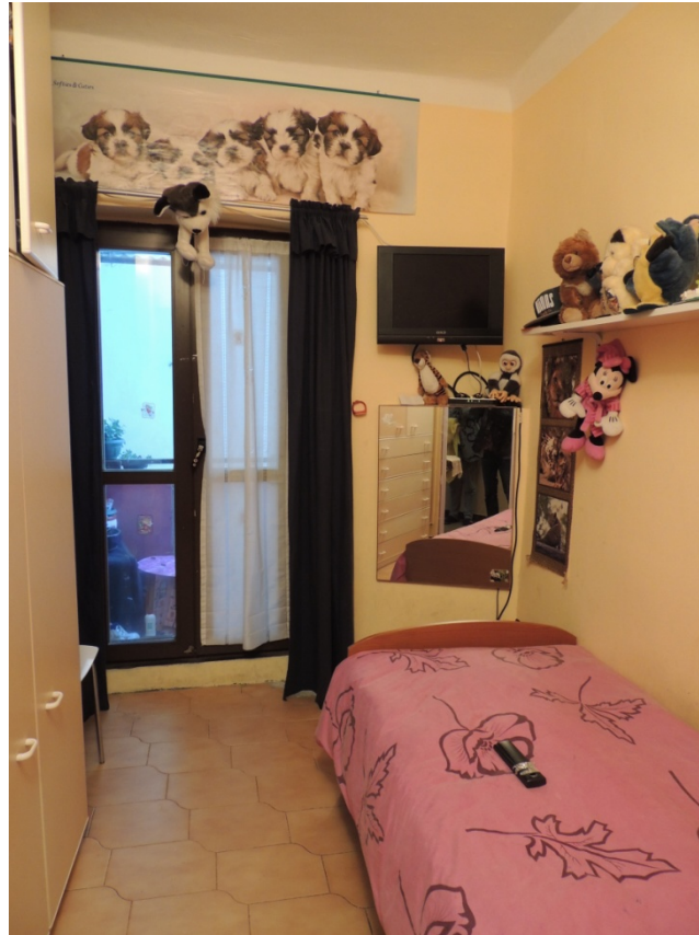
Foto n 11 Cameretta