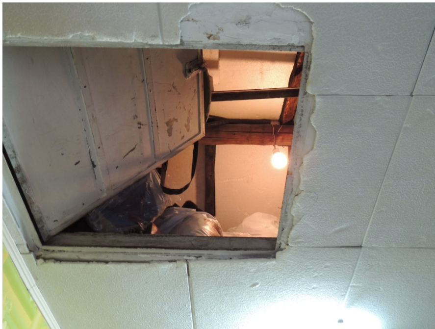
Foto n 13 Botola nel controsoffitto del bagno