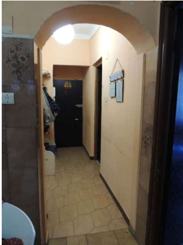
Foto n 7 Ingresso e disimpegno dell'appartamento