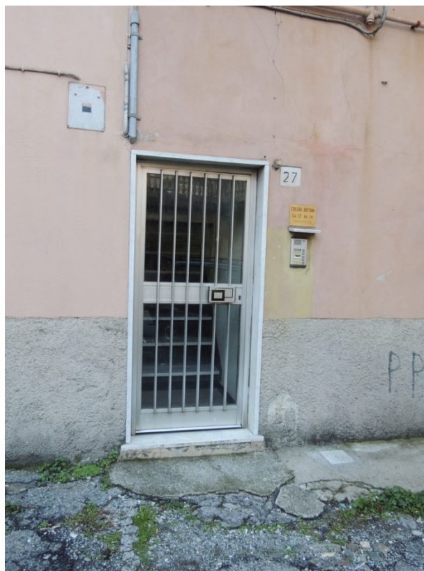
Foto n 4 Portone di ingresso edificio sito in Via Barchetta n.27