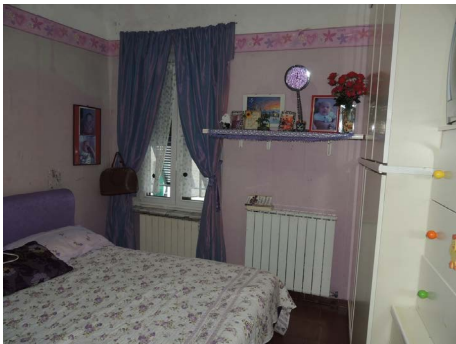
Foto n 10 Camera con accesso dal disimpegno