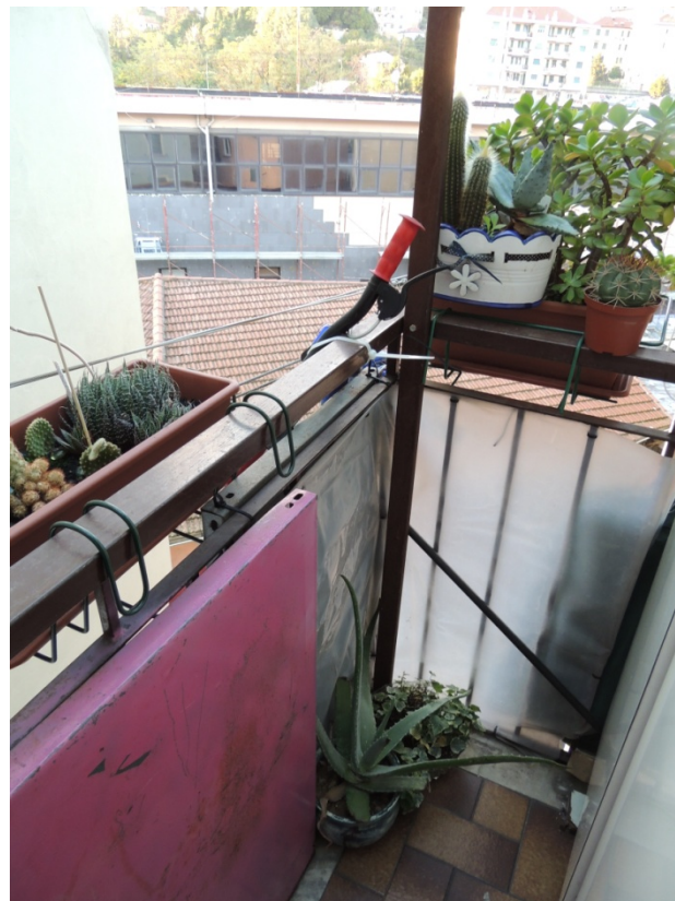
Foto n 11 Poggiolo