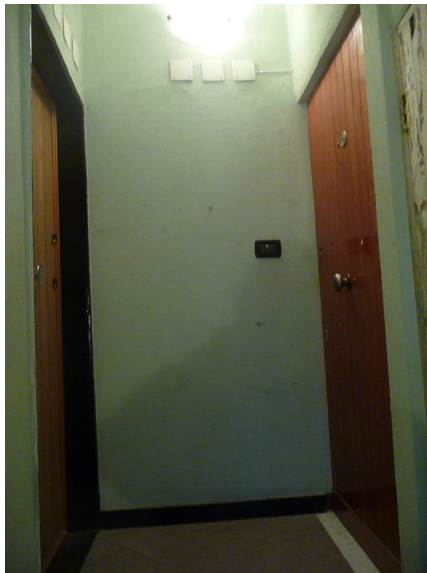
Foto n 6 Ingresso dell'immobile int.5 posto al piano Terzo ed ultimo (Porta destra).