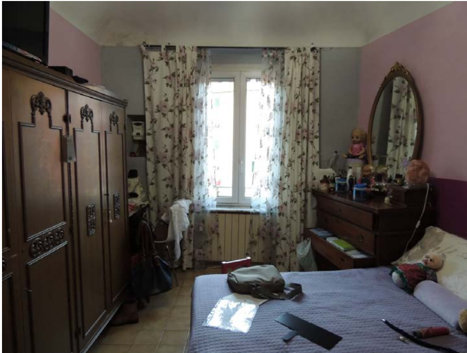
Foto n 9 Camera di fronte alla cucina con infiltrazioni a soffitto