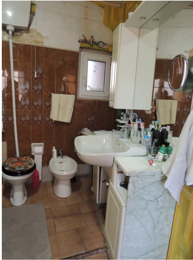
Foto n 12 Bagno con evidenziate varie infiltrazioni