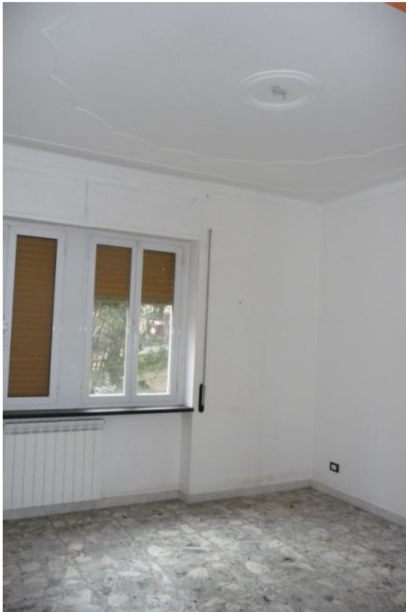
Foto 12. Terza camera affacciata ad est