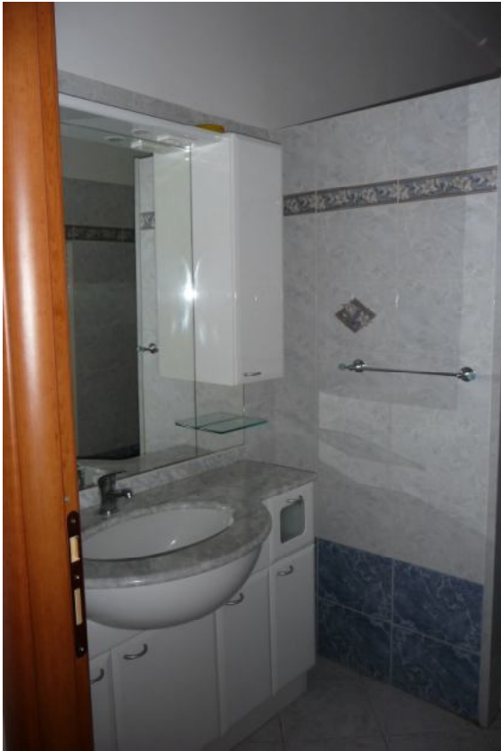
Foto 16. Bagno adiacente vano scala 6 A