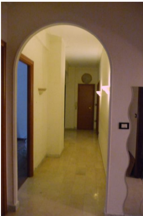
Foto 15. Corridoio verso sud