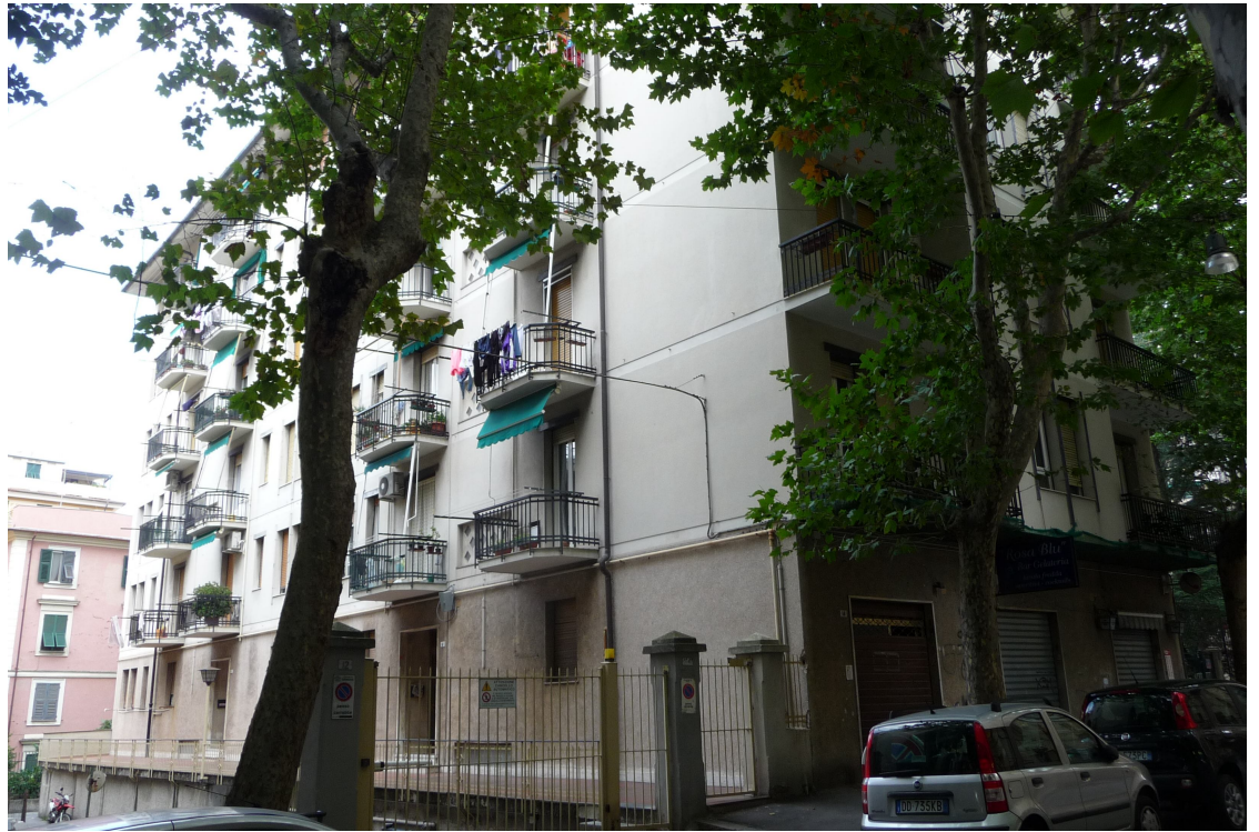
Foto 1. Il condominio civ. 6 A e 6 B dalla Via L. Ariosto.