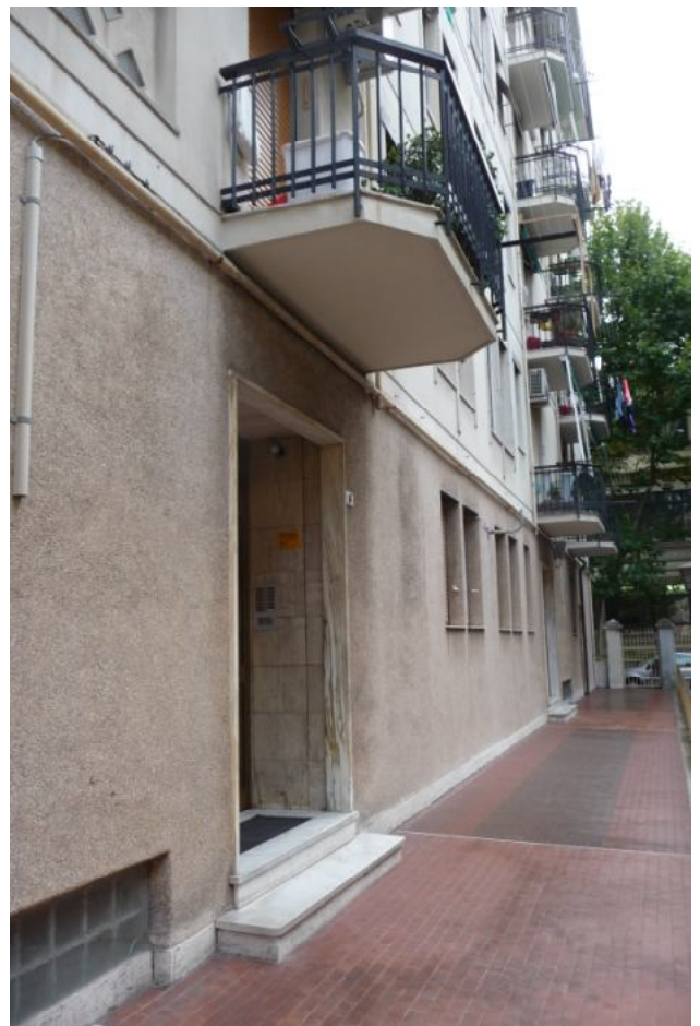
Foto 3. Portone civ. 6 B e passaggio condominiale.