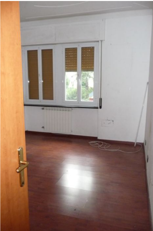
Foto 8. Camera adiacente la cucina