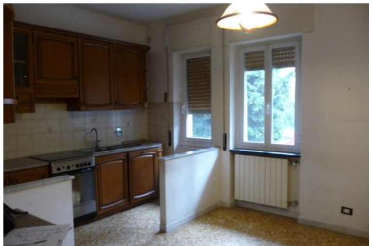
Foto 7. Cucina