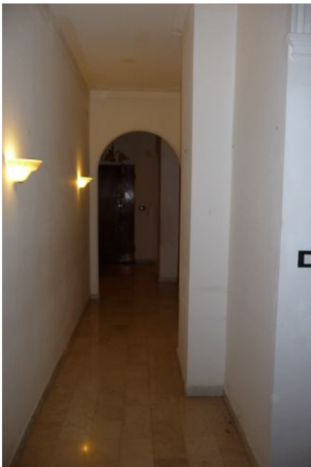
Foto 10. Corridoio verso ingresso 6 B