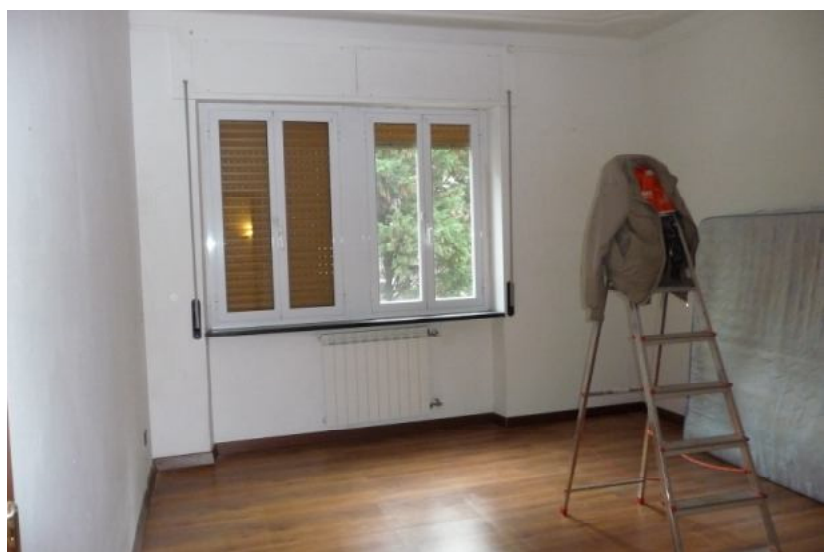
Foto 11. Seconda camera affacciata ad est