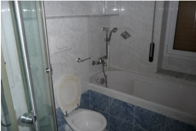
Foto 18. Bagno adiacente vano scala 6 A