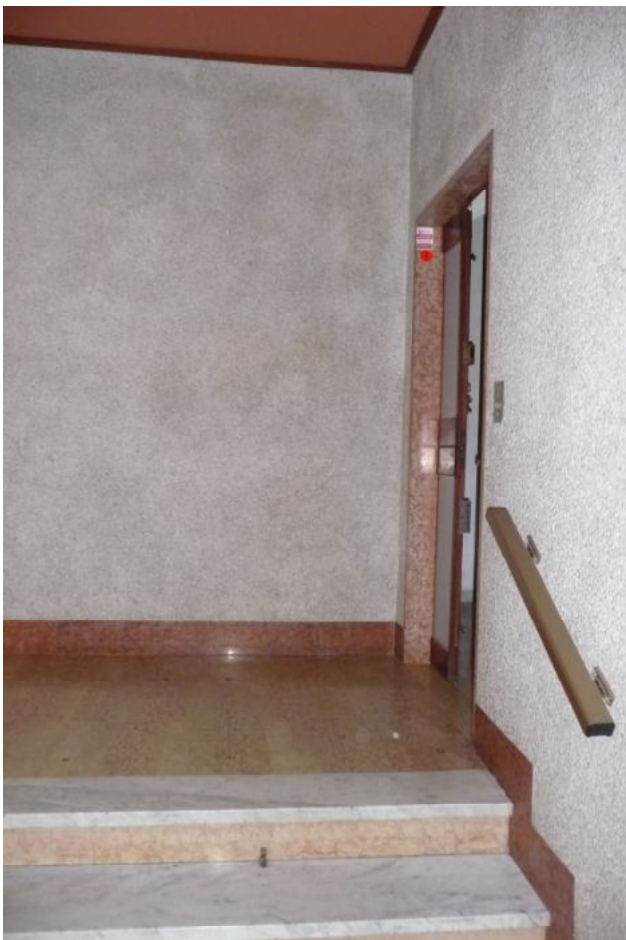
Foto 2. Ingresso civ. 6 B.