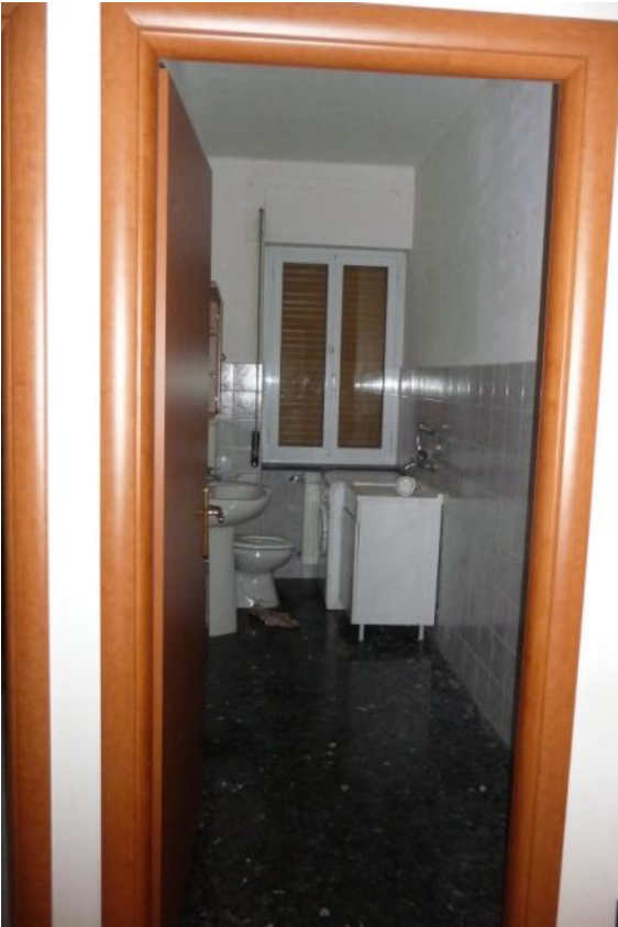
Foto 17. Bagno adiacente sala