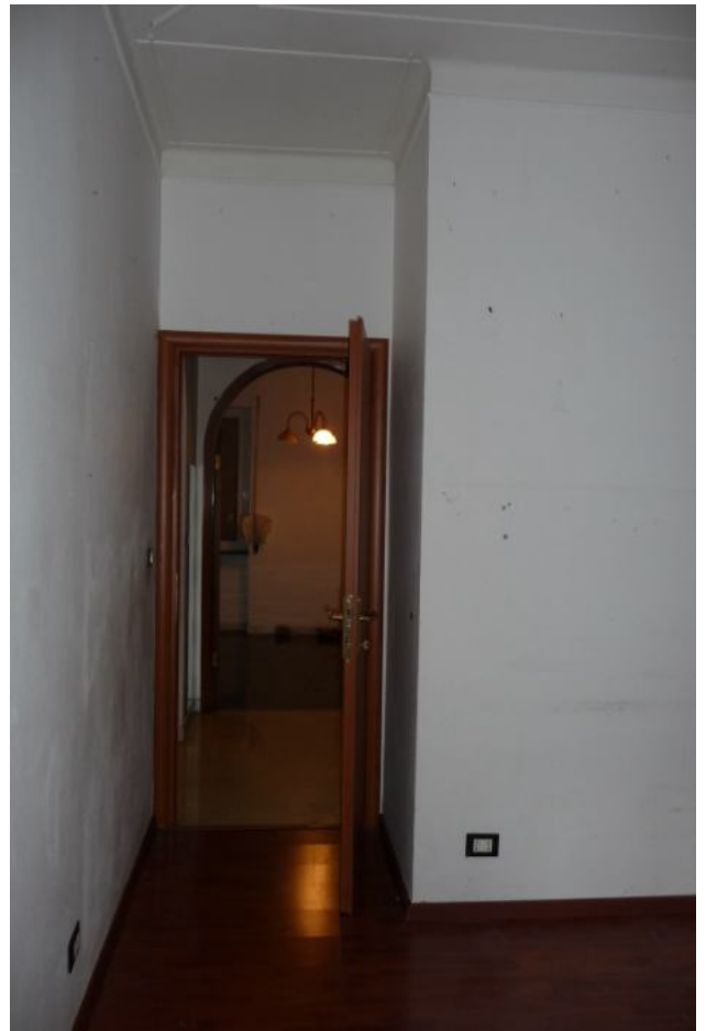
Foto 9. Camera adiacente la cucina