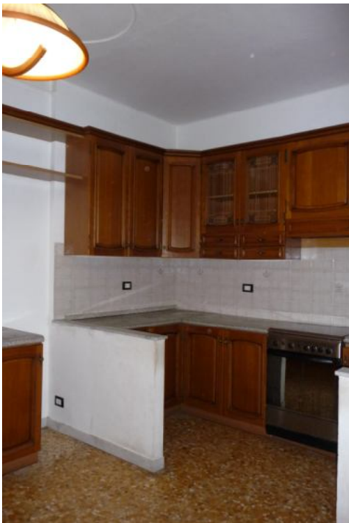
Foto 6. Cucina