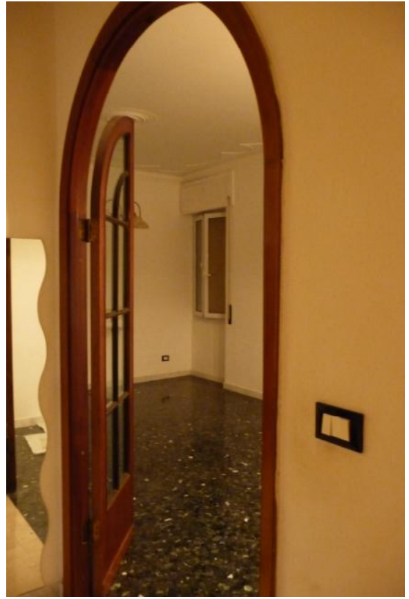
Foto 5. Sala