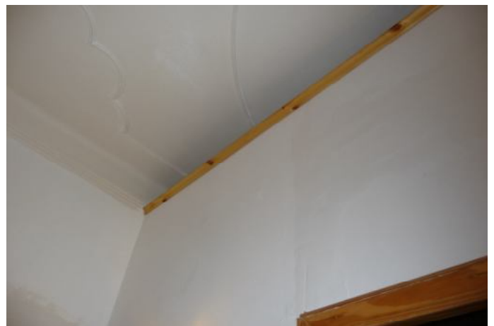
Foto 14. tramezza camera di fronte all'ingresso 6 A