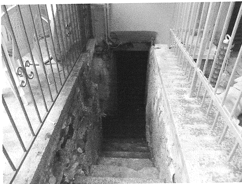
Foto n° 16 – Vista esterna - Piano terra – Accesso alla cantina interrata