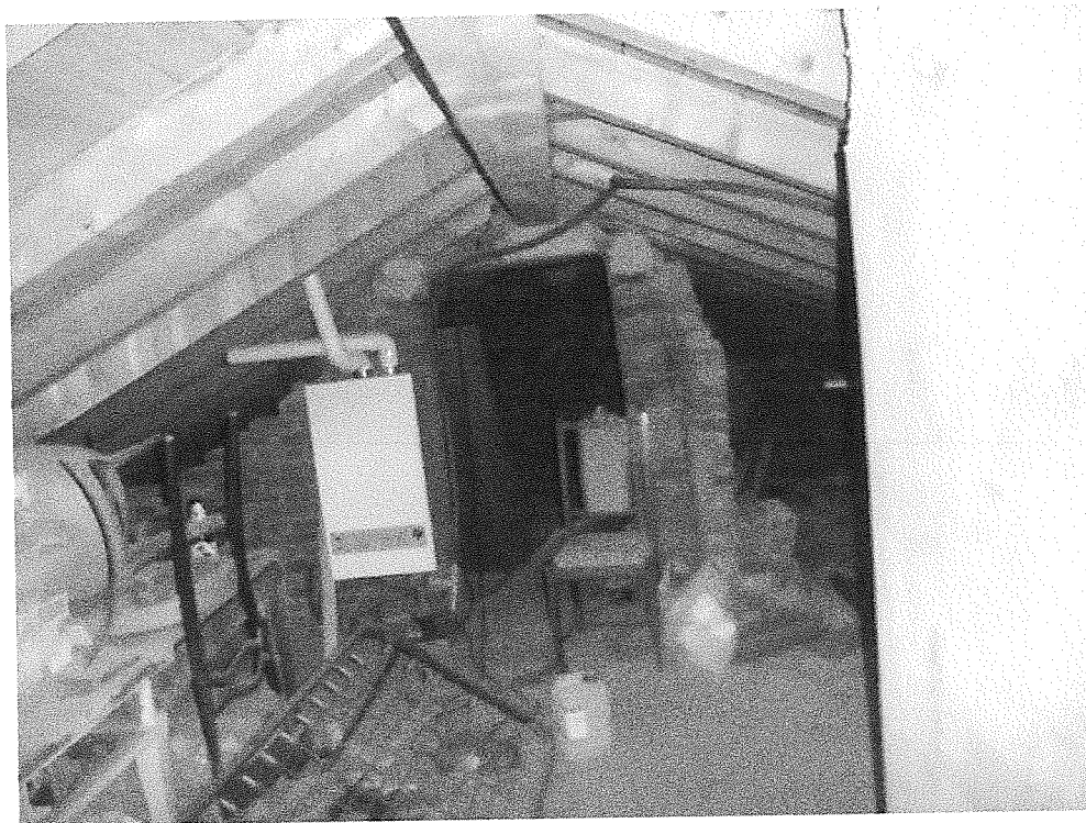
Foto n° 15 – Vista interna sottotetto con posizionam. calderina autonoma

Unità immobiliare individuata al civ. 7217 di Viale Nazario Sauro in Ronco Scrivia (GE)