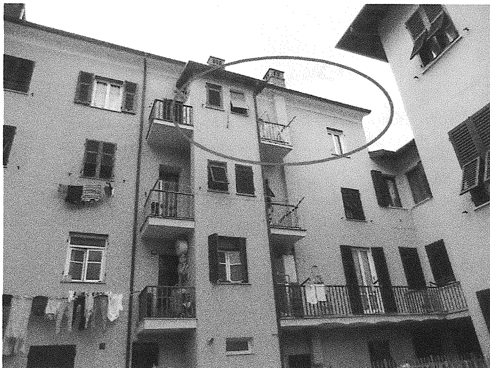
Foto n° 2 – Vista esterna complesso immobiliare dall'area di pertinenza condom.