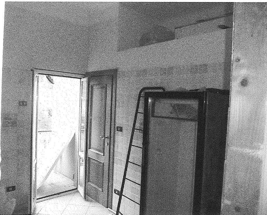
Foto n° 9 – Vista interna – Cucina con accesso al poggiolo e al bagno

Unità immobiliare individuata al civ. 7217 di Viale Nazario Sauro in Ronco Scrivia (GE)