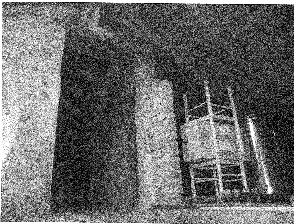
Foto n° 13 – Vista interna accesso alla porzione di sottotetto di proprietà

Unità immobiliare individuata al civ. 72/7 di Viale Nazario Sauro in Ronco Scrivia (GE)