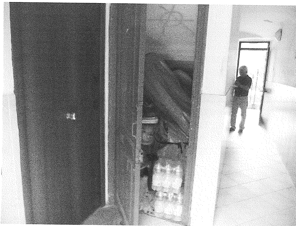
Foto n° 18 – Vista interna - Piano Terra – Ripostiglio sottoscala in utilizzo