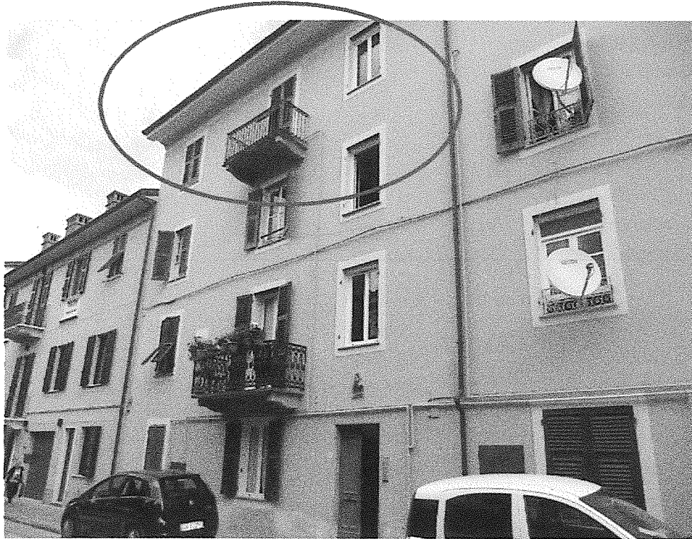
Foto n° 1 – Vista esterna verso V.le Nazario Sauro del complesso immobiliare

Unità immobiliare individuata al civ. 7217 di Viale Nazario Sauro in Ronco Scrivia (GE)