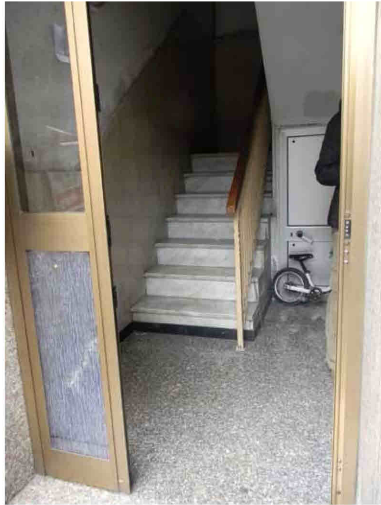
3) Portone di ingresso