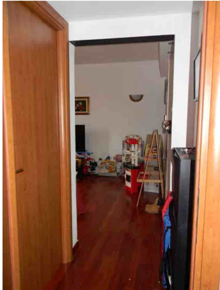
14)Disimpegno zona notte