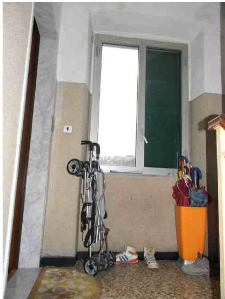
5) Particolare Vano scala