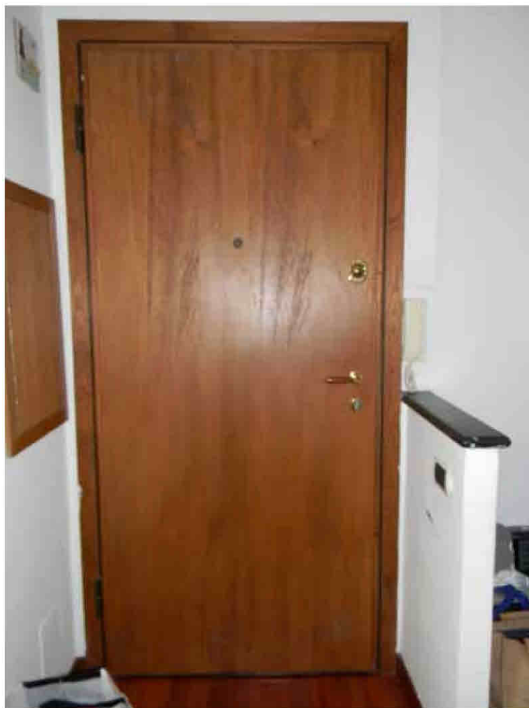
7) Portoncino di ingresso