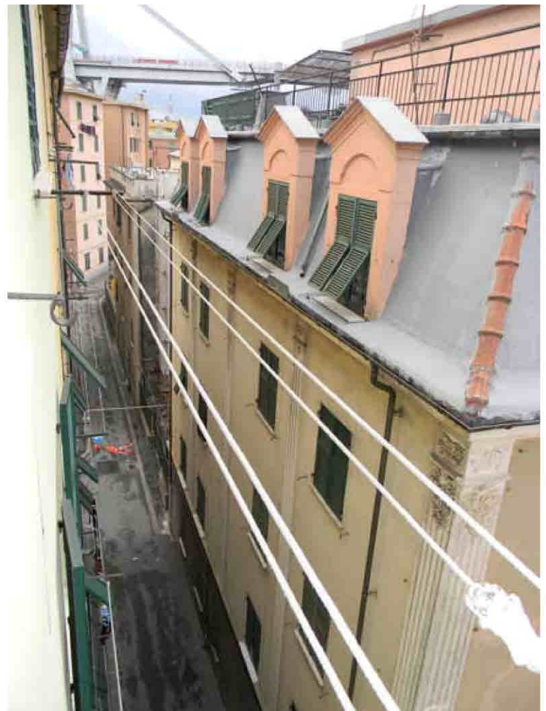
18) Vista su Via P. Borsieri