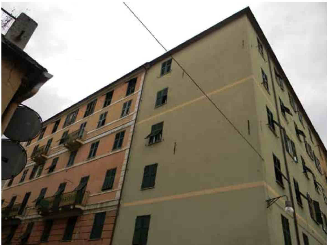
1) Prospetto su Via Pietro Borsieri