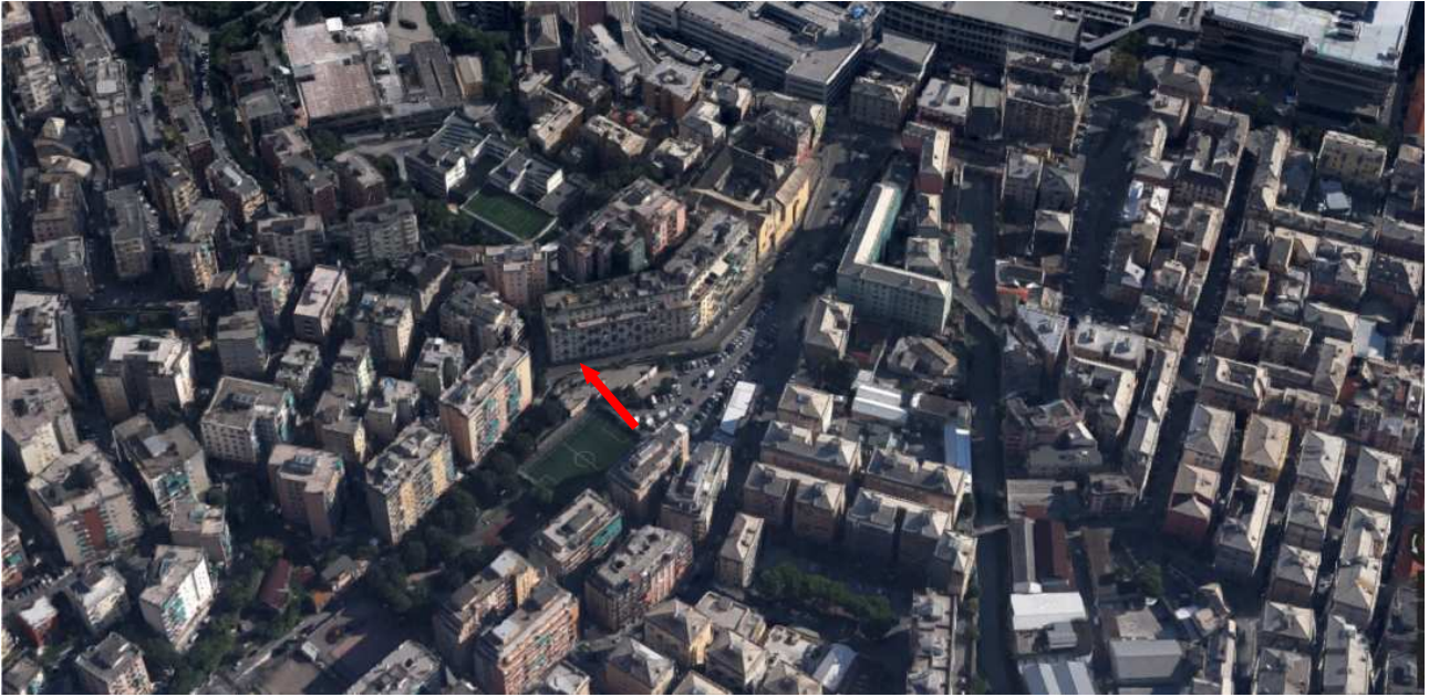
Vista aerea dell'edificio nel contesto urbano.