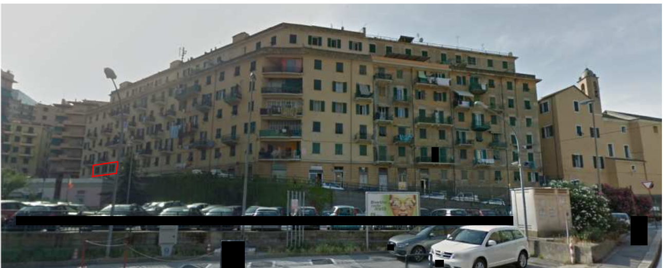
Vista dell'edificio da via Borzoli con individuazione dell'appartamento periziando (via Sparta è la strada in salita adiacente al palazzo).