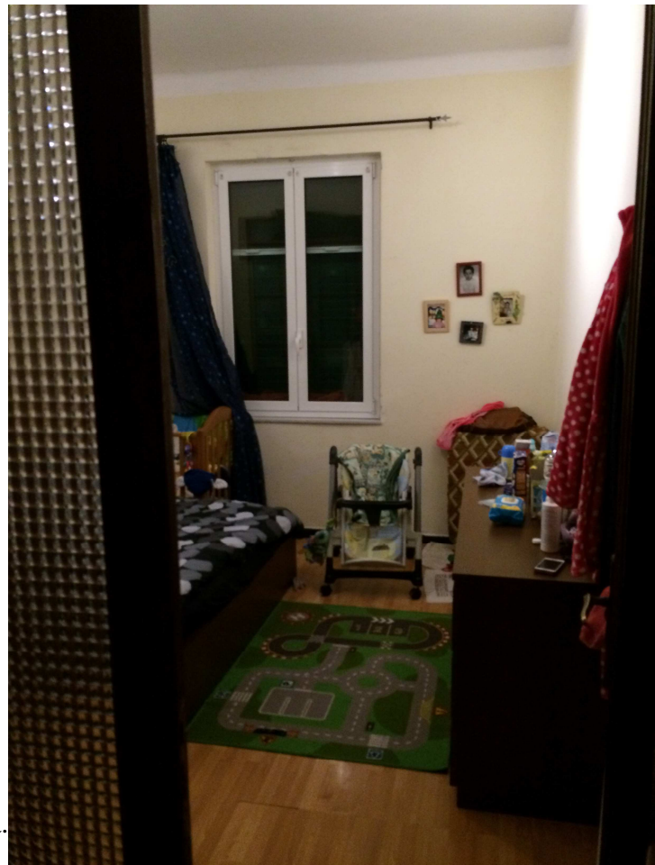
Vista della camera da letto adiacente alla cucina.