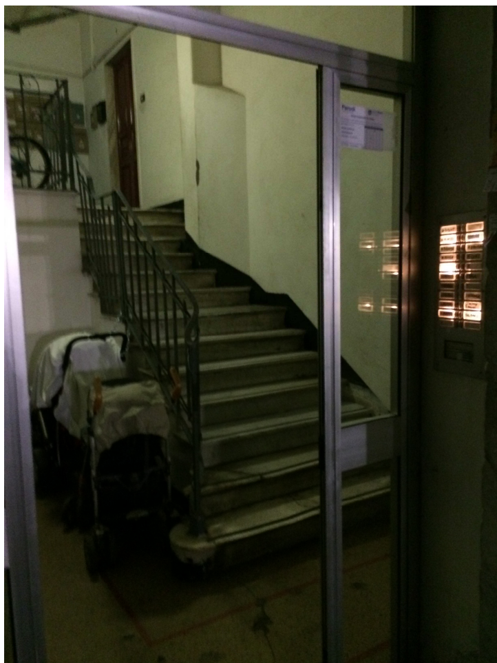
Vista del portone condominiale su via Sparta e della porta di ingresso dell'appartamento (in cima alla rampa di scale)