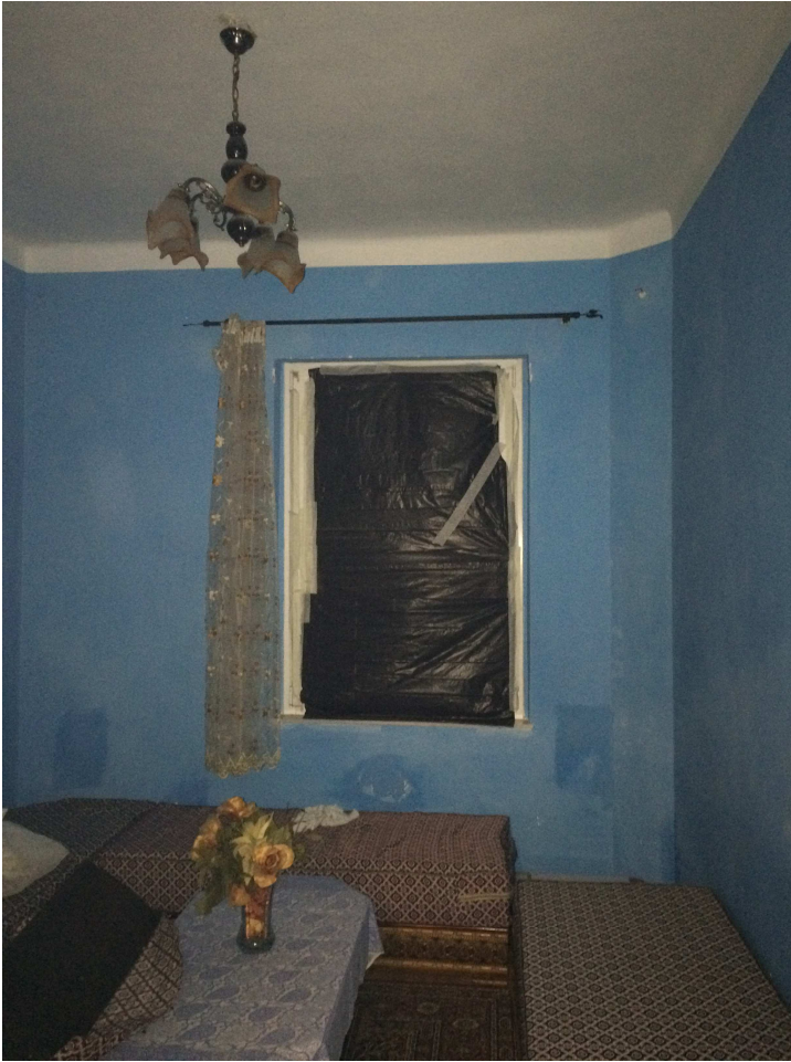
Vista della camera adiacente all'ingresso.