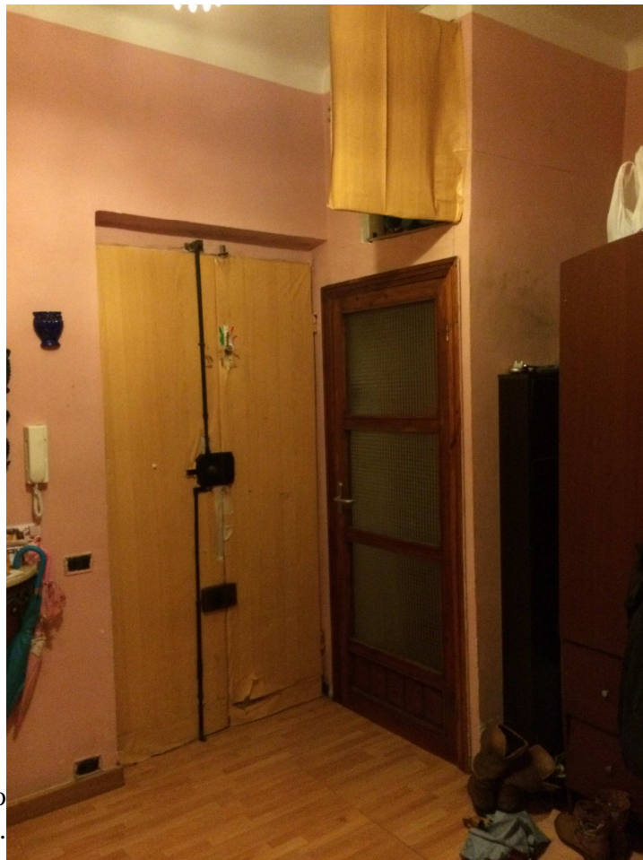
Vista dell'ingresso con il piccolo ripostiglio.