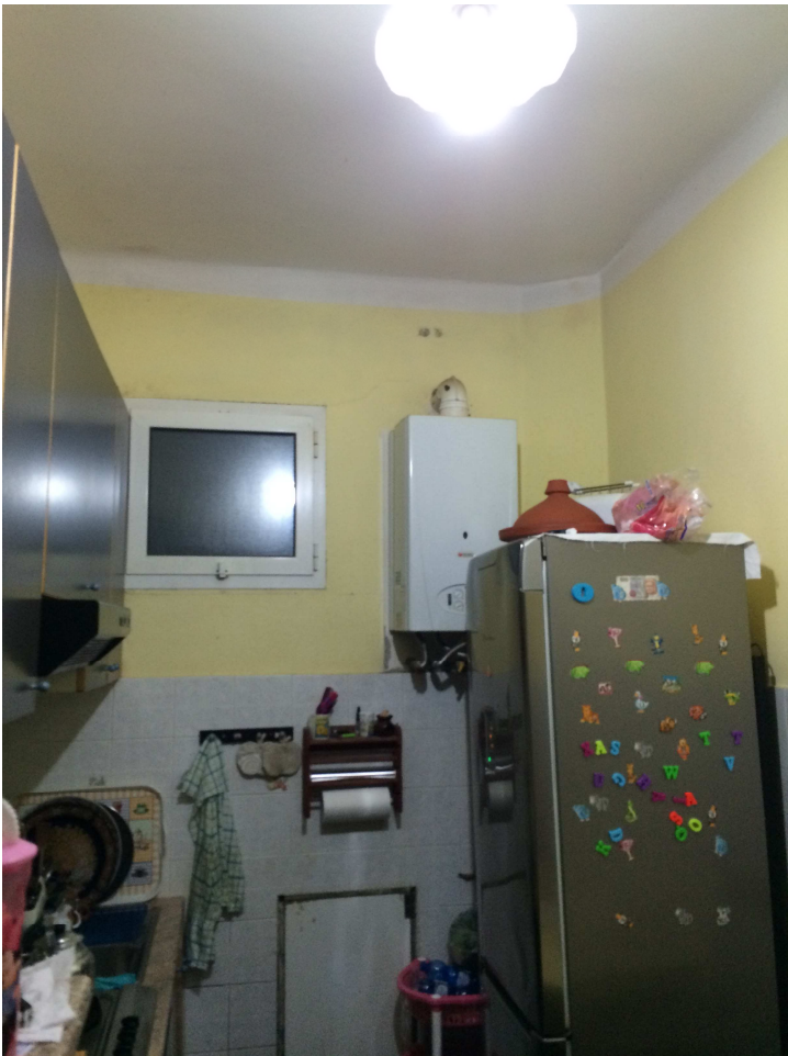
Vista della cucina (la finestrella alta si affaccia sull'intercapedine).