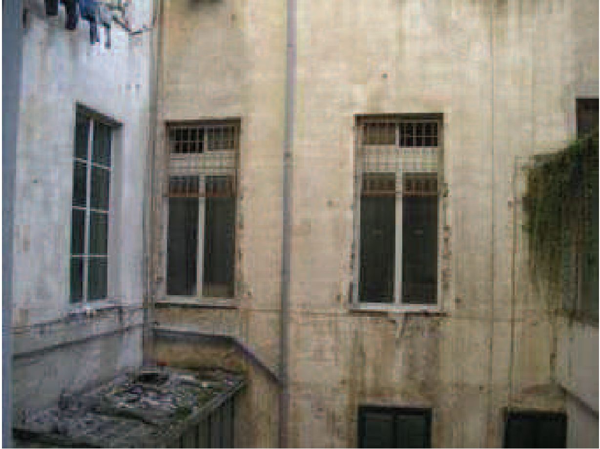
CHIOSTRINA - Prospetto SUD