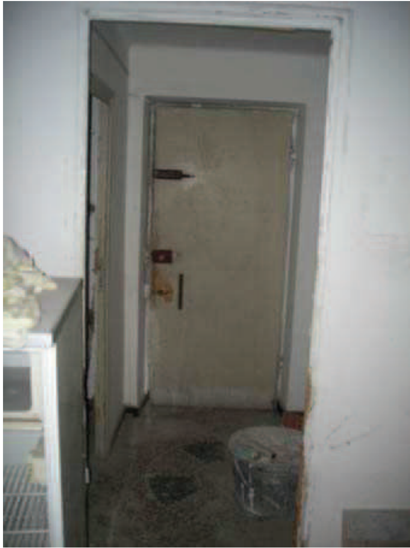
8 - Scala C int. 6