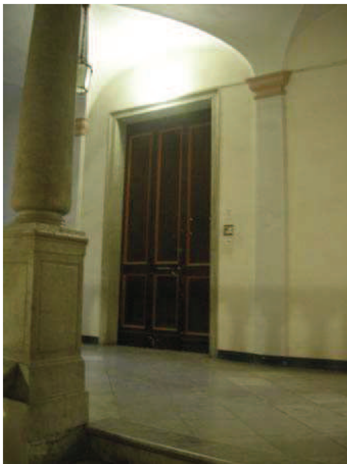
SCALA A - Int. 7 - Porta caposcala