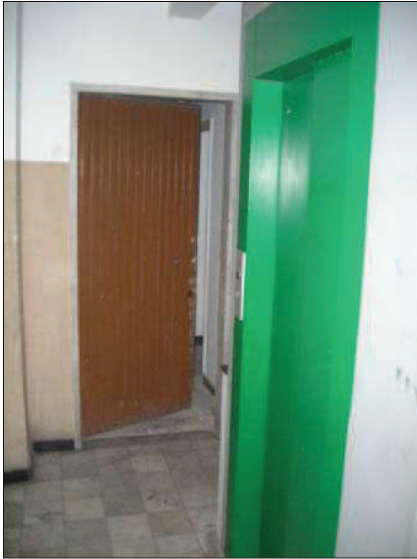
SCALA C - Int. 6 - Porta caposcala