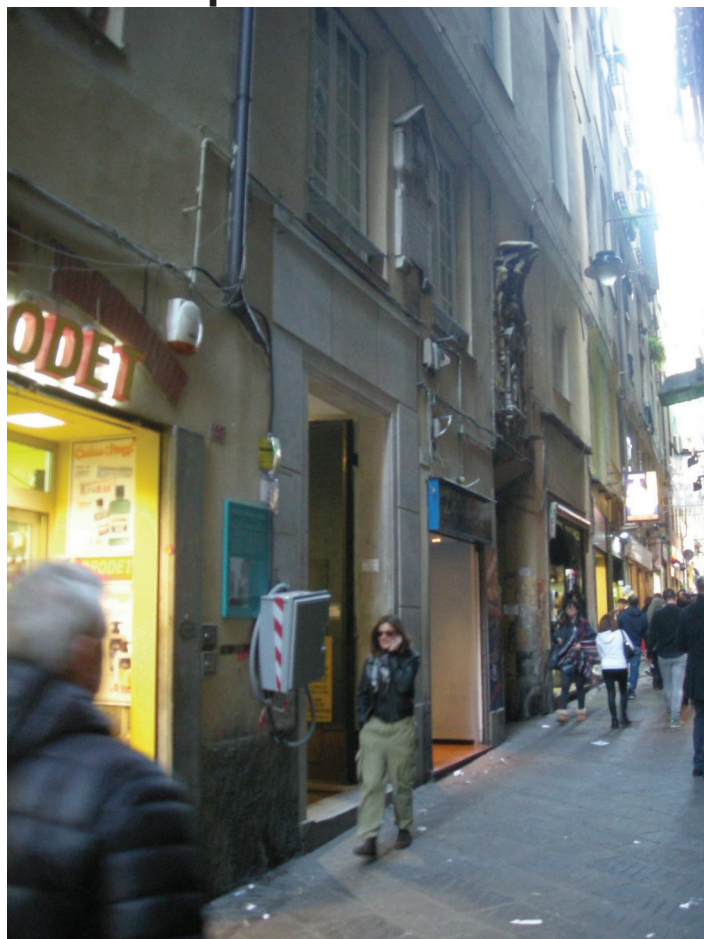
Portone civ.4 di via S.Luca