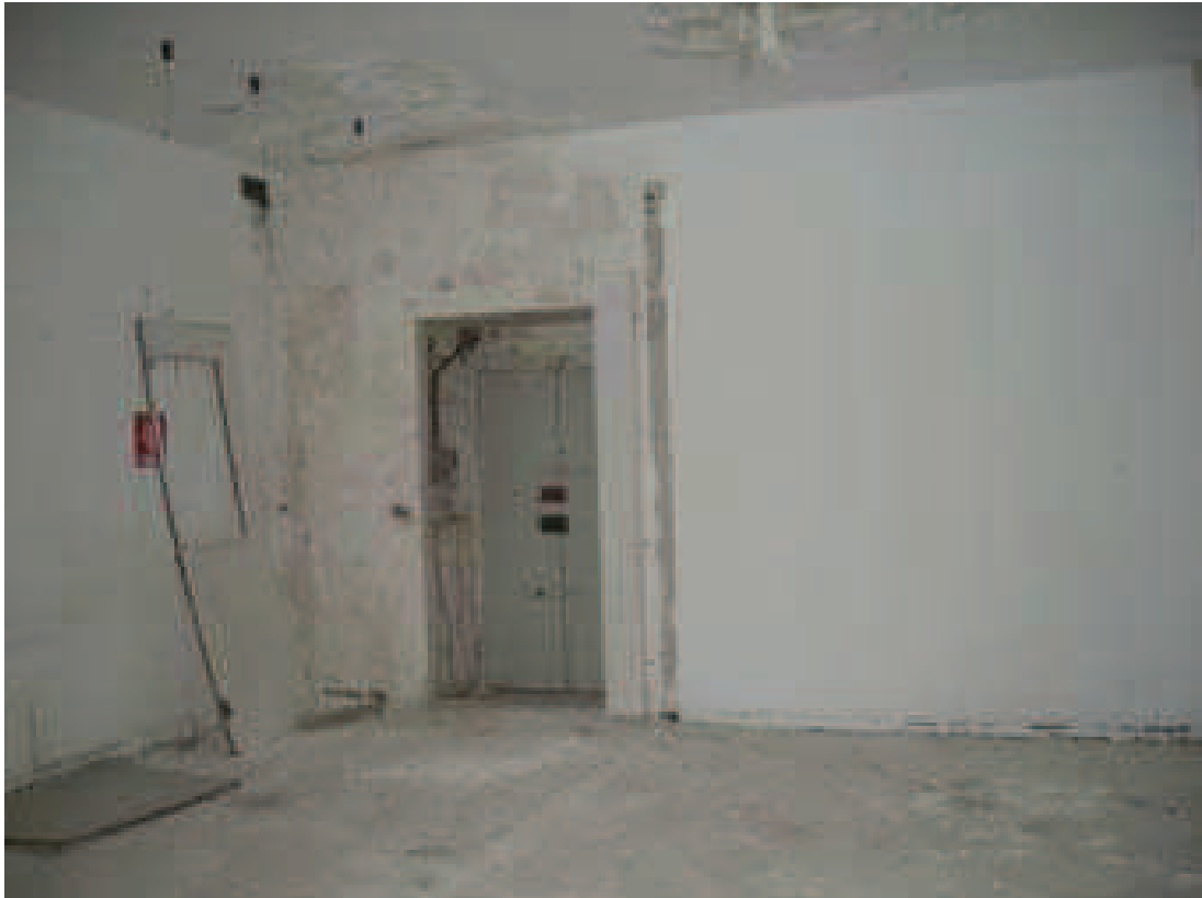
24 - Scala B int. 8