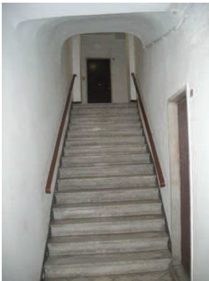
SCALA B - DALL'ATRIO