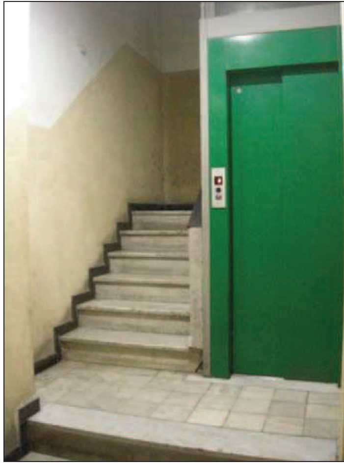
SCALA C inizio