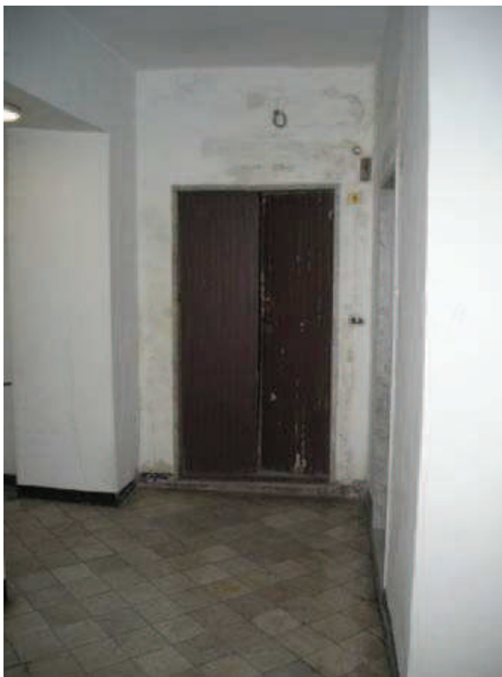
SCALA B - Int. 8 - Porta caposcala