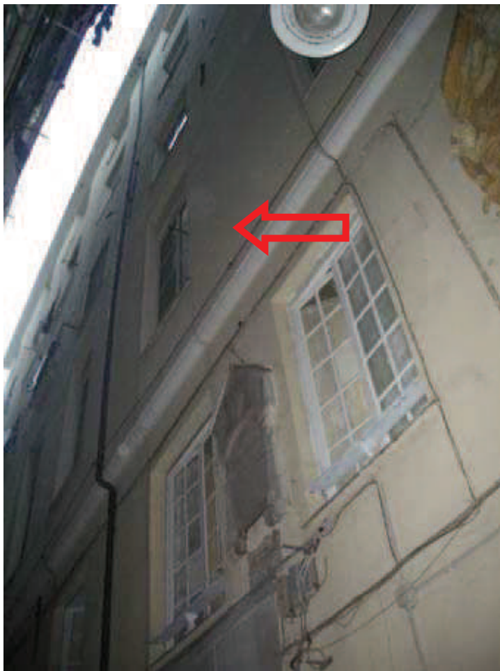
Prospetto su via S.Luca