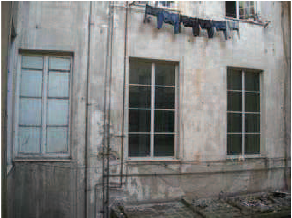
CHIOSTRINA - Prospetto EST