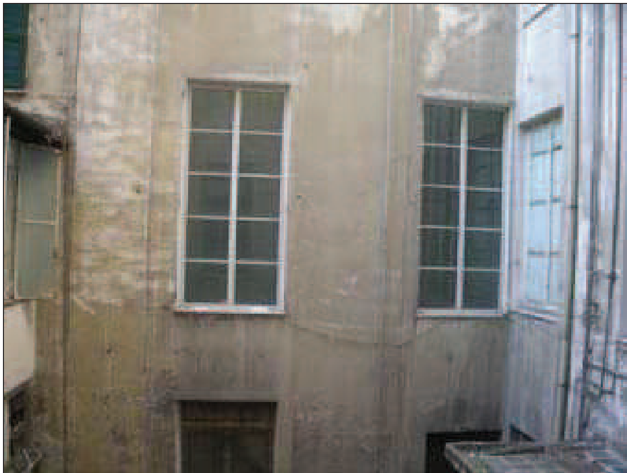
CHIOSTRINA - Prospetto NORD