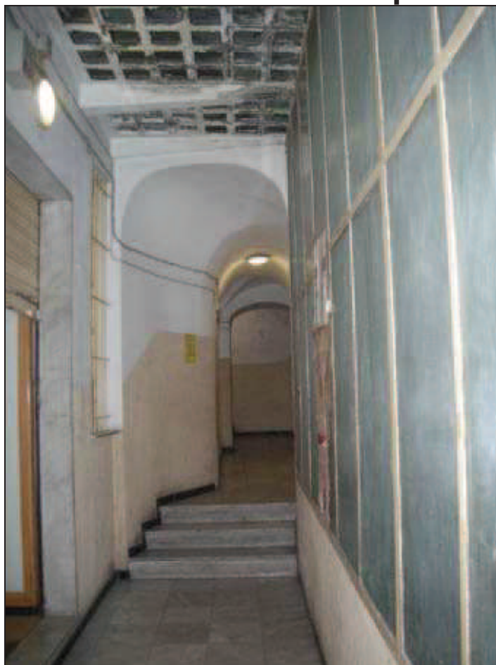
corridoio verso la SCALA C