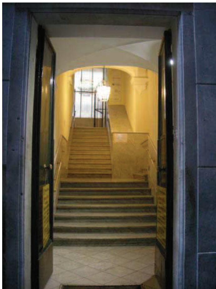
Portone e primo atrio