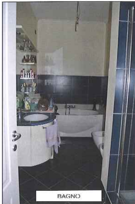
FOTOGRAFIA n. 13