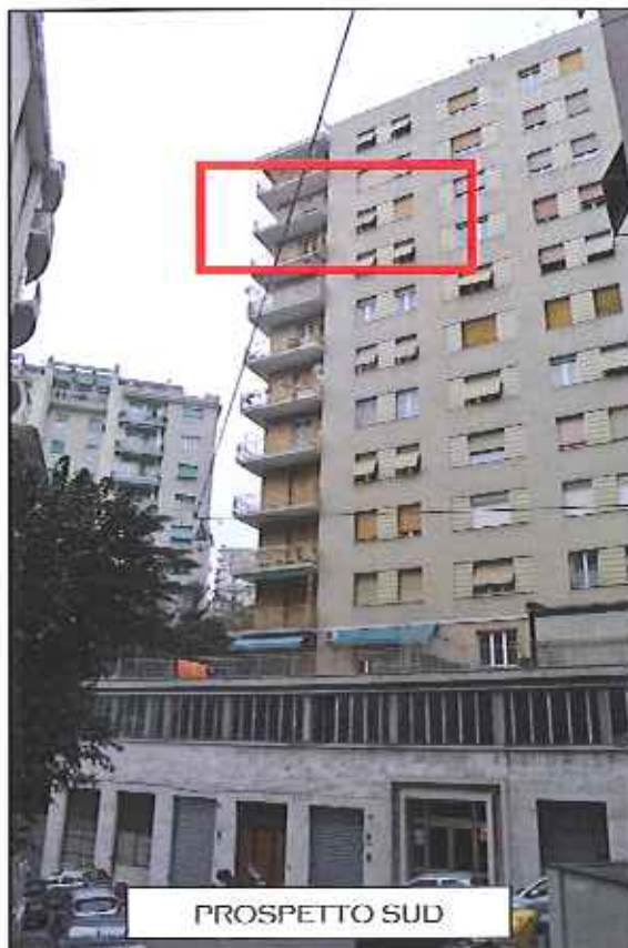
FOTOGRAFIA n. 2