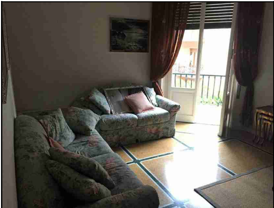
Foto 5 - Lotto 1° Appartamento Via del Carmelo 7/3 – Il soggiorno