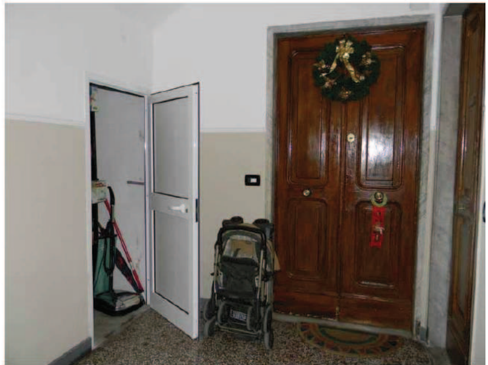
21) Camera n.2