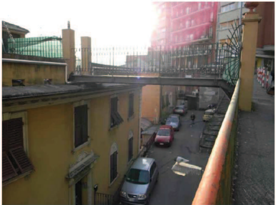
2) Passerella di accesso da via L. Montaldo