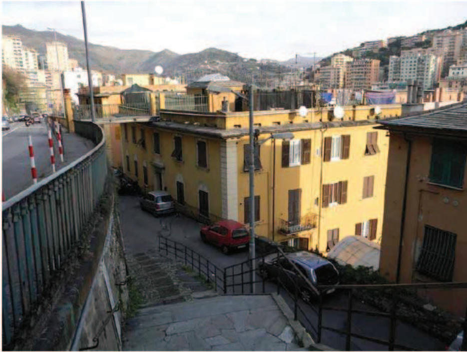
1) Prospetto Principale su Salita G. Meloni e prospetto Sud