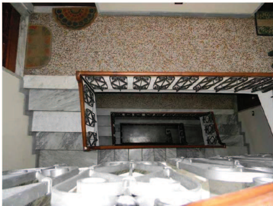
8) Particolare vano scala