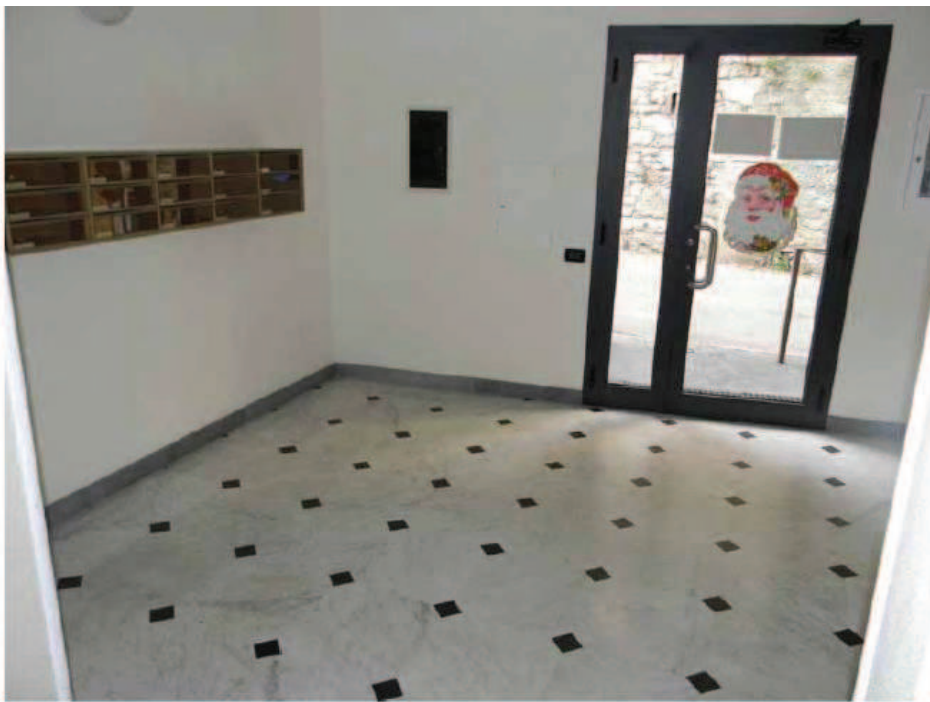
7) Atrio da Salita G. Meloni