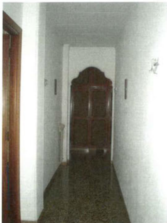
corridoio vista ingresso