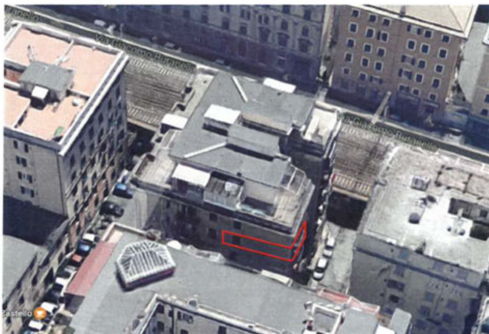
affaccio interno 20 lato nord e ovest