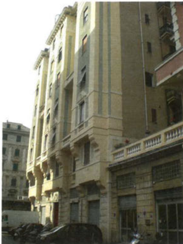
prospetto principale dell'immobile – Via A. Castelli 2