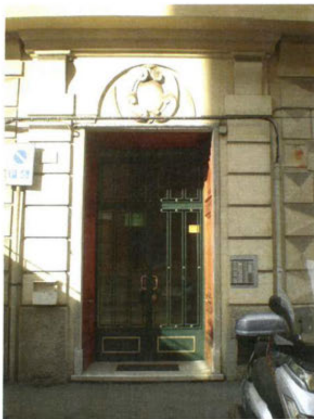
Portone civico n. 2 di Via Agostino Castelli