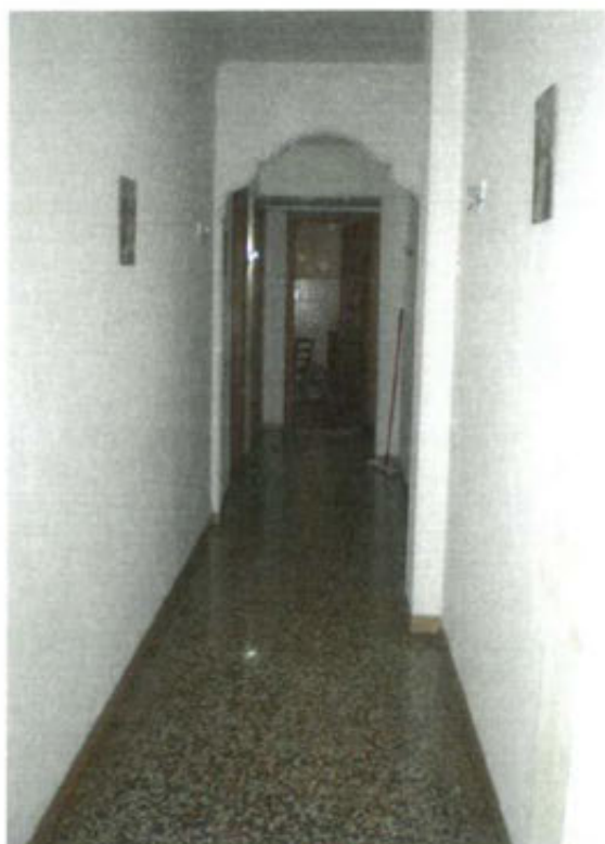
corridoio vista cucina