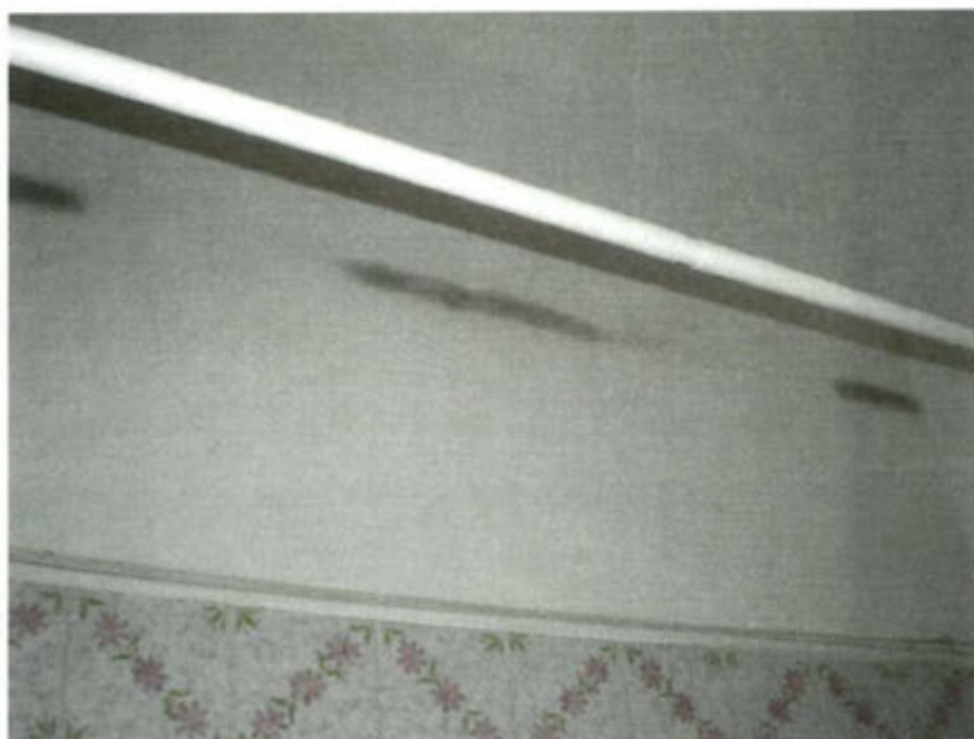
Macchie di umidità da condensa nel bagno