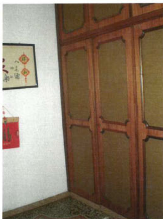
armadio a muro ingresso