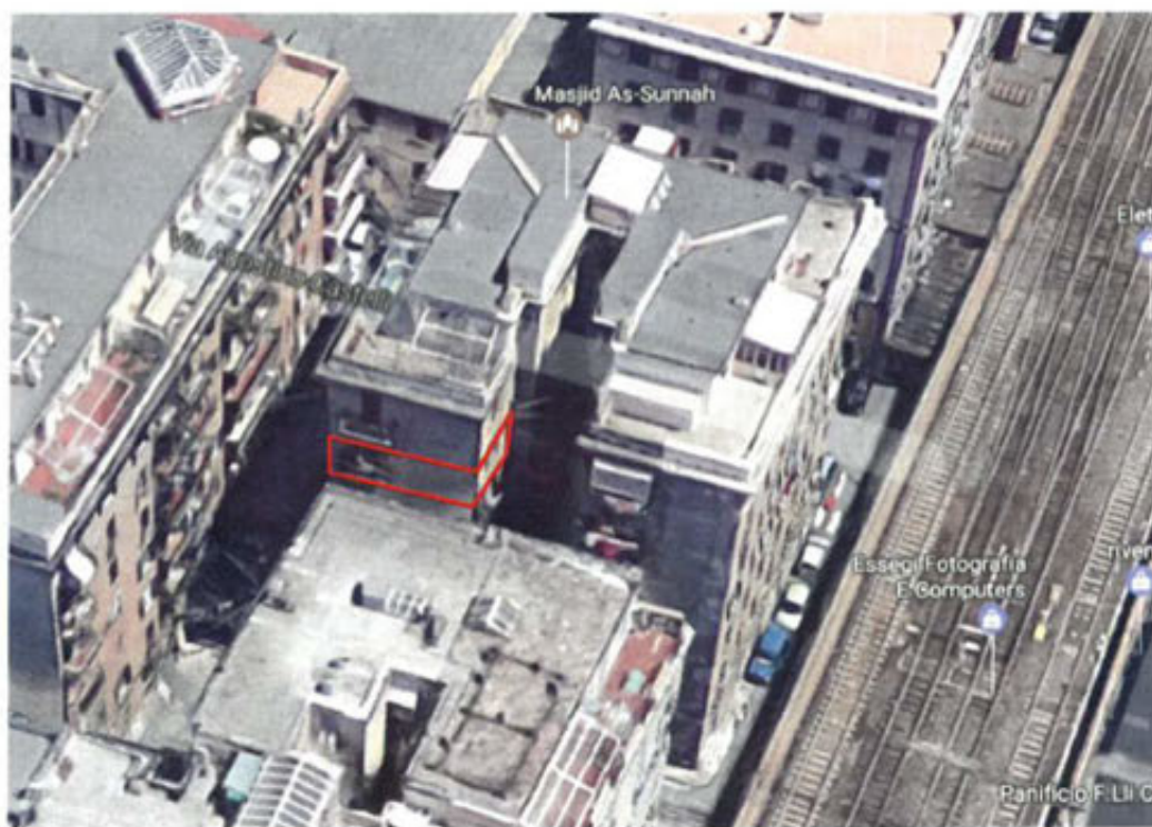
affaccio interno 20 lato ovest e sud