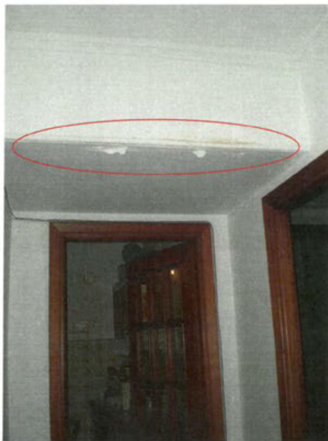
soppalco corridoio lato cucina