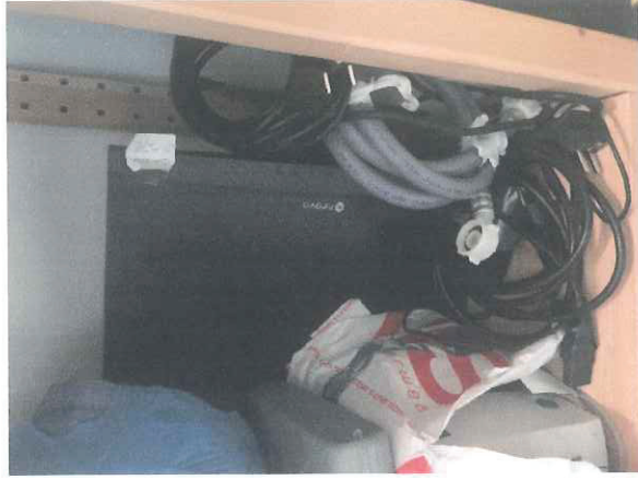
Stampante ad aghi - Monitor