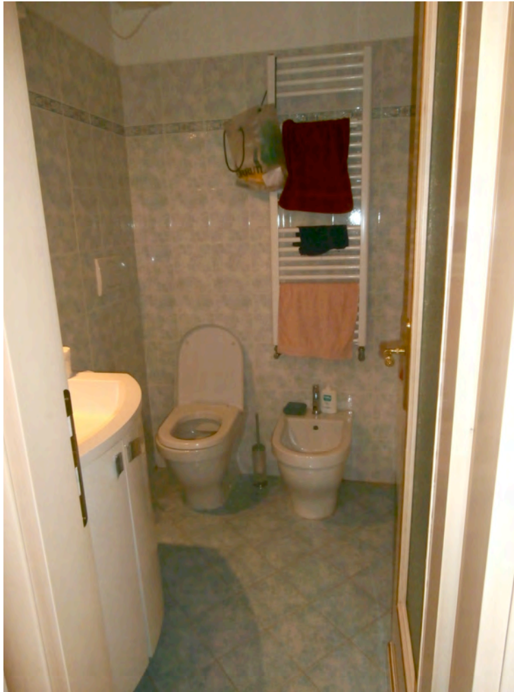
FOTOGRAFIA N° 9 COMMENTI: Vista del locale bagno.