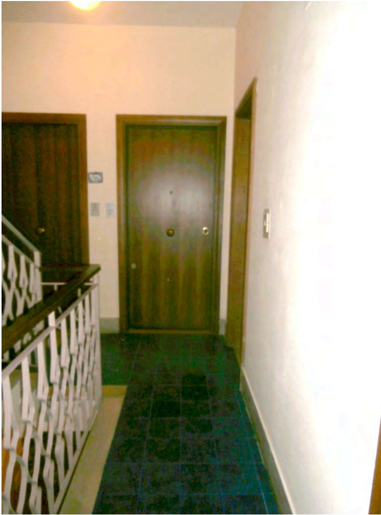
FOTOGRAFIA N° 5 COMMENTI: Vista della porta di ingresso all'alloggio interno 19.