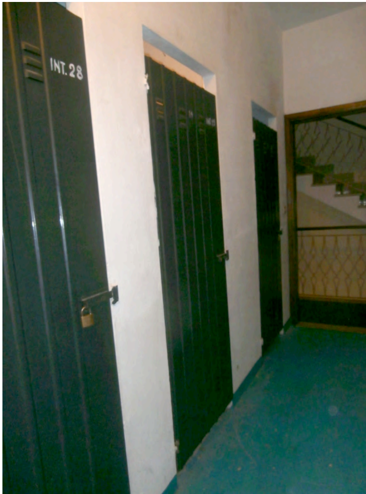
FOTOGRAFIA N° 15 COMMENTI: Vista esterna della cantina.