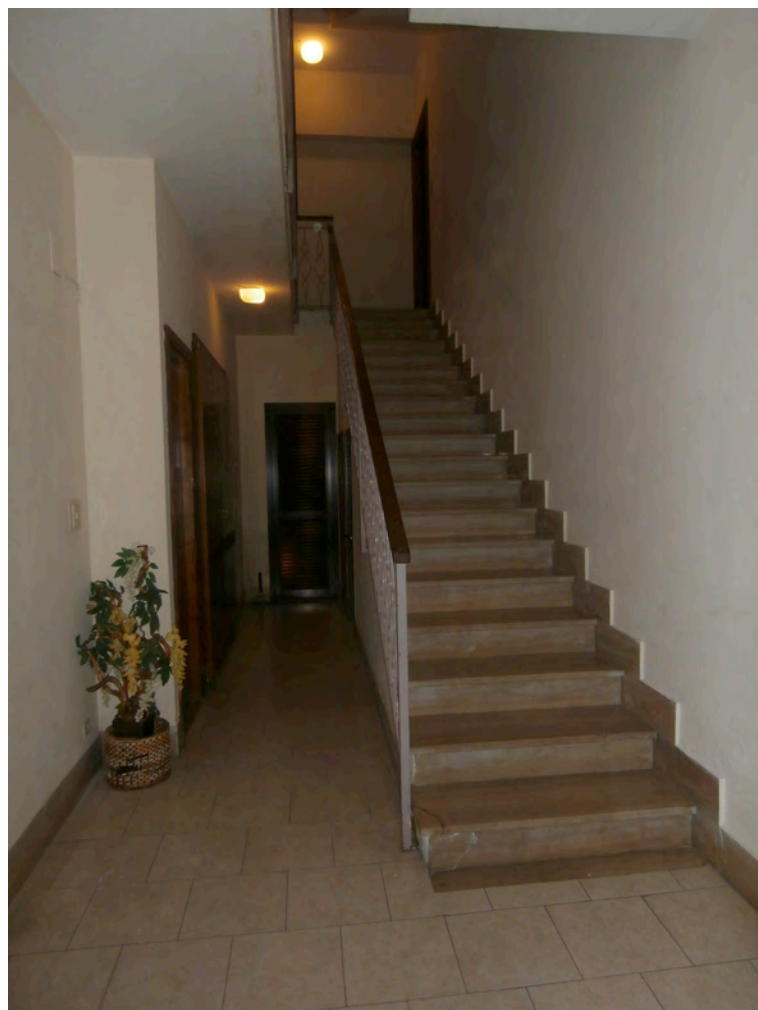
FOTOGRAFIA N° 4 COMMENTI: Vista del vano scale condominiale.