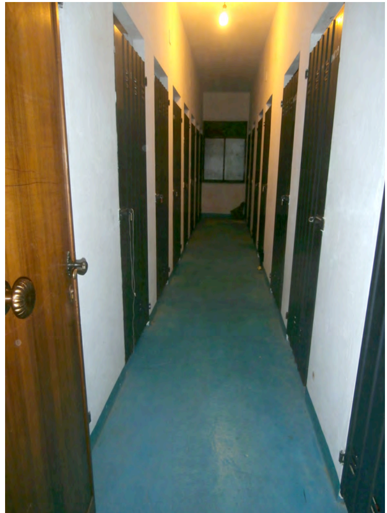
FOTOGRAFIA N° 14 COMMENTI: Vista del corridoio al piano primo che disimpegna alle cantine pertinentenziali.