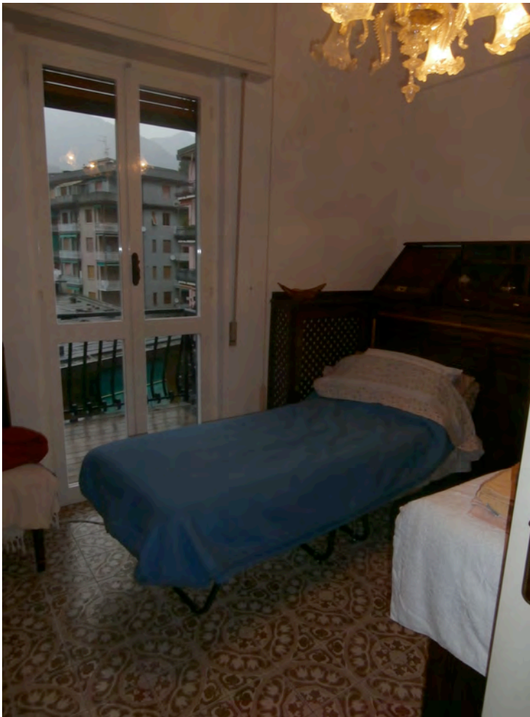
FOTOGRAFIA N° 11 COMMENTI: Vista della camera.