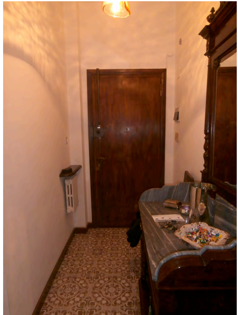
FOTOGRAFIA N° 6 COMMENTI: Vista interna della zona ingresso nell'alloggio interno 19