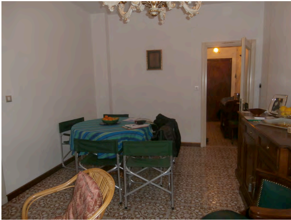
FOTOGRAFIA N° 7 COMMENTI: Vista del locale soggiorno