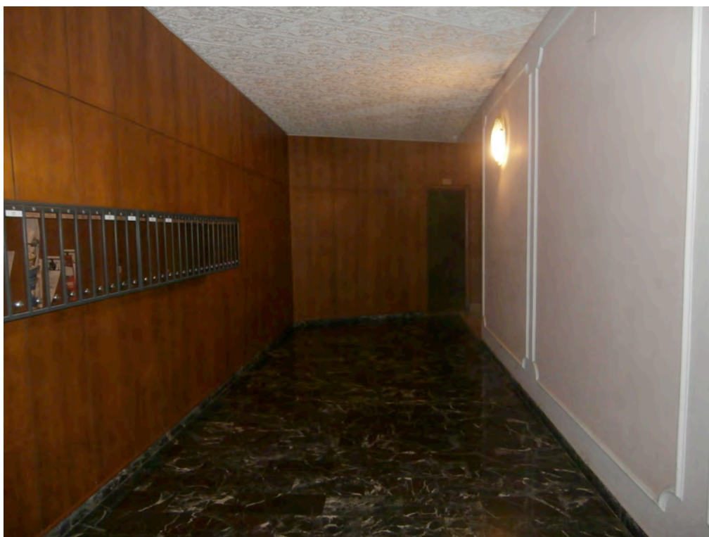
FOTOGRAFIA N° 3 COMMENTI: Altra ripresa dell'atrio di ingresso condominiale