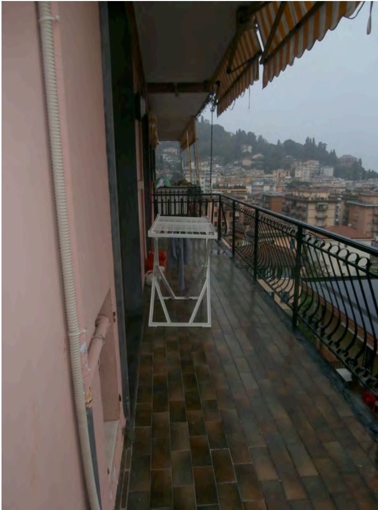
FOTOGRAFIA N° 13 COMMENTI: Vista del balcone.