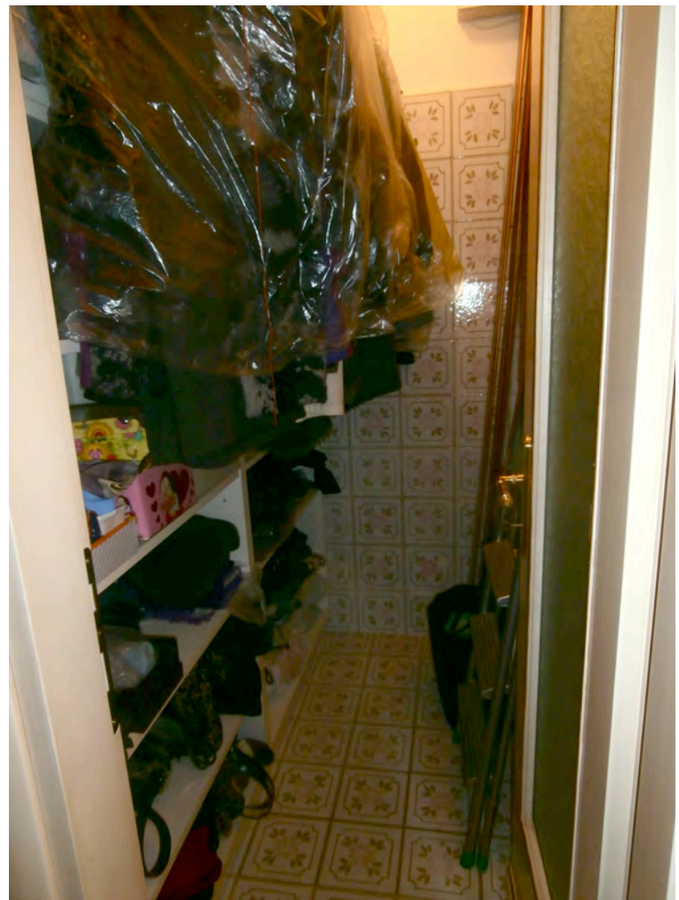
FOTOGRAFIA N° 10 COMMENTI: Vista del secondo bagno utilizzato come ripostiglio