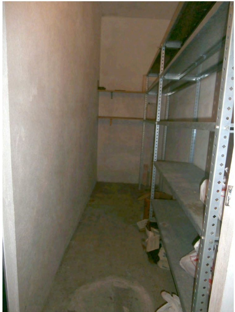
FOTOGRAFIA N° 16 COMMENTI: Vista interna della cantina.