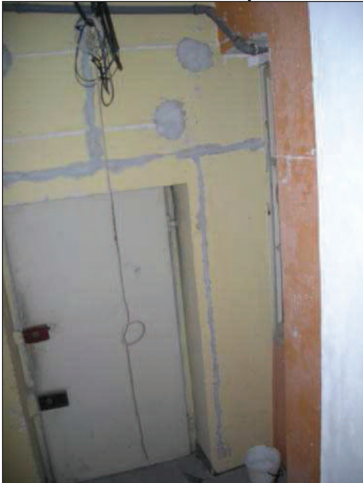
Bb.1 - int. 7- Ingresso