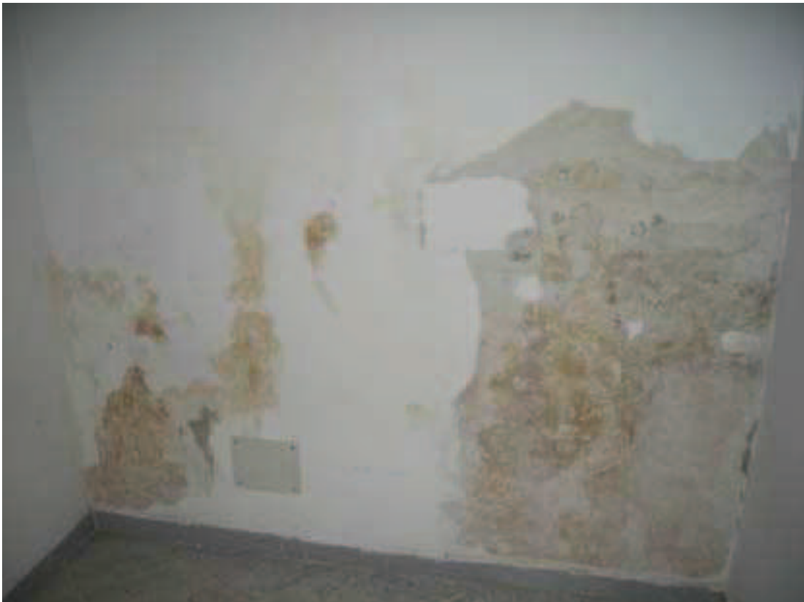
B13 - Disimpegno