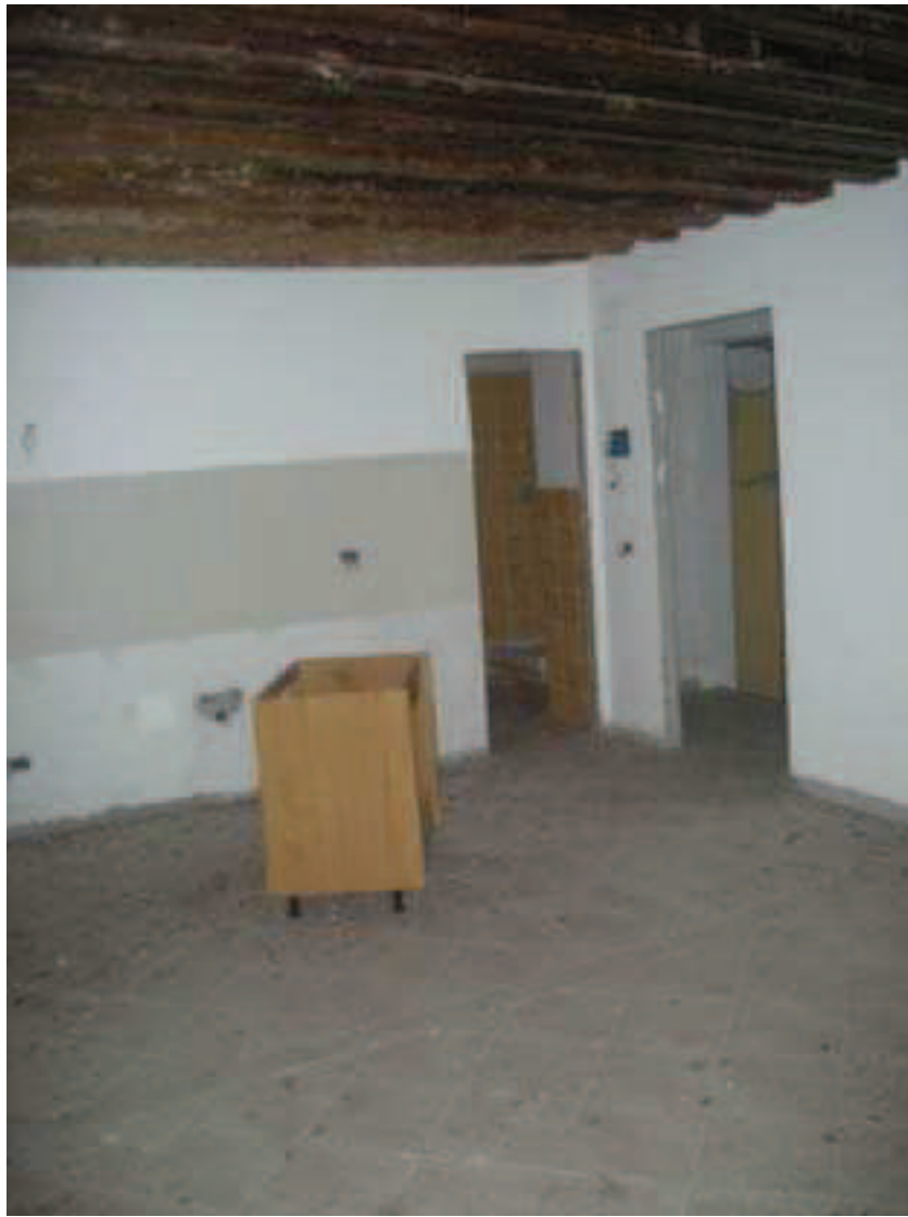
Bb. 10 - int. 7