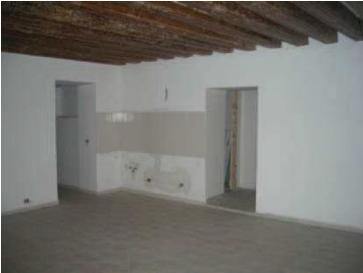
Bb.15 - int. 7