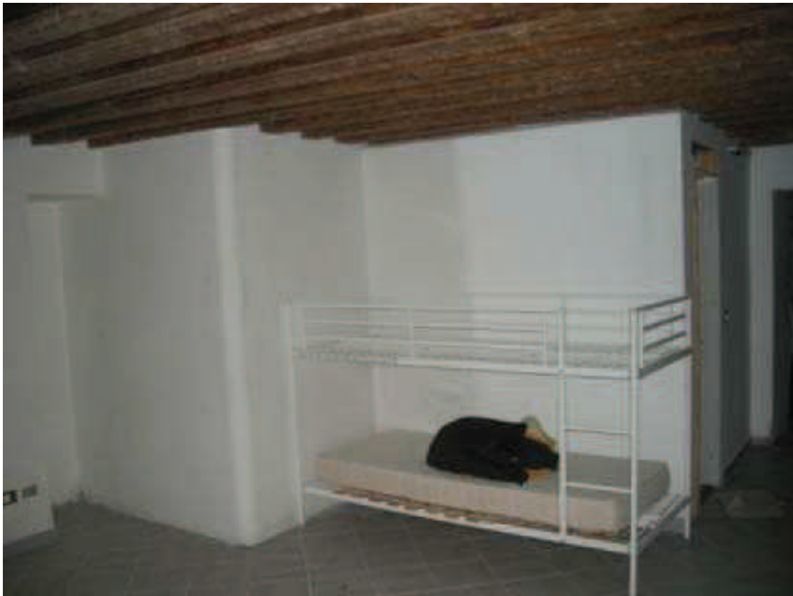
B12 - Camera