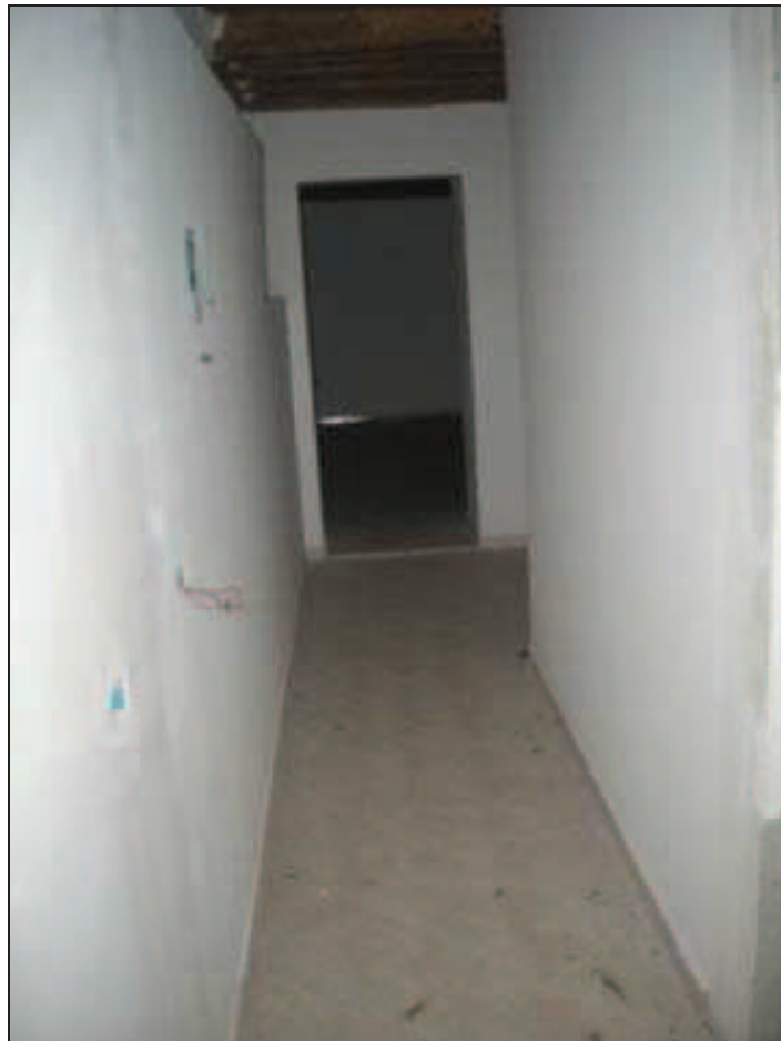
Bb.13 - int. 7