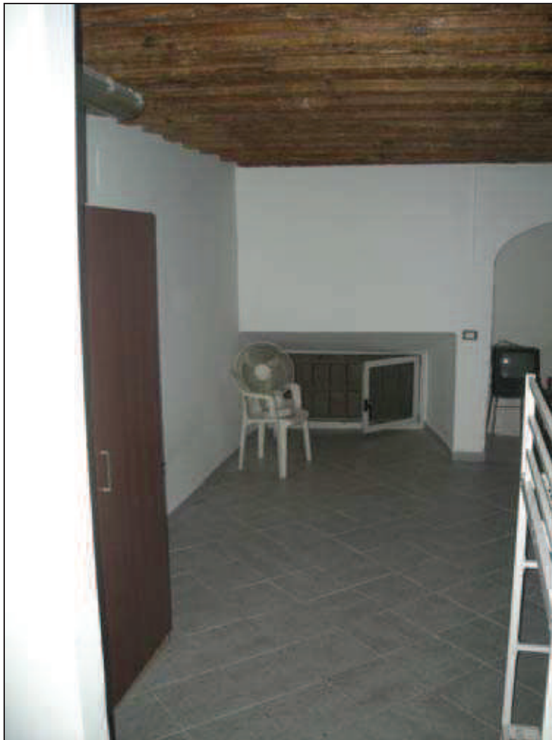
B8 - Int. 6 - Finestra Camera