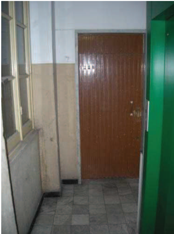
Bb.0 - int. 7- Porta caposcala