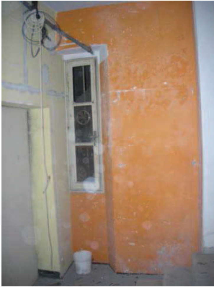
Bb.2 - int. 7- Ingresso