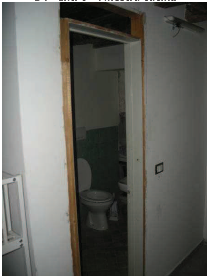
B5 - Int. 6 - Bagno