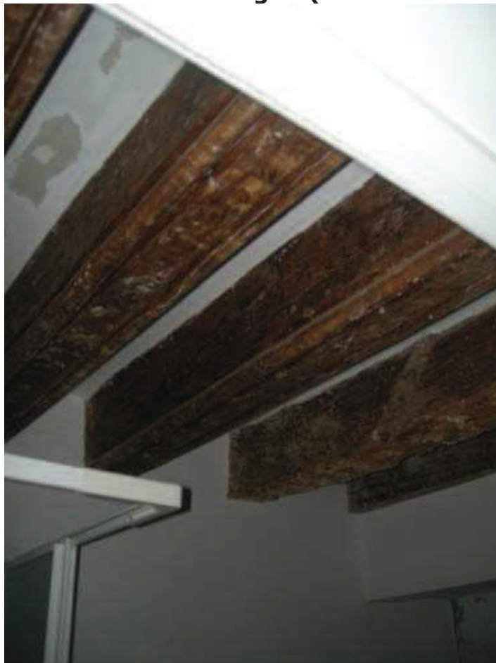
B7 - Int. 6 - Soffitto bagno