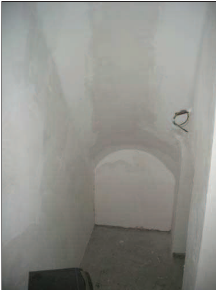
B10 -Int. 6 - ex vano scala interna