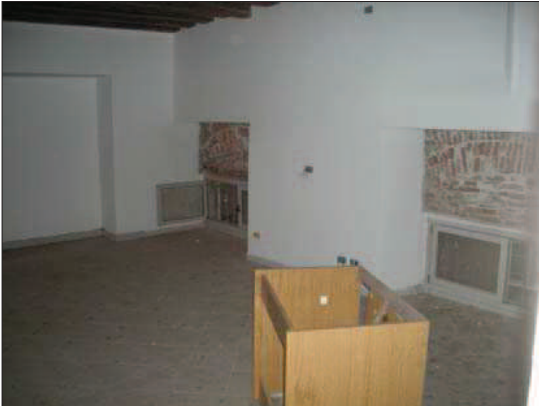
Bb. 11 - int. 7