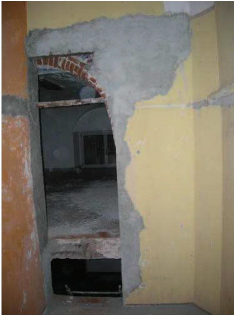
Bb. 4 - int. 7- Ingresso