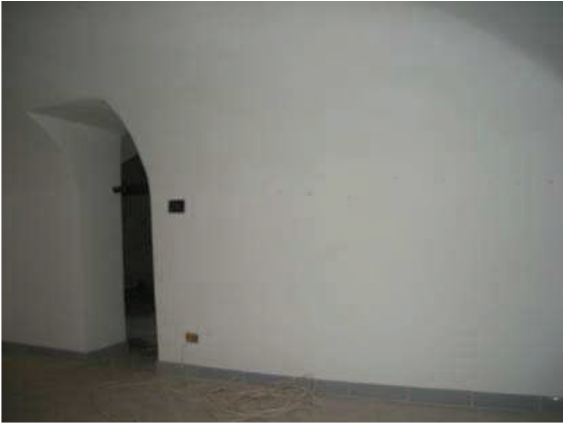
Bb. 8- int. 7