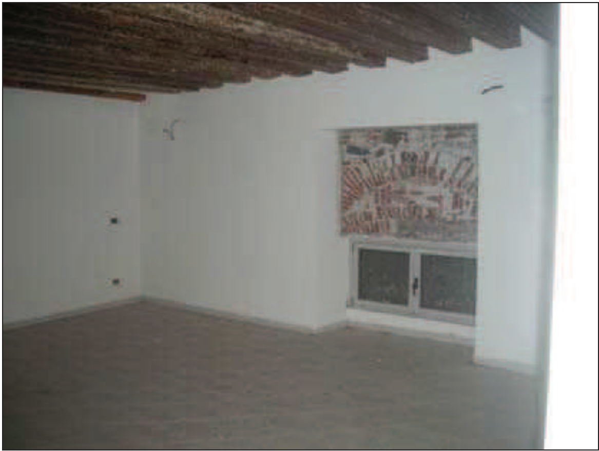
Bb.14 - int. 7