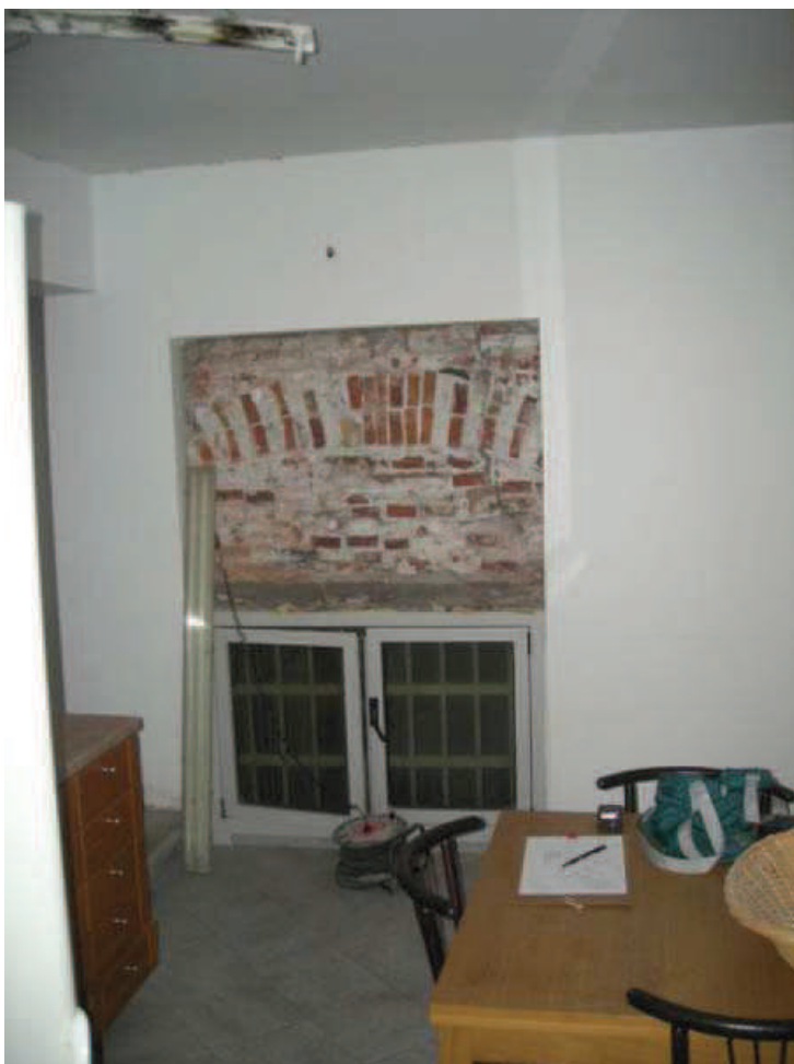
B4 - Int. 6 - Finestra cucina