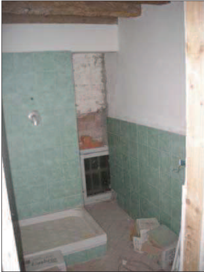
Bb. 16 - int. 7 wc (v. foto B6 int.6)