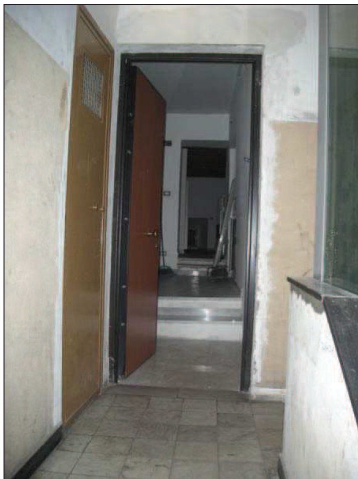
B1 - Int. 6 - Porta caposcala e ingresso