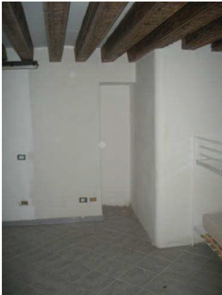
B11 - Camera