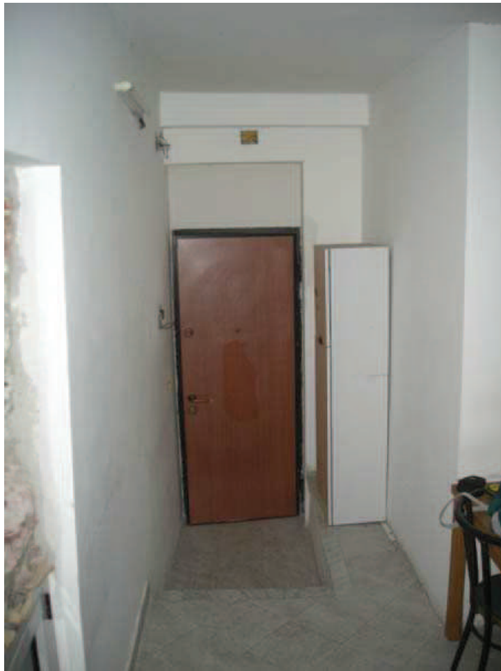
B2 - Int. 6 - Ingresso