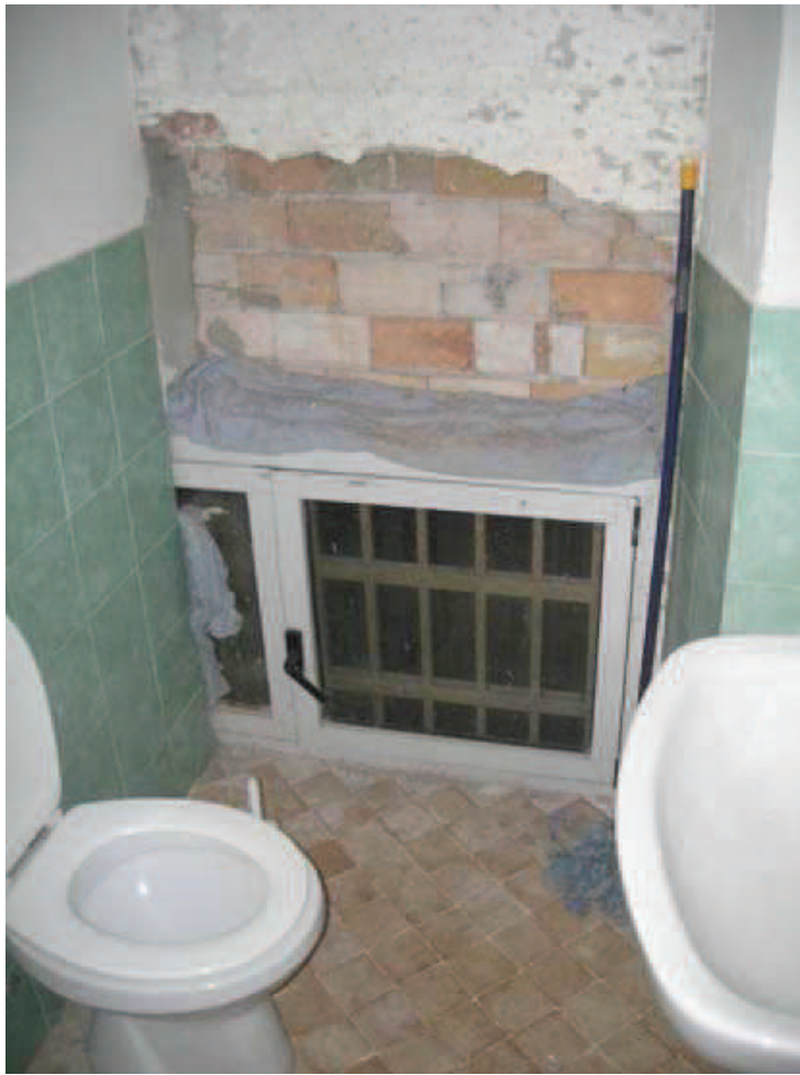
B6 - Int. 6 - Finestra bagno (v. foto Int. 6 - 16)