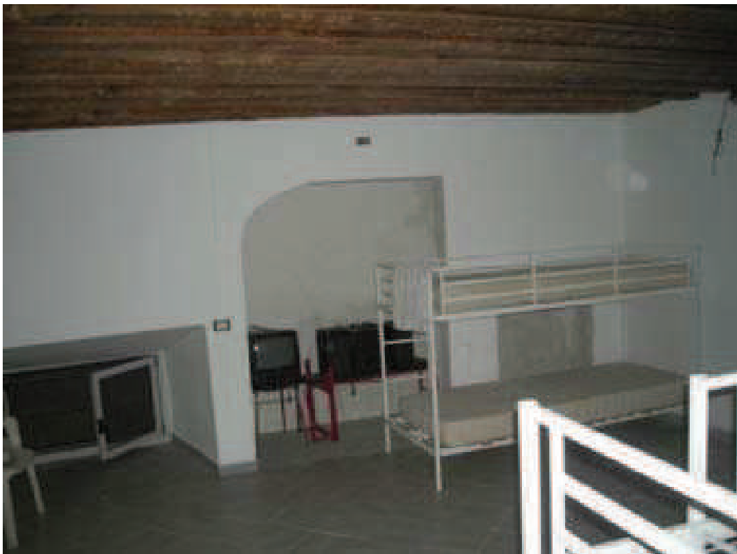
B9 - Int. 6 - Camera