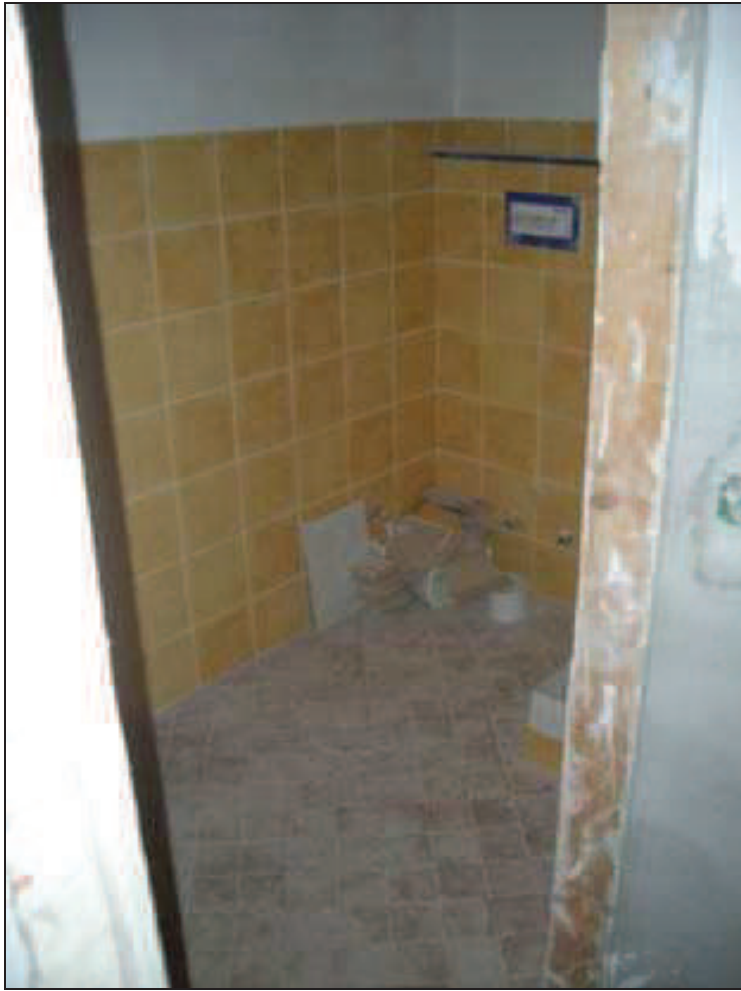
Bb.12 - int. 7