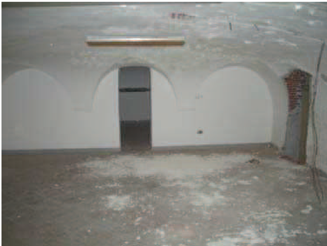
Bb.5 - int. 7