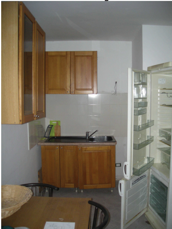
B3 - Int. 6 - Cucina