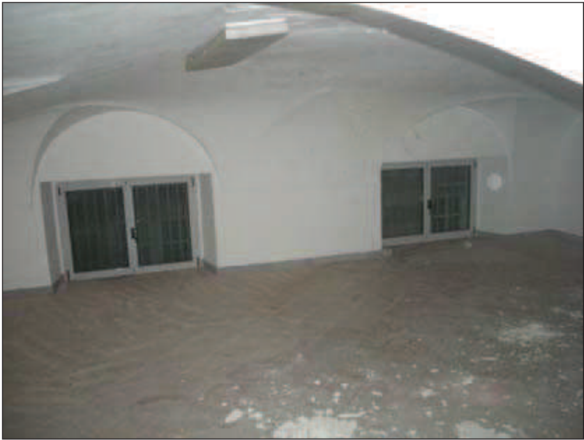
Bb. 6 - int. 7