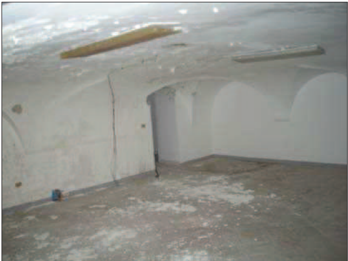
Bb.7- int. 7