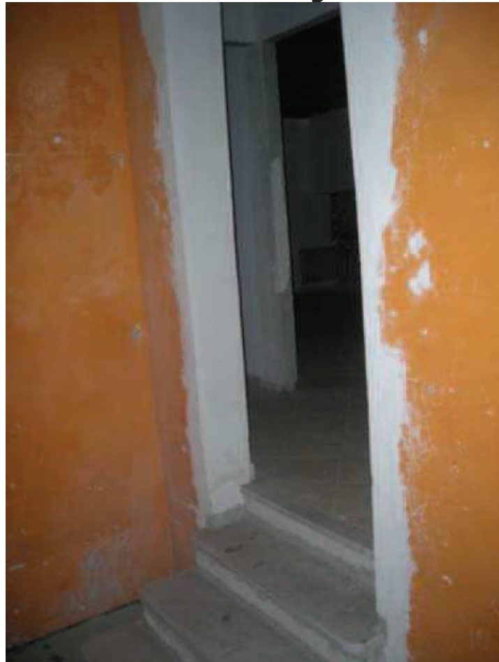
Bb.3 - int. 7- Ingresso