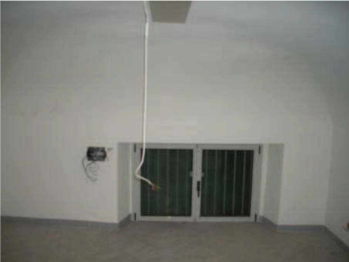
Bb. 9 - int. 7