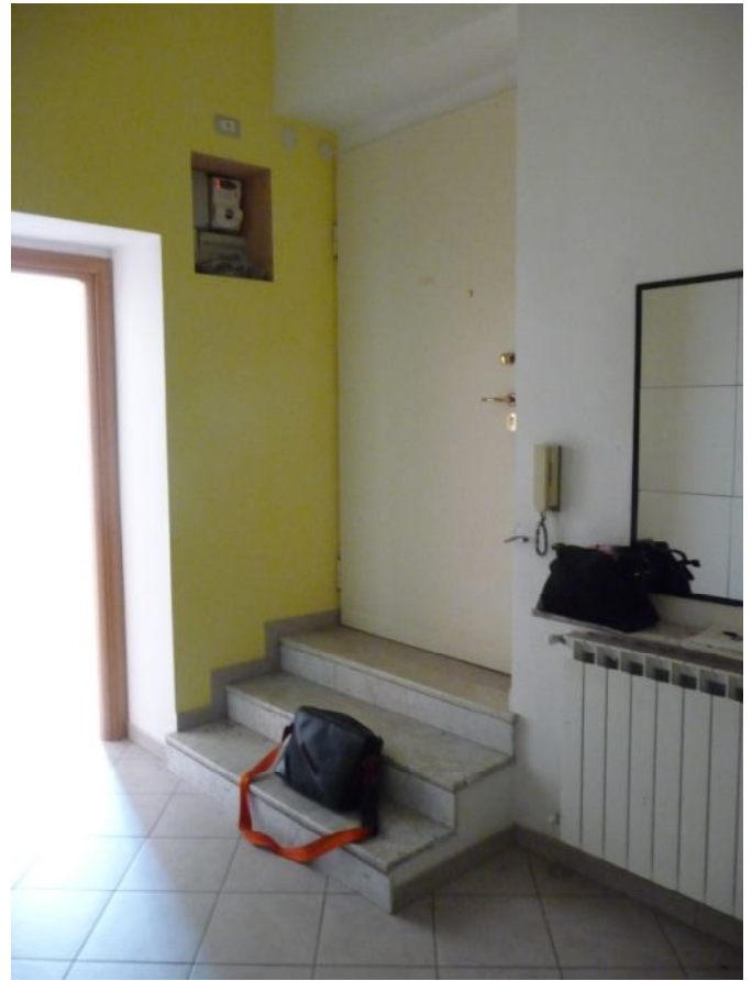
Foto 6. Porta di ingresso.