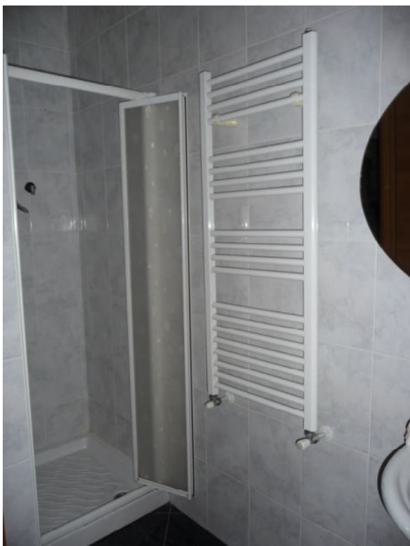
Foto 11. Bagno.