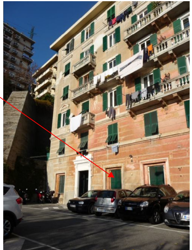
Foto 2 . Il portone civ. 26 e piazzale antistante .