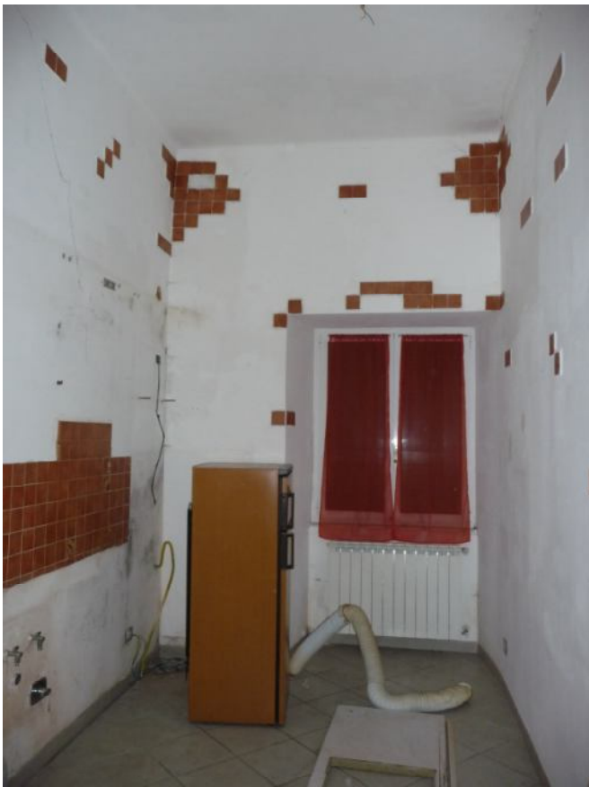
Foto 7. Cucina