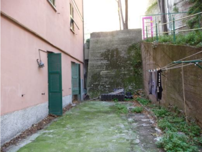
Foto 1. Lo spazio condominiale retrostante l'edificio.