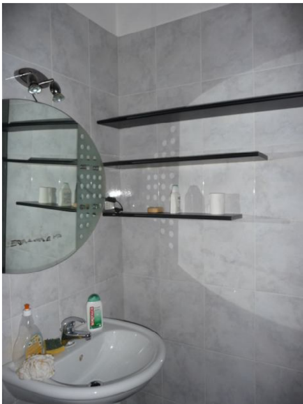
Foto 9. Bagno.