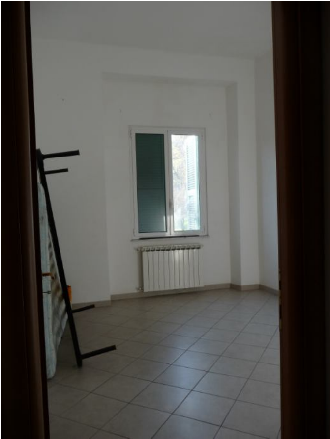
Foto 5. Stanza affacciata a sudsul piazzale.