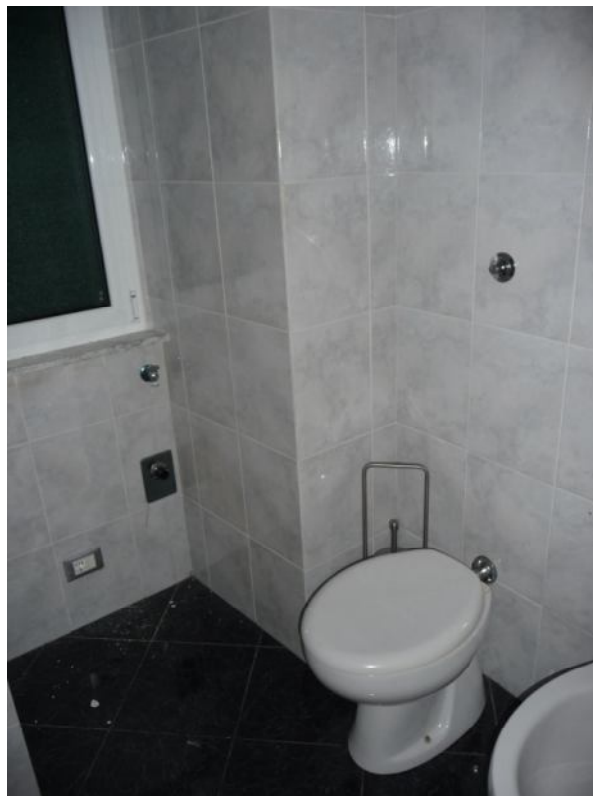
Foto 10. Bagno.