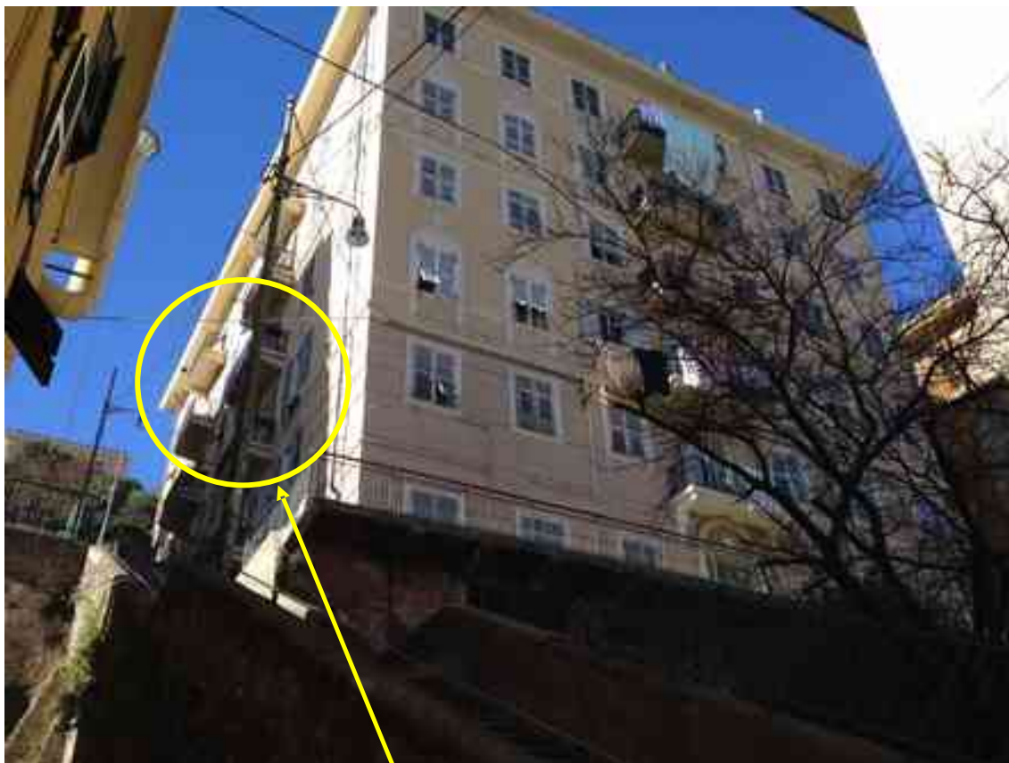
FOTO 4: Scorcio sud/est del civ. 15 dell'edificio civ. 15 di Via A. Centurione. Sottolineate con linea gialla il poggiolo e le altre finestre dell'int. 10 sc.A.