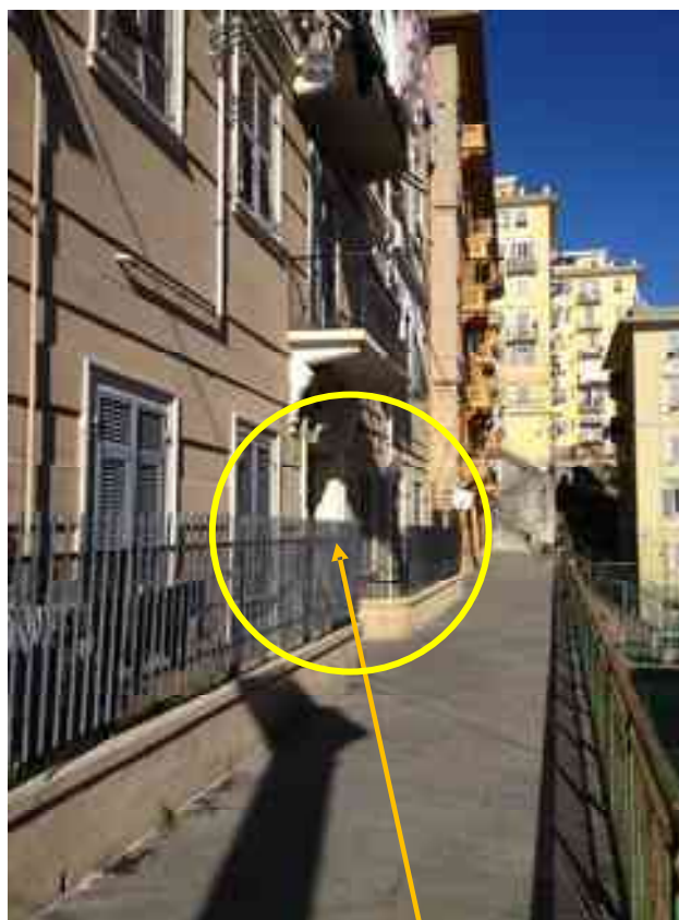
FOTO 6: Fronte est del civ. 15 di via A. Centurione. Il Portone d'ingresso del caseggiato.