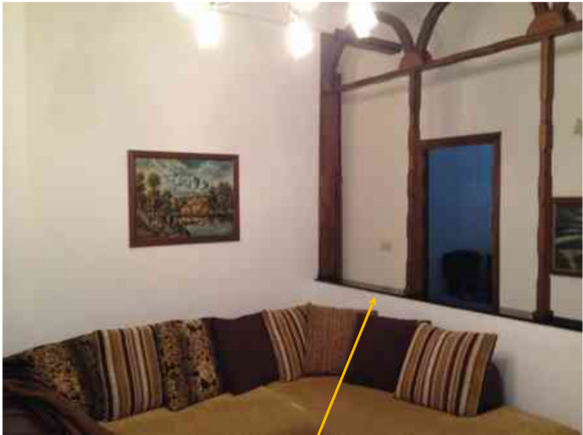
FOTO 14: Soggiorno. Indicato da freccia il muretto di divisione con arcata soprastante in legno, realizzato per creare un corridoio di disimpegno dalle camere.