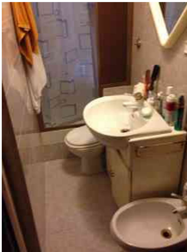
FOTO 21: Bagno, come risulta a seguito delle lievi modifiche subite.