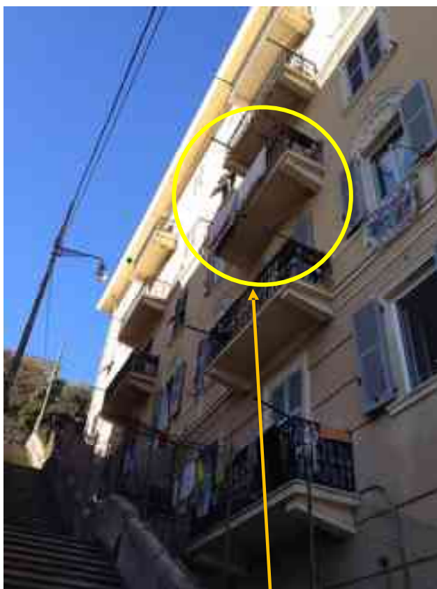
FOTO 5: Fronte sud del civ. 15 di via A. Centurione. Nel cerchio giallo il poggiolo dell'int. 10 sc. A.