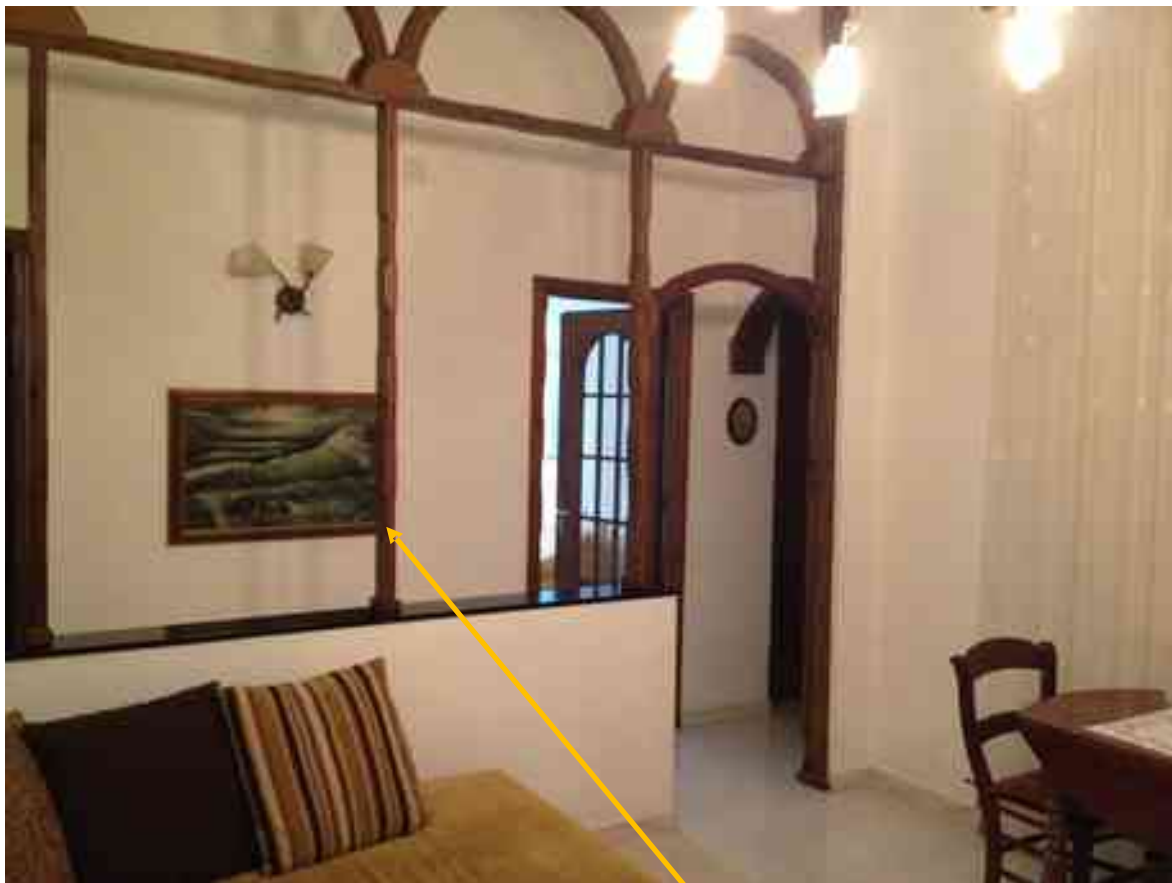
FOTO 13: Soggiorno. Indicato da freccia il muretto di divisione con arcata soprastante in legno, realizzato per creare un corridoio di disimpegno dalle camere.