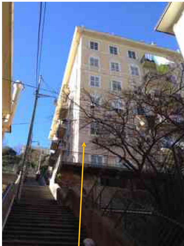
FOTO 3: scalinata partente da via A. Centurione. Scorcio sud/est del civ. 15 STUDIO TECNICO DOTT. ARCH. GIORGIO PARODI