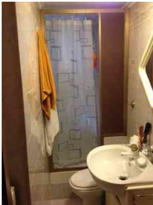
FOTO 22: Il bagno, come risulta a seguito delle lievi modifiche subite.

A maggior chiarimento si vedano gli elaborati grafici: Allegati n. 1 – 2 e 3.