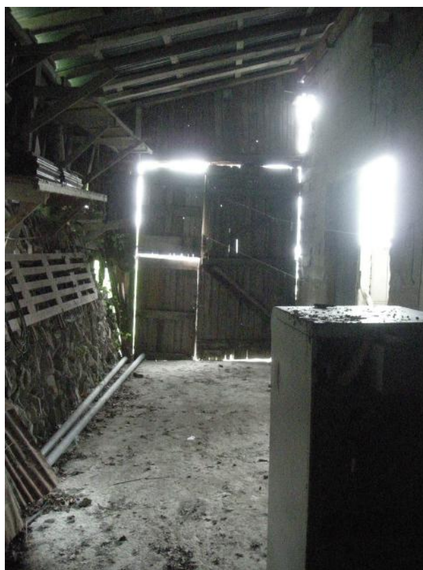
8 – Piano sottostrada - sub. 2 - Deposito