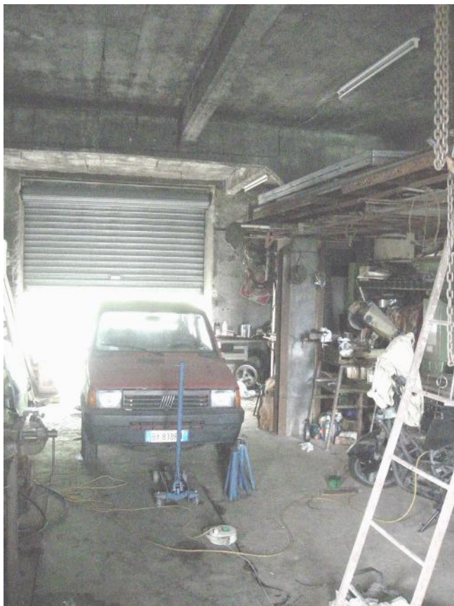
11 – Civ. 3 - Piano terra - sub. 3 - Magazzino