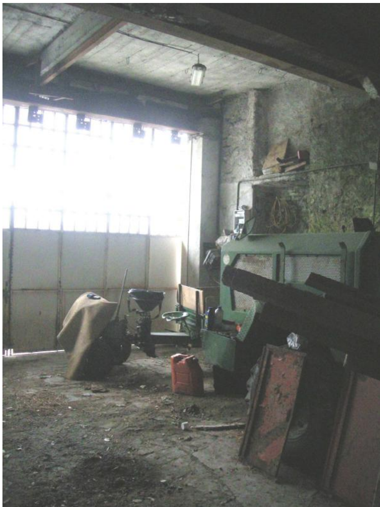
6 – Civ. 1 - Piano sottostrada - sub. 1 - autorimessa