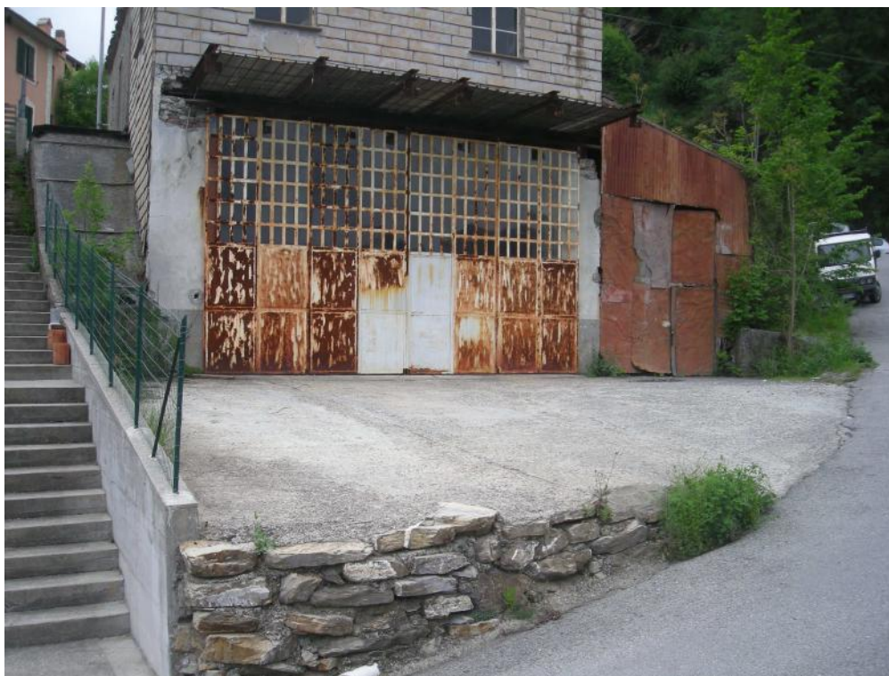
10 – Piano sottostrada - sub. 4 - Cortile Bene Comune non censibile