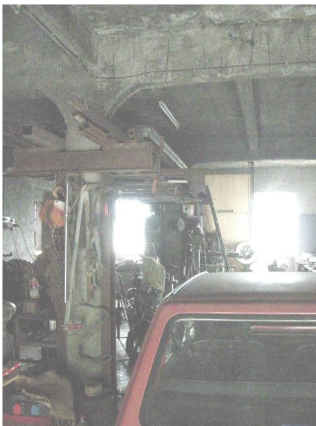
12 – Civ. 3 - Piano terra - sub. 3 - Magazzino