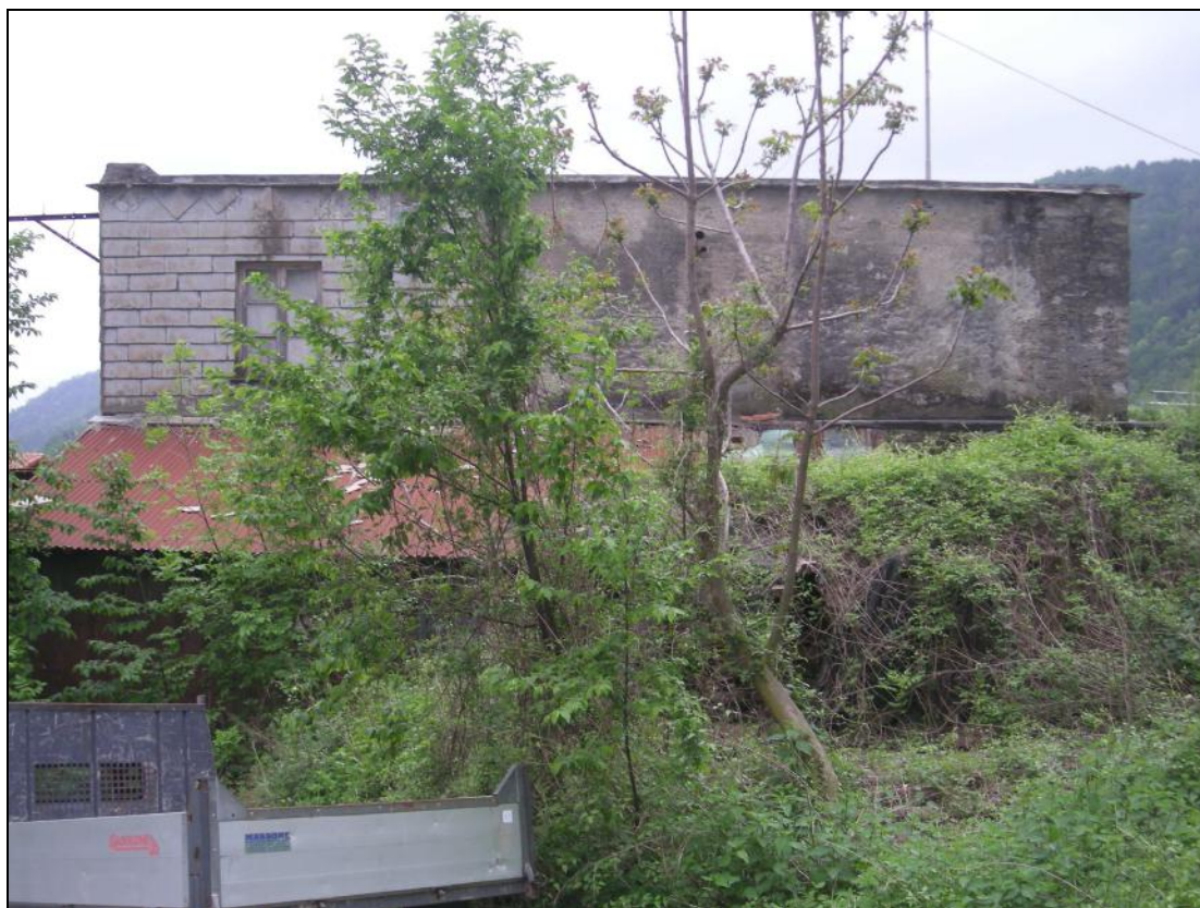
3 – Prospetto Nord