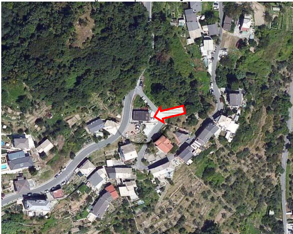
1 – Vista aerea zenitale