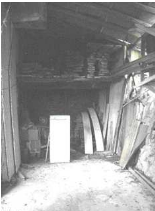
8 – Piano sottostrada - sub. 2 - Deposito