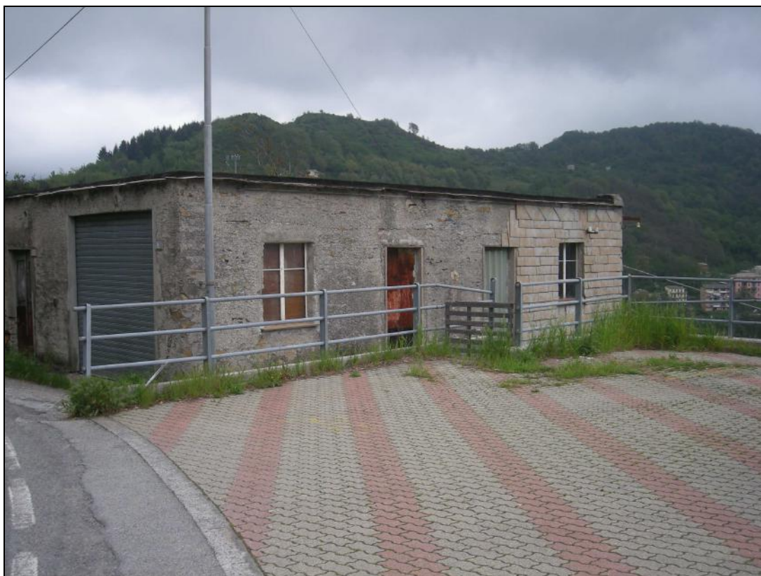
4 – Prospetto Sud