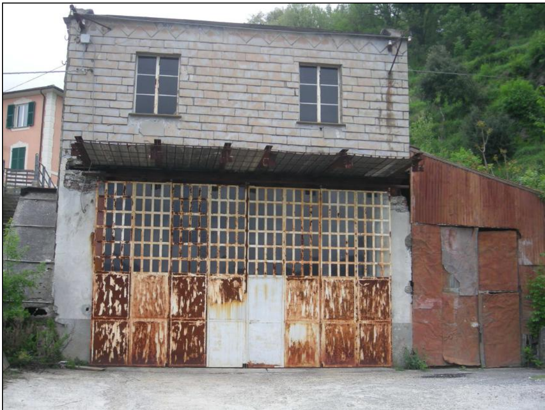
2 – Prospetto Est