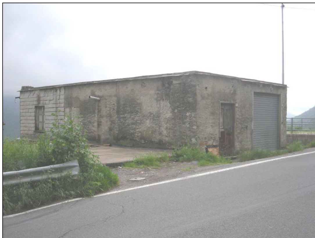
5 – Prospetti Ovest e nord