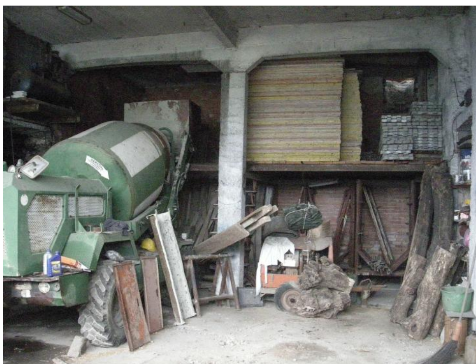
7 – Civ. 1 - Piano sottostrada - sub. 1 - autorimessa