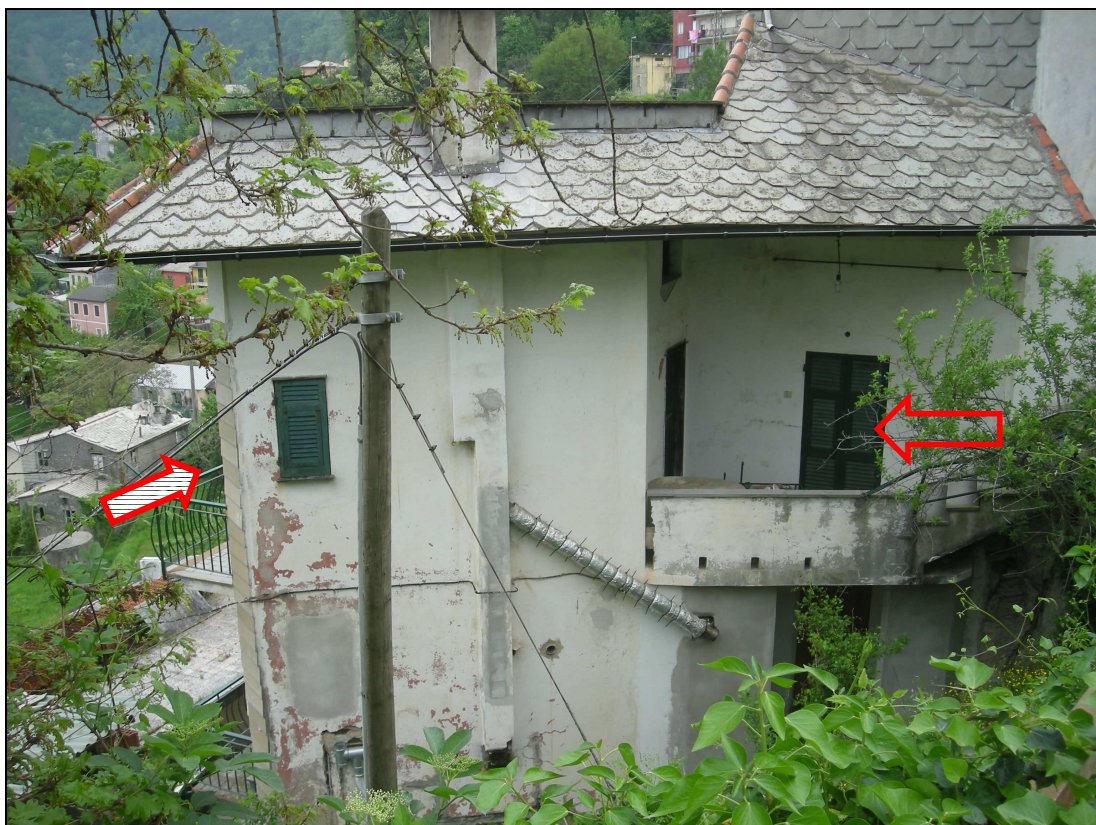
4 – Prospetto Est