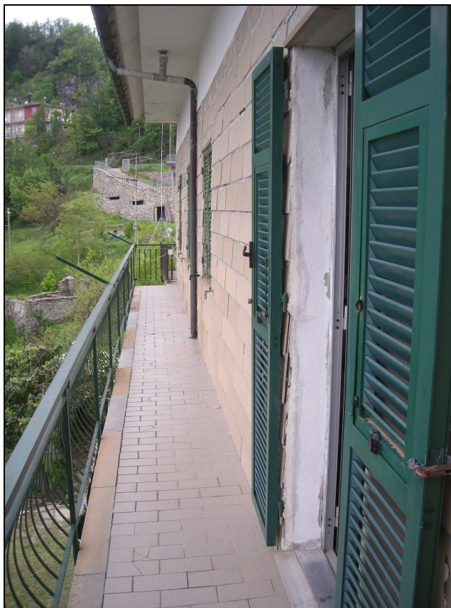
12 - poggiolo