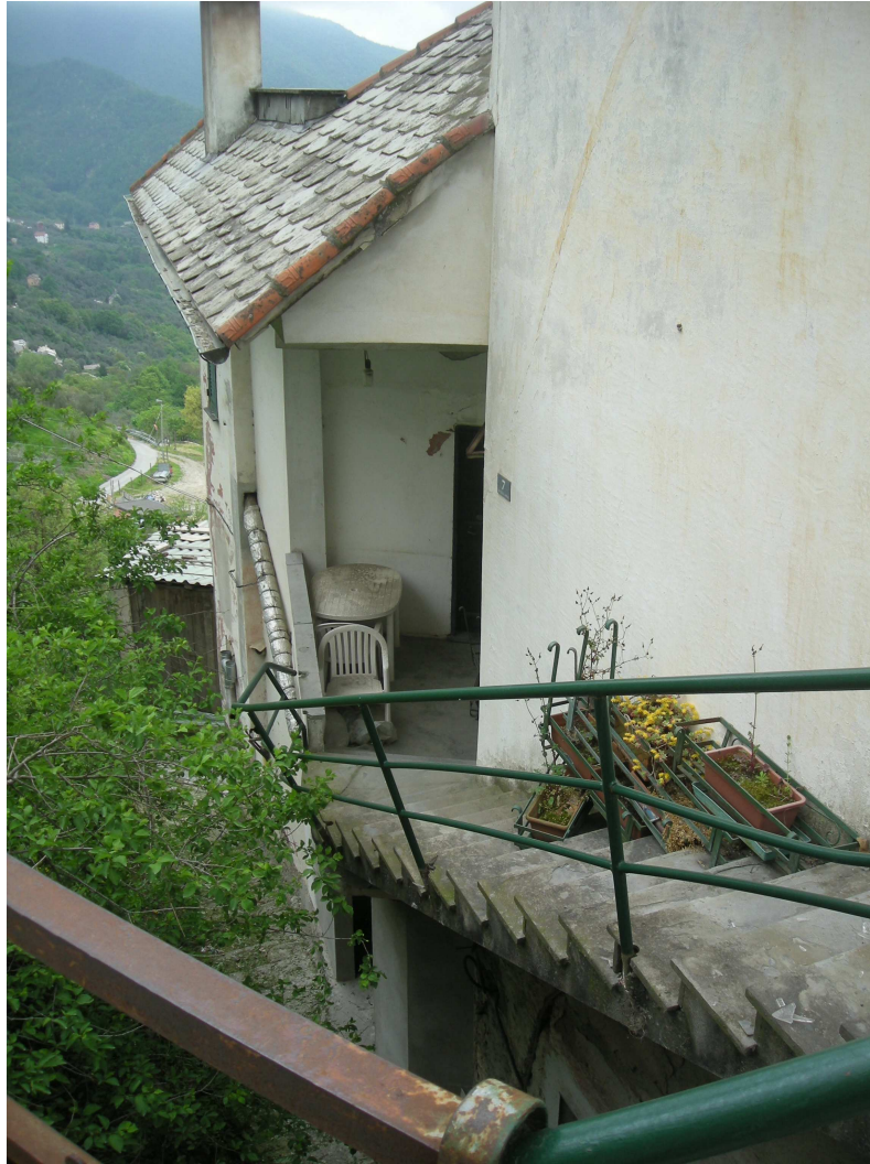
6 – Terrazzino d'ingresso