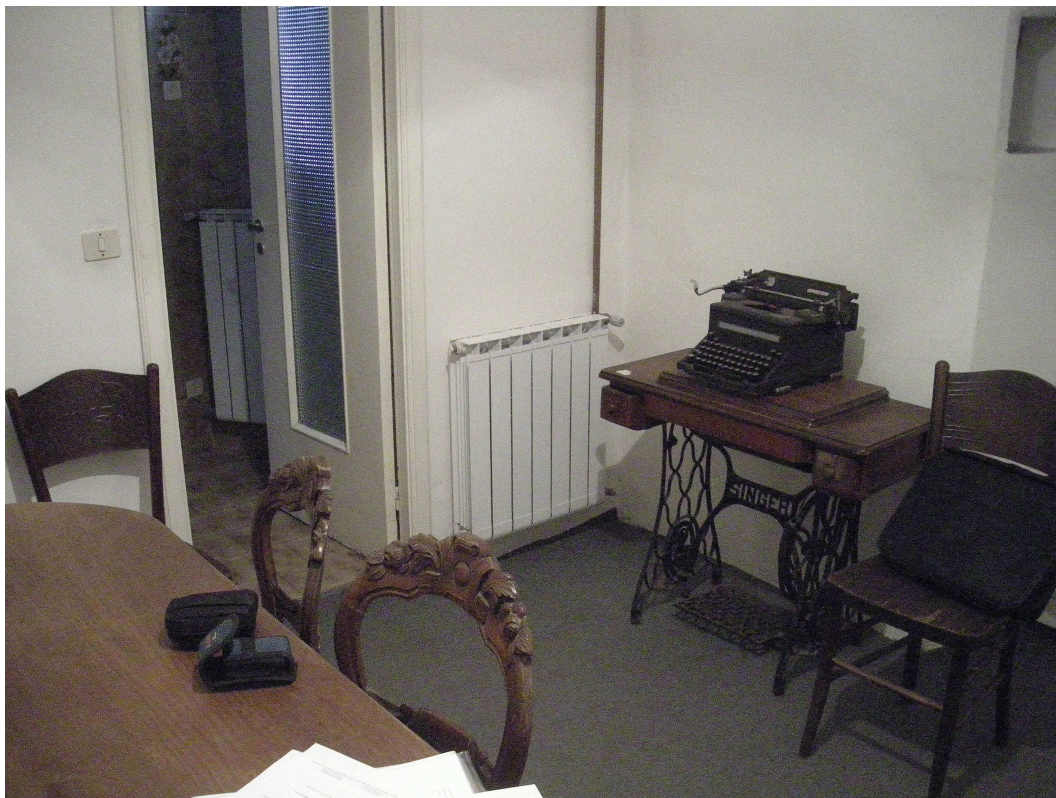
7 – Ingresso - soggiorno