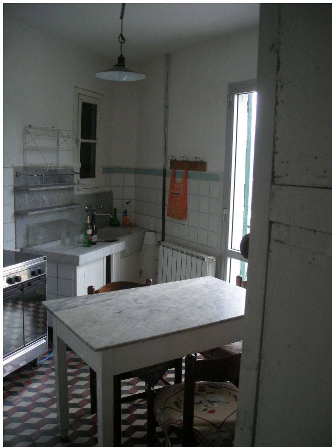
9 – Cucina