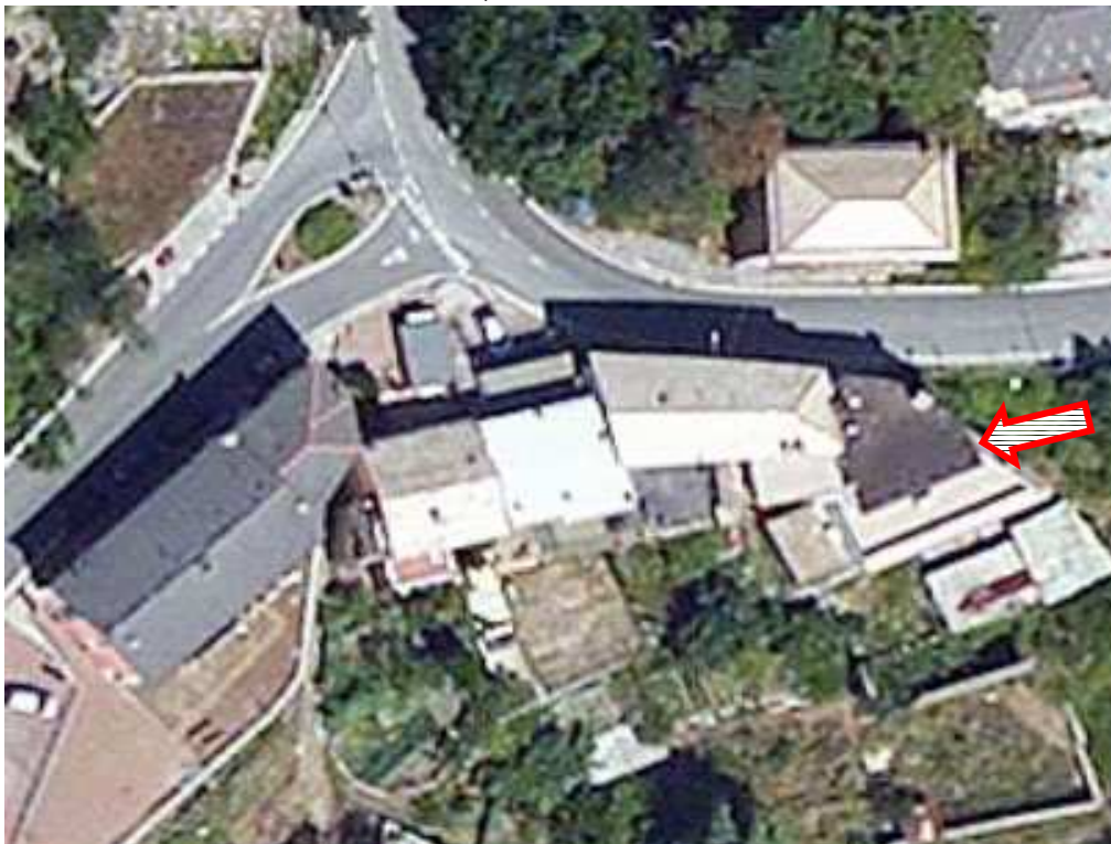
1 – Vista aerea zenitale