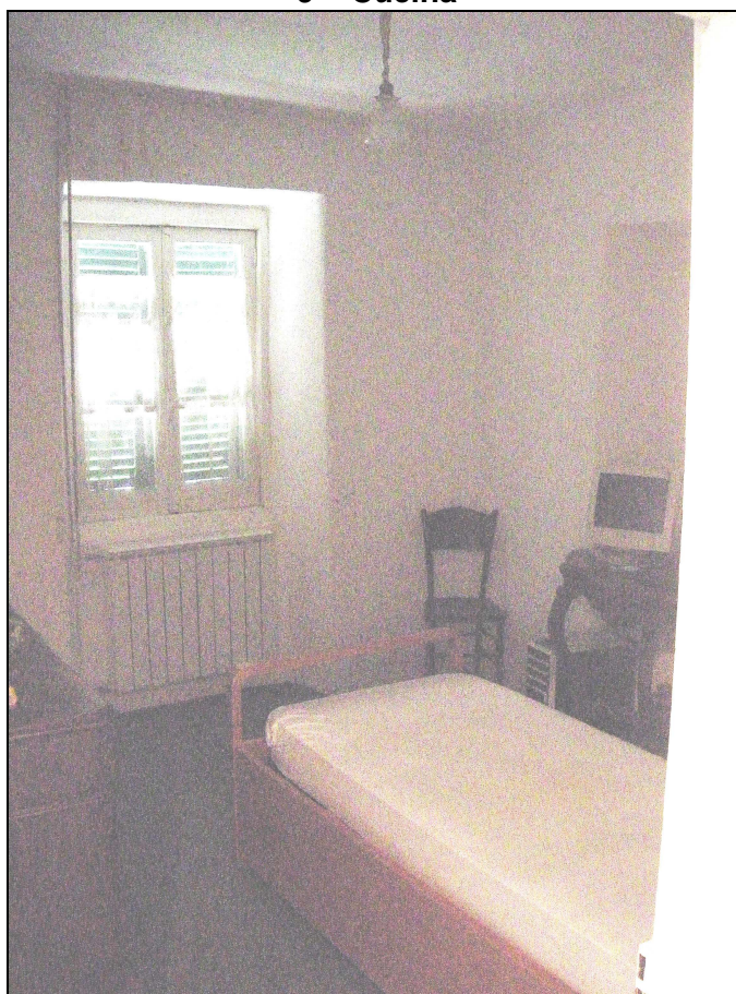
10 – Camera sud ovest