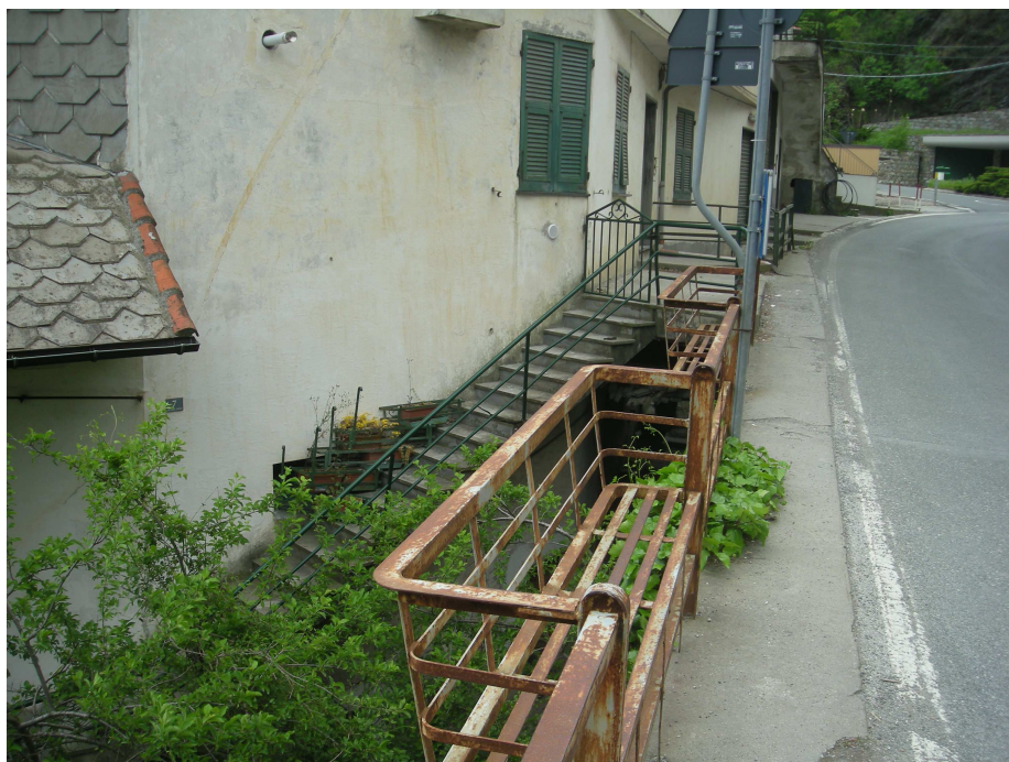
5 – Accesso dalla S.S. 333