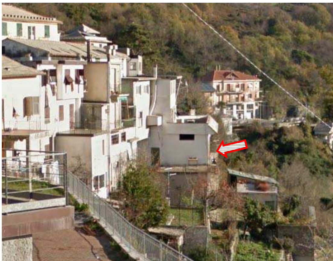
2 – Prospetto Ovest