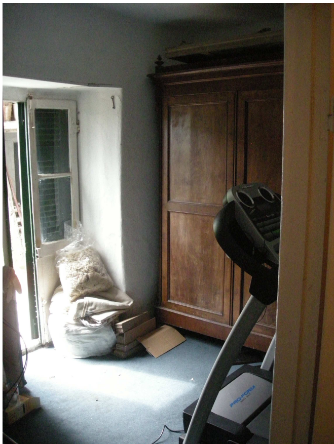
11 – Camera ovest