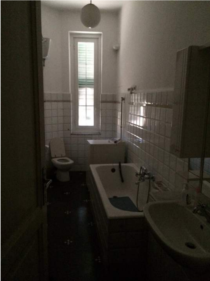
Vista del bagno.