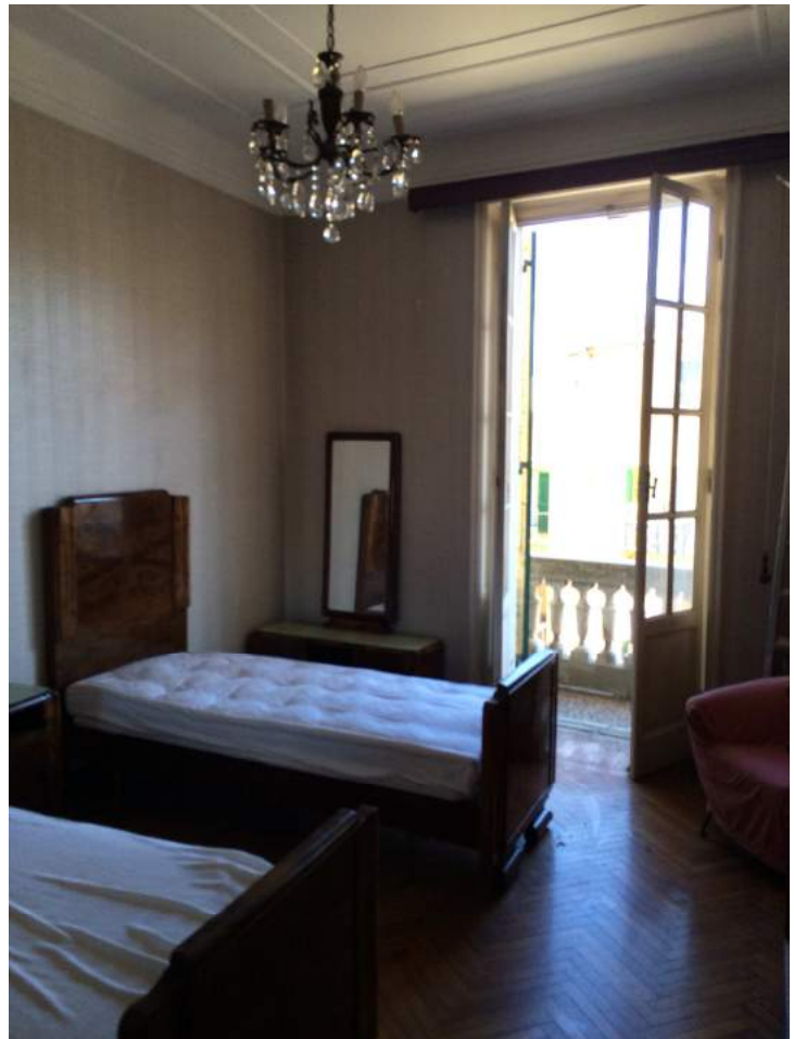
Vista della camera da letto.