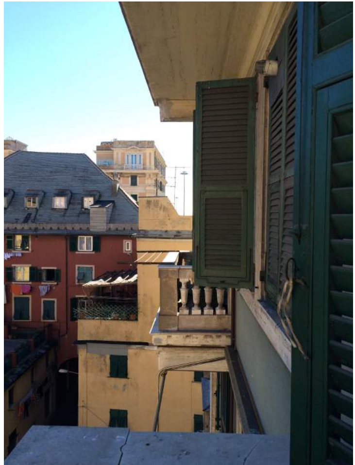
Vista laterale dal balcone della camera da letto verso il balcone del soggiorno (sono visibili le finestre di bagno e cucina).