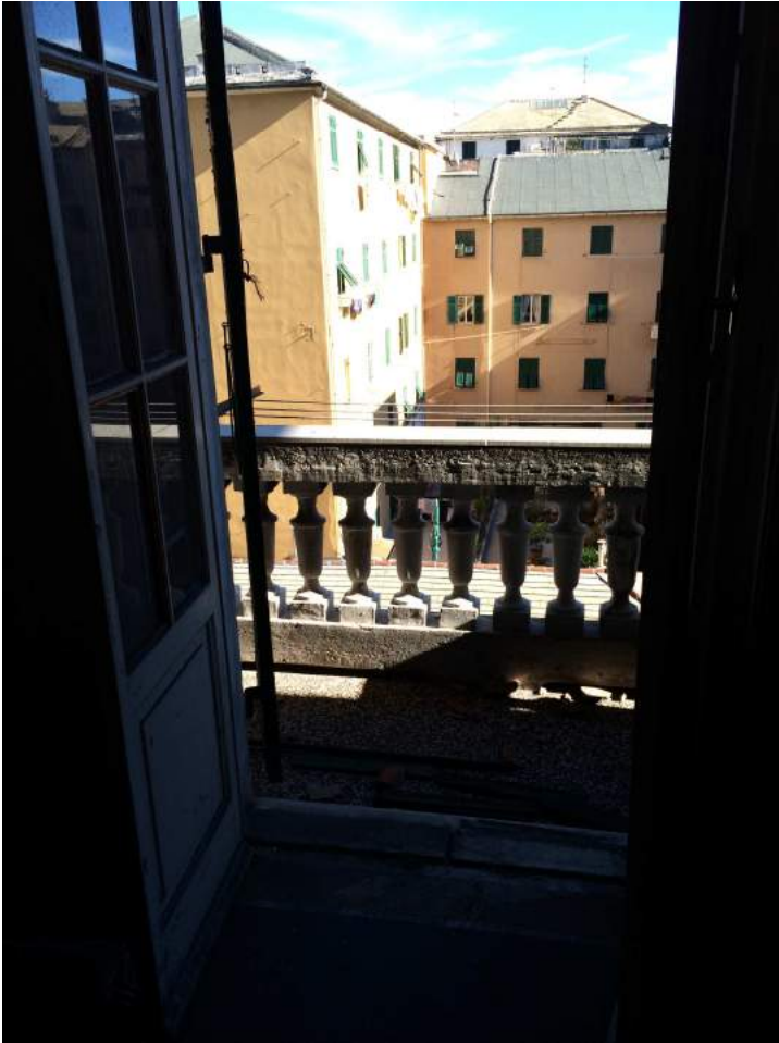
Vista dalla finestra del soggiorno.