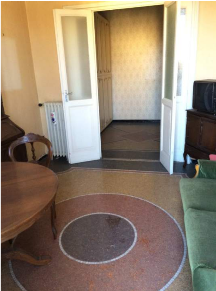
Vista del soggiorno e dell'ingresso.