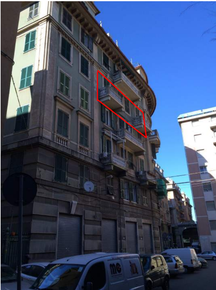
Vista della facciata su via Mamiani con indicazione dell'appartamento periziando.