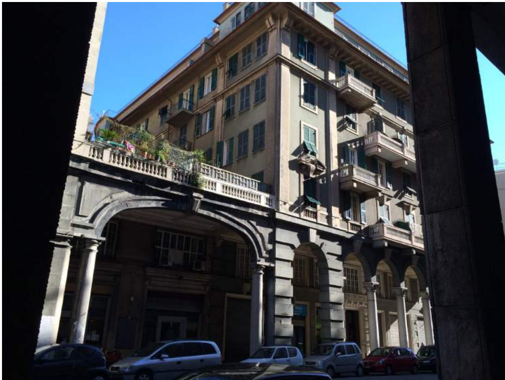
Vista dell'edificio da via Molteni.