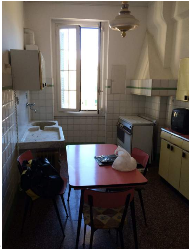
Vista della cucina.