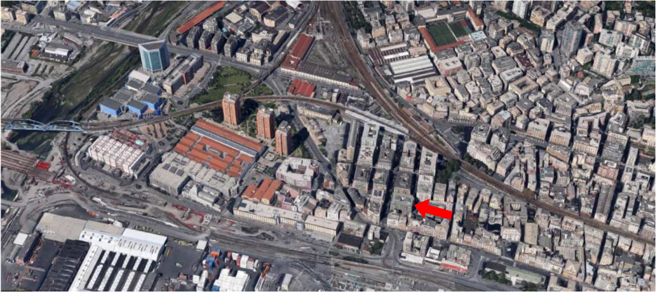
Vista aerea dell'edificio nel contesto urbano.