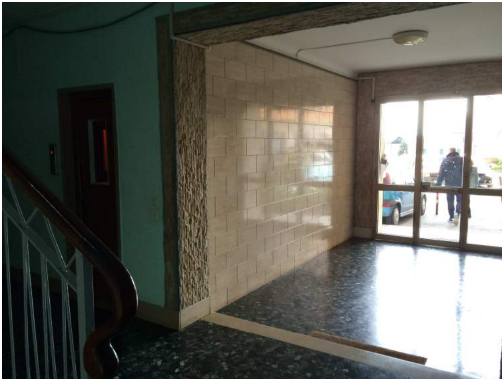
Vista dell'androne d'ingresso condominiale.