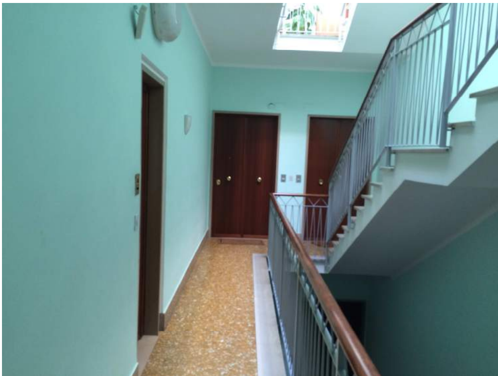
Vista del portoncino caposcala (a destra)