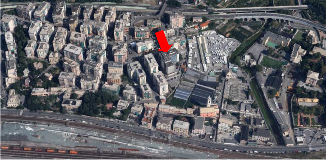
Vista aerea dell'edificio nel contesto urbano.