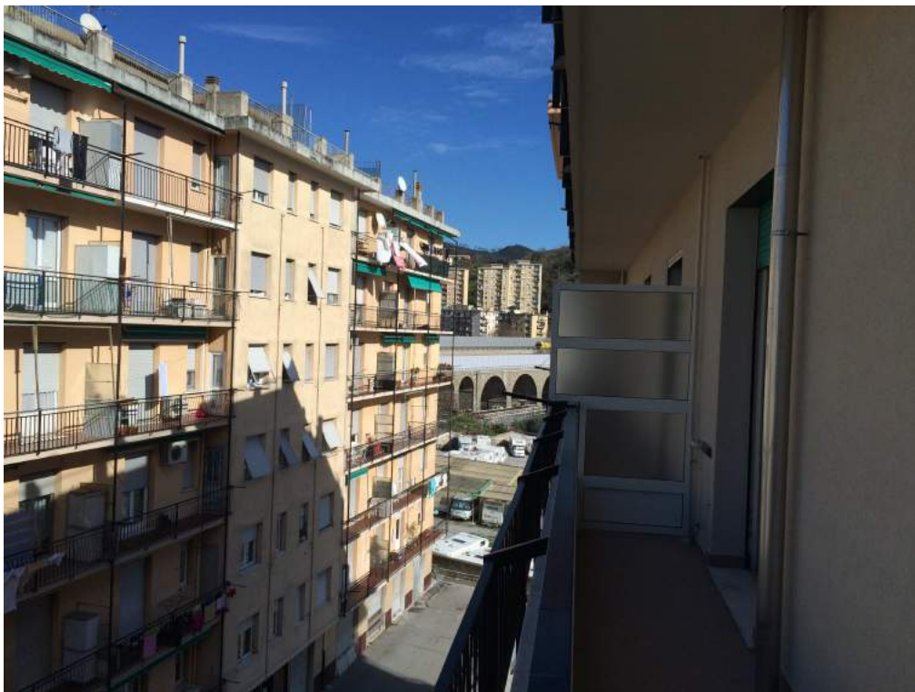
Viste panoramiche dal balcone.