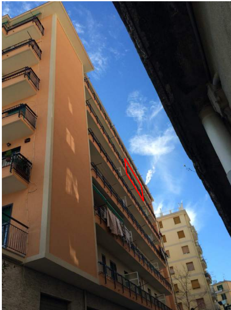
Vista dell'edificio dalla strada condominiale interna con indicazione dell'appartamento periziando.