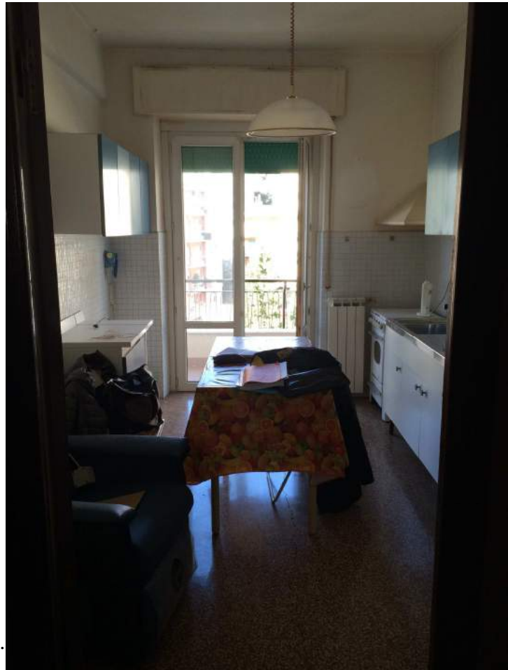
Vista della cucina.