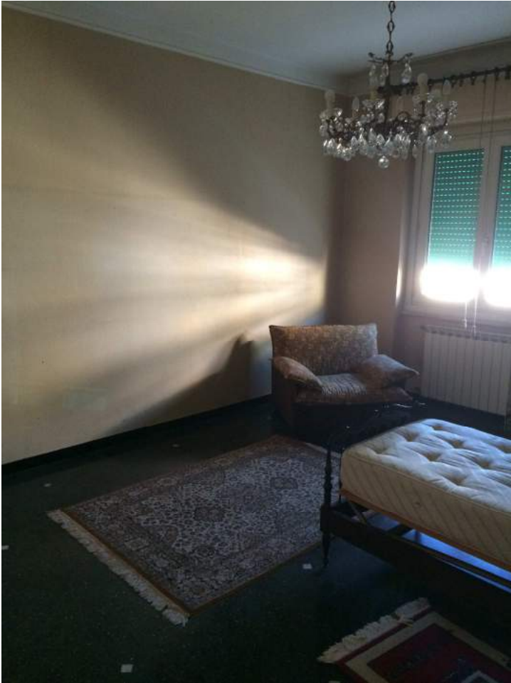
Vista della camera da letto.