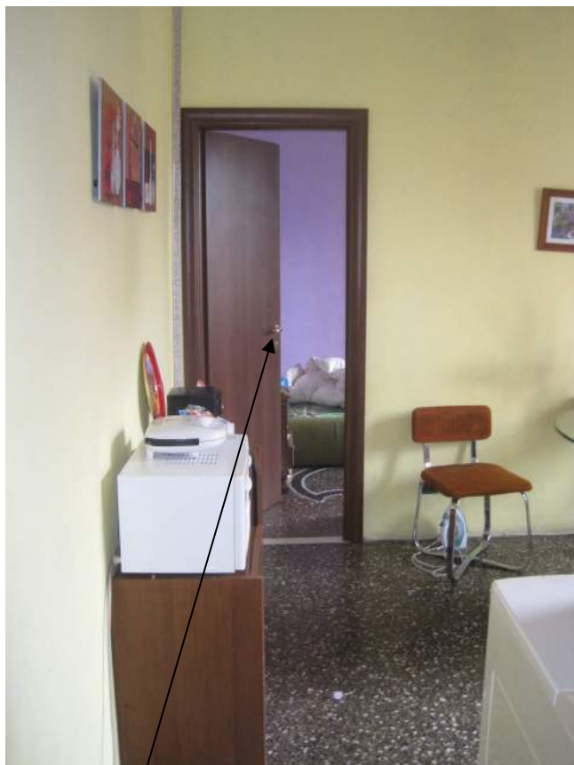
Porta aperta tra cucina e camera. FOTO 11