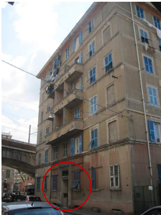
(L'ingresso all'edificio è cerchiato in rosso) FOTO 1