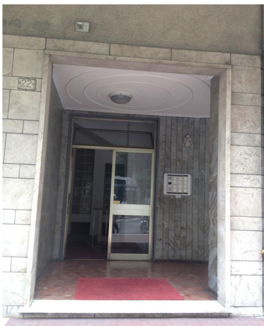
FOTOGRAFIA 1 2