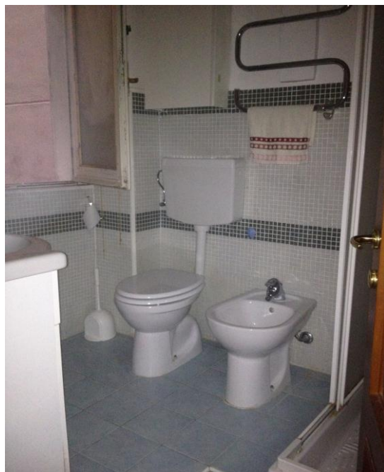
FOTOGRAFIA 7 8