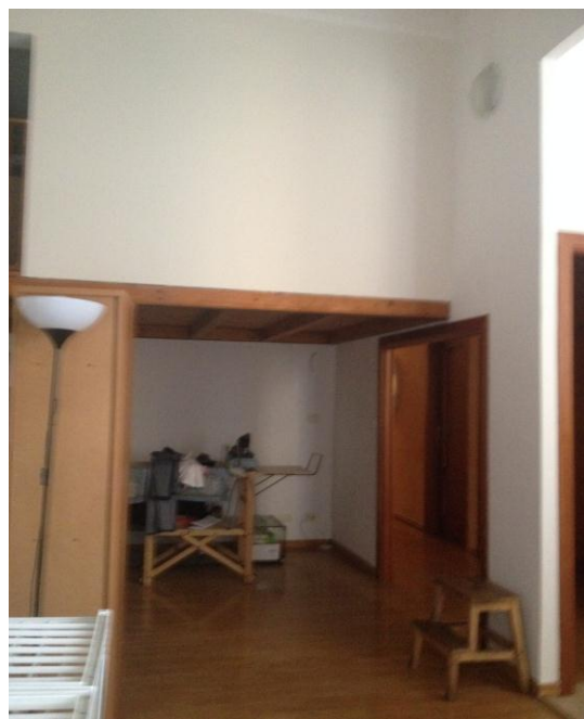
FOTOGRAFIA 5 6